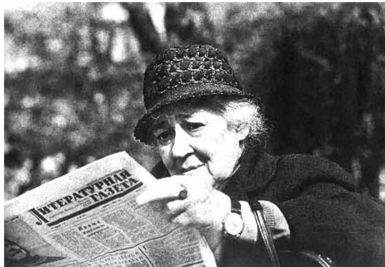
А помним её такой...

Весной 1917-го Фаина узнала, что вся её семья эмигрировала в Турцию. Тогда семья Вульф взяла её с собой, зачислив в ряд близких родственников. В конце 1924-го молодая актриса снова оказалась в Москве, где