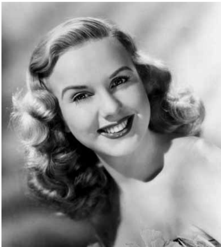
Такой Фаина была в 17 лет