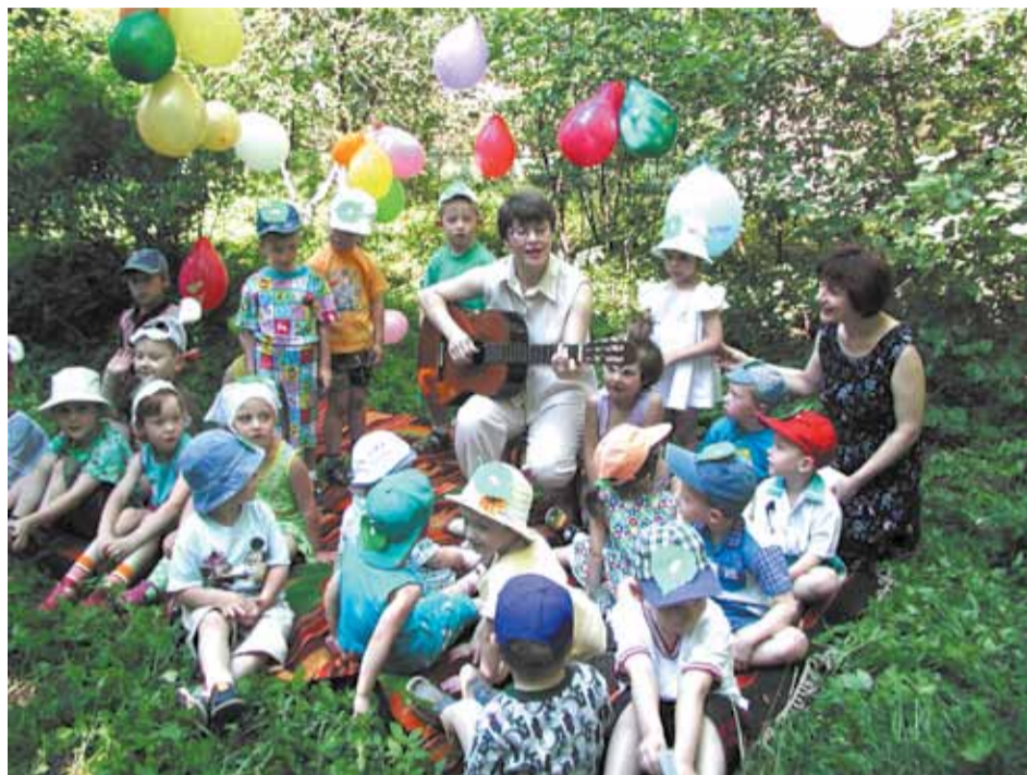
Перемены ради будущего наших детей

— Для меня важно, что в последнее время больше внимания областное Правительство стало уделять миграционной политике. Проблема нелегальных мигрантов остро стоит и у нас в регионе, и в Москве. Я знаю, что проводятся совместные рейды, которые помогают выявить нелегальных рабочих. Давно такой активной работы в этом направлении не было, а ведь она просто необходима. В Юбилейном в МУП «ЖКО», например, работают иностранцы. Но вопрос их трудоустройства решён абсолютно законно. Предприятие закупает квоту на иностранную рабочую силу (например, МУП «Спортивные сооружения», «Удачная покупка»), и работники име-