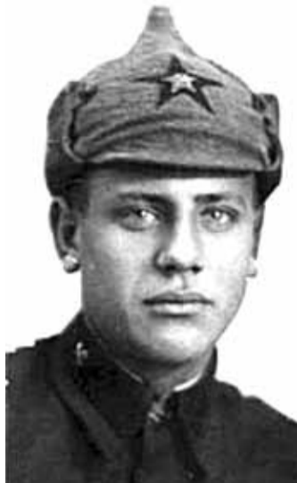
Доброволец Красной Армии, 1939 г.