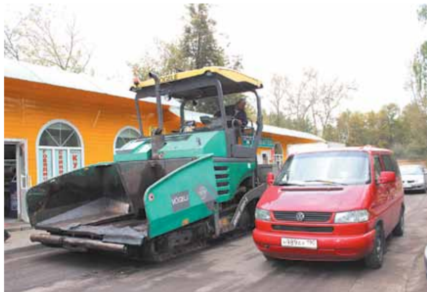
Техника готовится к асфальтированию