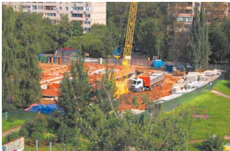
Строительство детского сада идёт полным ходом

В настоящее время уложены все фундаментные блоки, закончена кирпичная кладка цоколя, прокладываются коммуникации. Рабочие трудятся в две смены. Однако, по мнению Главы города, нужно ещё и ещё увеличить число рабочих. Иначе к 1 ноября (плановому сроку окончания стройки) корпус детского сада с отделкой не будут готовы. А это значит, что финансовая поддержка из областного бюджета не дойдёт до «ТЕХНОСТРОЯ», от чего пострадают