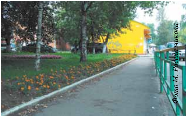
Клумба в 3-м микрорайоне радует прохожих

Создатели проекта важным фактором привлекательности рекреационных зон называют безопасность. Непосредственная ответственность за неё возлагается на отдел благоустройства МУП «ЖКО». В парках и скверах должен обеспечиваться комплекс мер по предупреждению несчастных случаев, оказанию медицинской помощи, в том числе и доврачебной, эвакуации граждан в безопасное место. Важной составляющей безопасного отдыха, безусловно, является своевременное информирование посетителей парка о потенциаль-