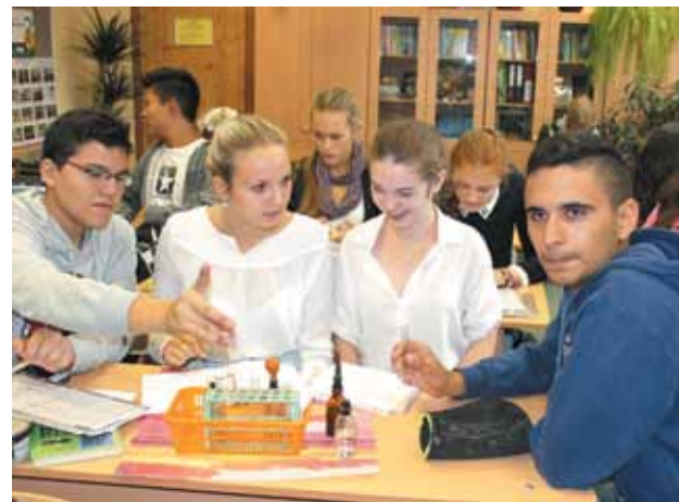
Гости из Италии на уроке химии – первом из уроков, проведённом для них в гимназии № 5

3 сентября по приглашению гимназии № 5 в г. Юбилейный прибыла делегация школьников из итальянского города Реджио Калабрия. Для встречи гостей в аэропорту Администрация города предоставила автобус. Девять дней тринадцать старшеклассников и их педагог будут жить в гостеприимных семьях гимназистов.