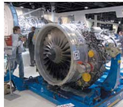
На стенде – авиационный двигатель

В лётной программе на «МАКС-2013» участвовали «Русские Витязи» (Су-27), «Стрижи»