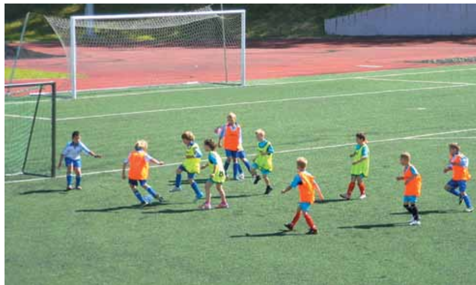
Тренируются воспитанники ДЮСШ «Чайка»

Однако... получается, что на сегодняшний день чуть ли не единственным источником информации о