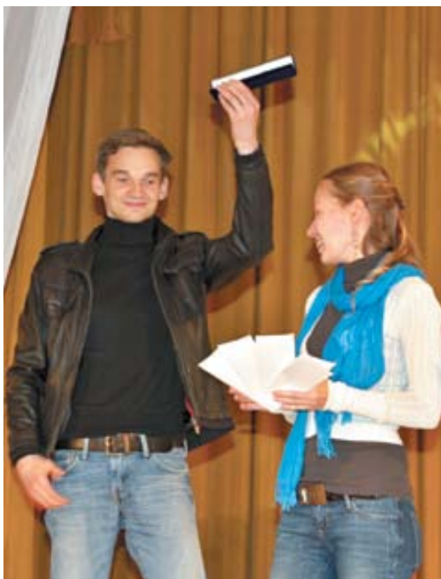
Все замерли в ожидании, чью квитанцию вытащит из коробки детская рука... Вот он — счастливый обладатель главного приза. После розыгрыша подарки получают победители конкурса «Поделки из газет»