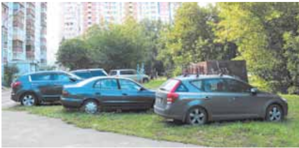
Автовладельцы паркуются во дворе рядом с детской площадкой

По настоятельной просьбе Главы города отделом полиции проведён рейд по выявлению нарушителей правил парковки. В воскресный день, 25 августа, у дома № 17 по ул. Лесной были составлены 10 административных протоколов на владельцев автомашин, припарковавшихся во дворе, на зелёном газоне рядом с детской площадкой. Помимо жильцов дома, среди нарушителей оказался шестидесятилетний пенсионер из Москвы и сорокалетний гость из г. Пушкино. Один из наказанных автовладельцев проживает на ул. Пушкинской, но в доме № 3. Все нарушители оштрафованы на сумму в тысячу рублей.