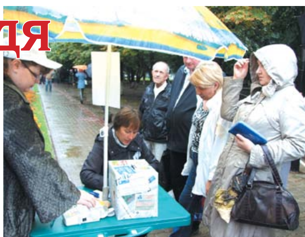
Несмотря на дождь, подписка идёт активно!

год от года хорошеет, о красоте нашей природы.