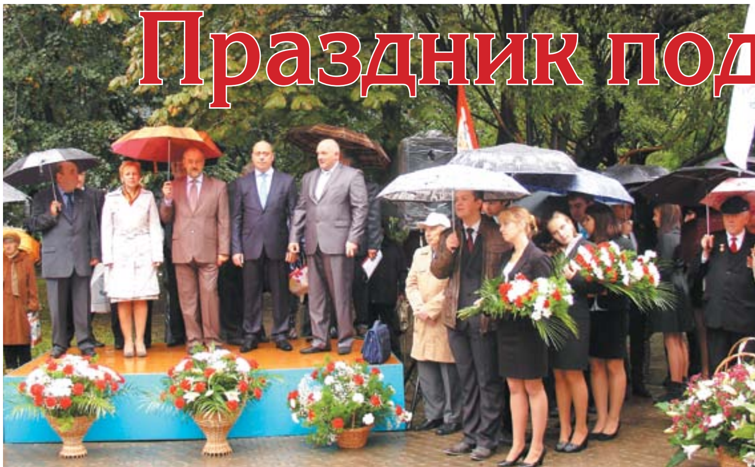
Праздник начался с митинга

ных учреждений, городской больницы и ЖКО; лидеры местных отделений партий «Единая Россия», КПРФ, «Справедливая Россия», ЛДПР и «Родина»