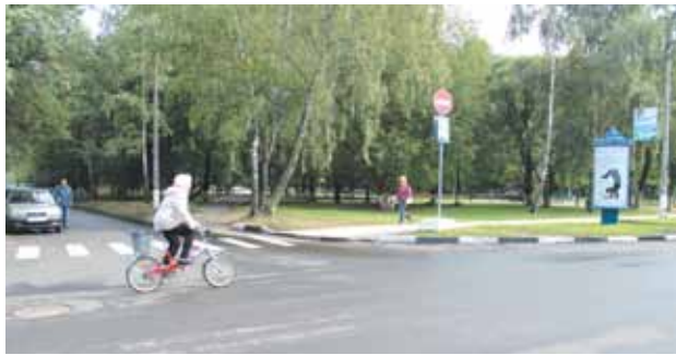
Улица Пионерская заасфальтирована. Долго мы этого ждали