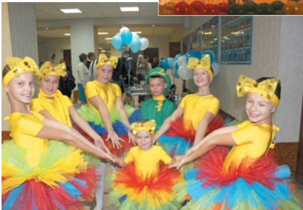
Дети радовали зрителей праздника и на сцене, и в фойе после выступления

Хоть климат у нас и не бразильский, но День города не обошёлся без карнавала. Правда, прошёл он не на улице, а под крышей — на сцене Дома культуры