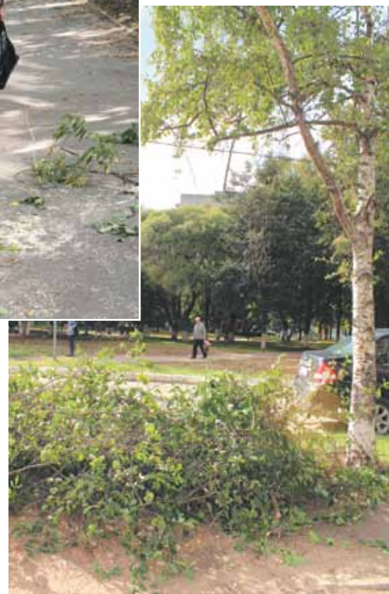
У опасной берёзы

Мы постараемся вернуться к этому вопросу, тем более