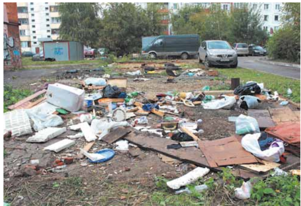
Мусор, оставшийся после ликвидации гаражей «ракушек»