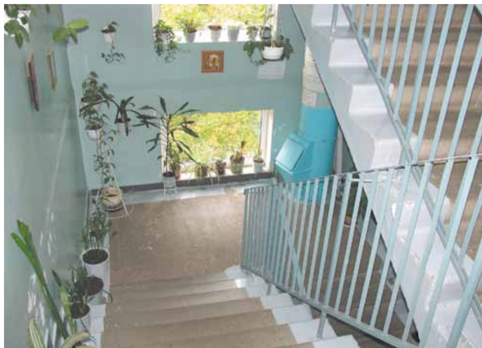
В подъезде уютно, как дома