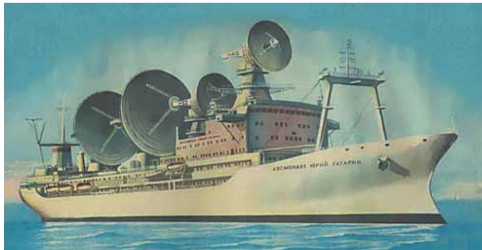
Научно-исследовательское судно «Космонавт Юрий Гагарин»