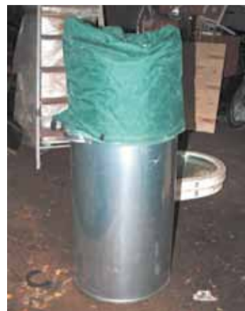
Так выглядит специальный контейнер для ртутных ламп

Ртуть — самый важный компонент энергосберегающих компактных люминесцентных ламп, который позволяет им быть эффективными источниками света. По гигиенической классификации ртуть относится к первому классу опасности (чрезвычайно опасное химическое вещество). Разрушенная или повреждённая колба лампы высвобождает пары ртути, которые могут вызвать тяжёлое отравление. Недопустимо выбрасывать отработанные энергосберегающие лампы вместе с обычным мусором, превращая его в ртутьсодержащие отходы, которые загрязняют ртутными парами подъезды жилых домов.