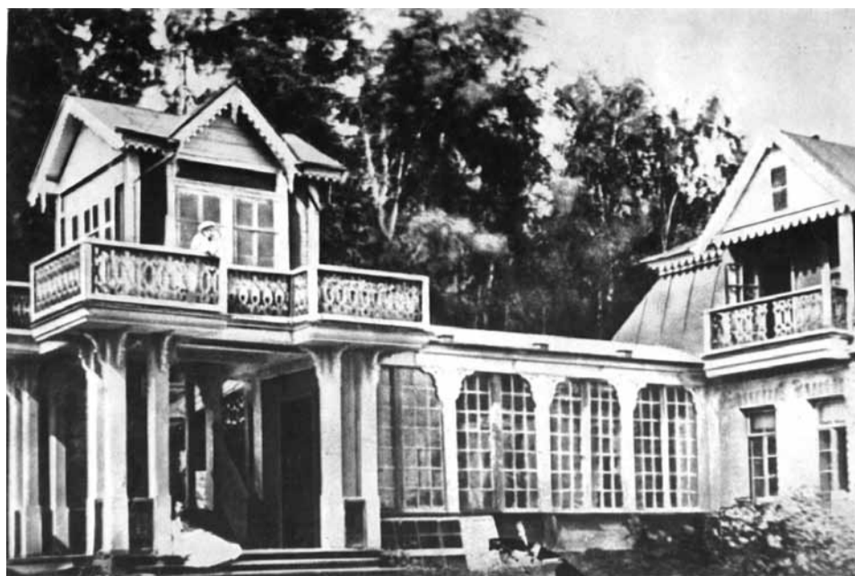
Дом в имении Боблово