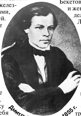
Дмитрий Менделеев, 1855 г.

В Боблове Менделеев создал опытное агрономическое поле и на протяжении нескольких лет изучал эффективность различных видов удобрений, применял новаторские приёмы в земледелии, разрабатывал методику полевых работ, ввёл у себя многопольные севообороты, получая высокие урожаи с полей. В имении появились конная молотилка и другие сельхозмашины, разводился племенной скот. О результатах Менделеев докладывал на учёных заседаниях, а затем публиковал сведения в трудах Вольного экономического общества. Он передавал свой опыт и крестьянам соседних деревень, у которых урожаи тогда были очень низкими. Великий химик всего за 6 лет добился удвоения урожая с опытных полей. В Боблове проходили практику студенты Тимирязевской сельскохозяйственной академии. Но, к сожалению, весь накопленный опыт не удалось донести до наших дней, архив учёного полностью не сохранился.