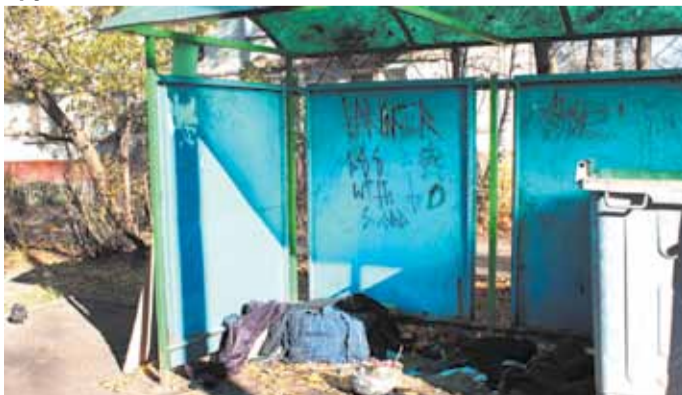
Бомжи облюбовали это место