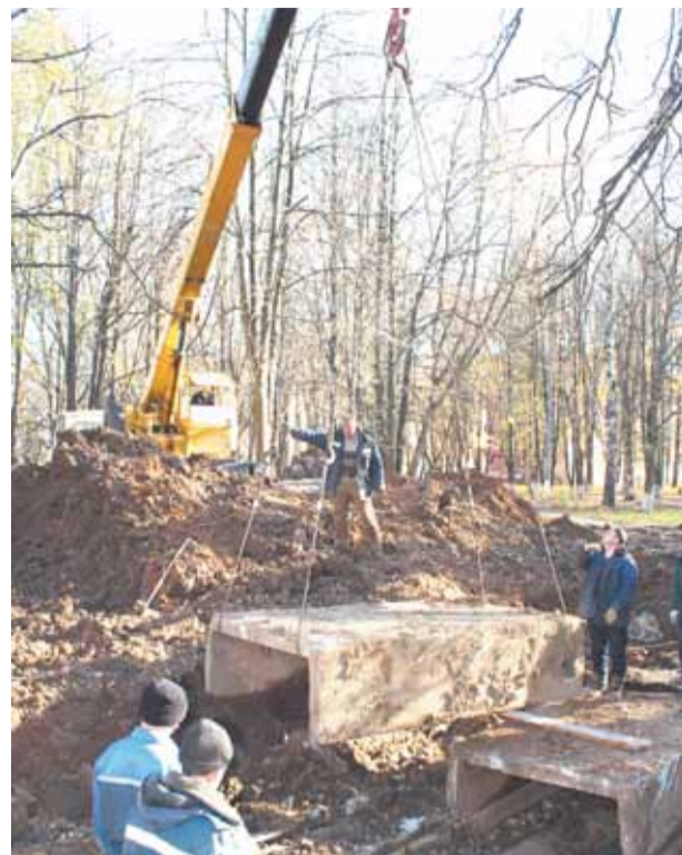
Завершение работ на теплотрассе в сквере второго микрорайона