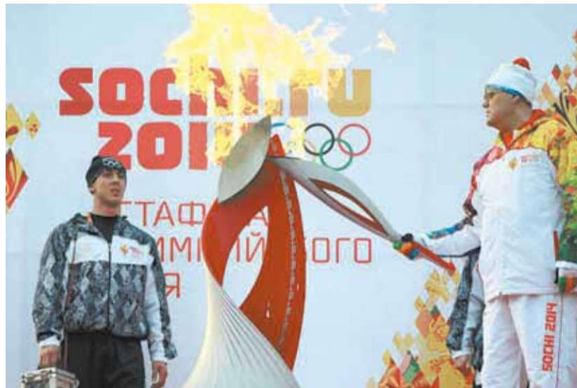
Чемпион мира и Европы, заслуженный мастер спорта СССР по хоккею Владимир Петров зажигает Олимпийскую чашу на стадионе «Зоркий» в Красногорске

Отличительной особенностью областного этапа стало движение олимпийского факела по спортивным трассам.