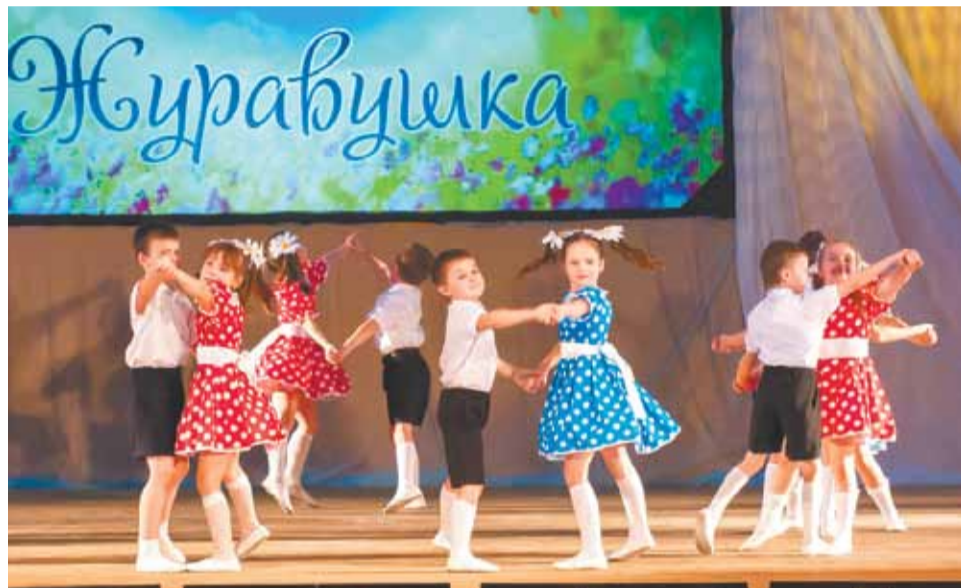
На сцене — воспитанники «Журавушки»

Состоявшийся в канун Дня матери городской танцевальный фестиваль стал ярким и незабываемым подарком