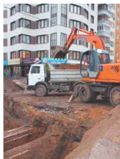
Ремонт теплотрассы на ул. Пушкинской в ноябре 2013 года

Не обошлось без проблем и на участке работ, проводимых в четвёртом микрорайоне. Лет 16 назад, при строительстве ГСК «Рябина», вопреки возражениям коммунальщиков, возле котельной поставили временное сооружение – мойку. Она была установлена над водоводом холодной воды и частично над теплотрассой. Тогда была достигнута устная договорённость о том, что, при необходимости, постройку снесут. За прошедшие годы мойка была оформлена в собственность и переоборудована под склад. В настоящее время ведутся переговоры о возможности её демонтажа.