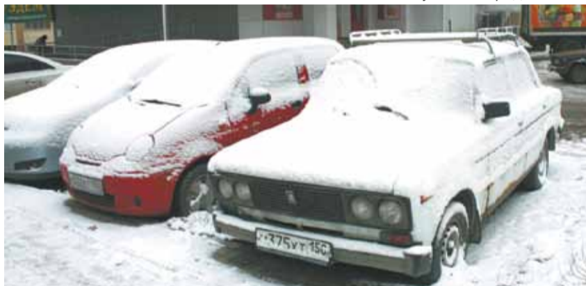
Скоро этот автомобиль (справа) превратится в сугроб, который будет мешать другим машинам и снегоуборочной технике

Только если мы будем неравнодушны к тому, что происходит на наших улицах и во дворах, мы будем жить в чистом и уютном городе.