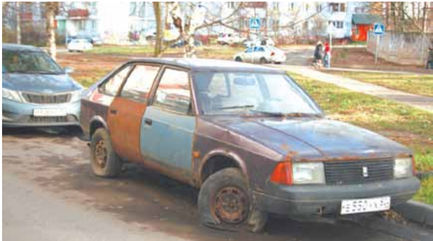
Много автохлама в центре города, на ул. Пушкинской

ного средства» установлен, то Администрация или уполномоченная организация «обязаны в течение 3 дней направить извещение владельцу о необходимости вывоза транспортного средства или приведения его в порядок, а в случае его отказа обеспечить вывоз транспорта на охраняемую стоянку». Непонятно только, какой транспорт в таком случае считать «разукомплектованным»... По закону «брошенным» считается автомобиль, собственник которого в установленном порядке отказался от него, не имеющий собственника, собственник которого неизвестен. Есть ли хозяева