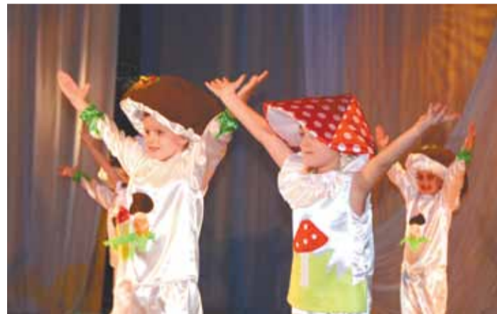
Ожившие «грибочки» из детского сада «Рябинка»