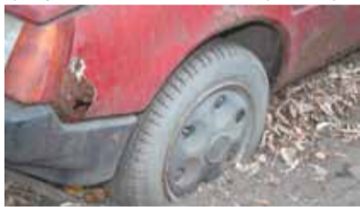
Сколько лет ржавела и вросла в землю эта машина?

Наше простое человеческое желание видеть город чистым часто упирается в бюрократические законы. Пока на ржавой развалюхе есть номер – это чья-то собственность, которая остаётся неприкосновенной, даже если хозяину до неё нет дела. Но это не значит, что ситуация безнадежна. Есть законы, которые должны помочь в борьбе за порядок. Совсем недавно Совет депутатов утвердил «Положение о нормах и правилах благоустройства в городском округе Юбилейный Московской области» (Решение Совета депутатов города от 29.10.2013 г. № 174), где целая глава посвящена брошенному автотранспорту. Если у машины нет владельца, что подтверждено заключением ГИБДД, то Администрация города (или уполномоченная ею организация) обязана в 10-дневный срок вывезти автомобиль на место хранения. Если владелец «разукомплектованного транспорт-