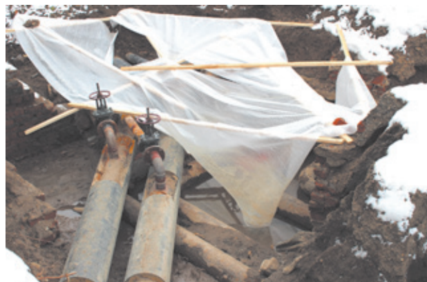
Восстановительные работы до сих пор продолжаются

За истекший месяц на территории двух городов возросло количество пожаров, которые привели к гибели двух человек. В связи с этим сотрудники Госпожарнадзора совместно с участковыми уполномоченными полиции осуществляют рейды по квартирам и проводят профилактические беседы с вручением памяток о мерах пожарной безопасности.