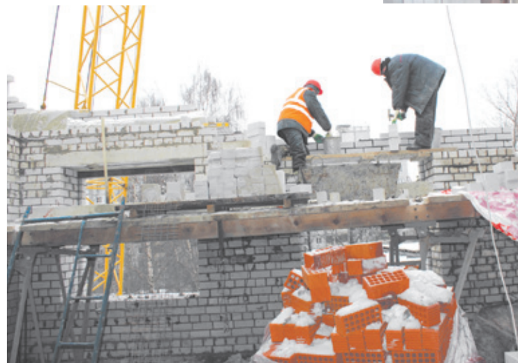
Кирпичная кладка завершается

На первом этаже ведётся монтаж тёплых полов в детских группах, начаты работы