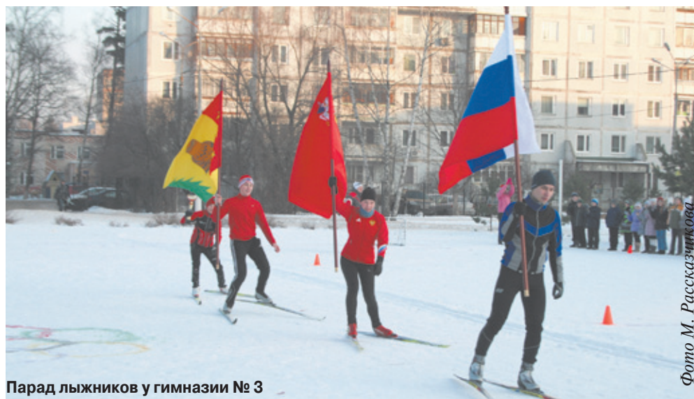
Парад лыжников у гимназии № 3

У же рано утром во дворе гимназии № 3 состоялся парад лыжников, открывший череду мероприятий, продолжавшихся до самого вечера. Вслед за лыжными соревнованиями и играми в хоккей стартовала программа мероприятий в спортивном зале гимназии. Совместно с ДЮСШ г. Юбилейного по волейболу и Школой искусств, при поддержке Администрации здесь был проведён турнир по волейболу среди девушек. Соревновались две команды из Юбилейного и гости из г. Фрязино, победили юбилейчанки!