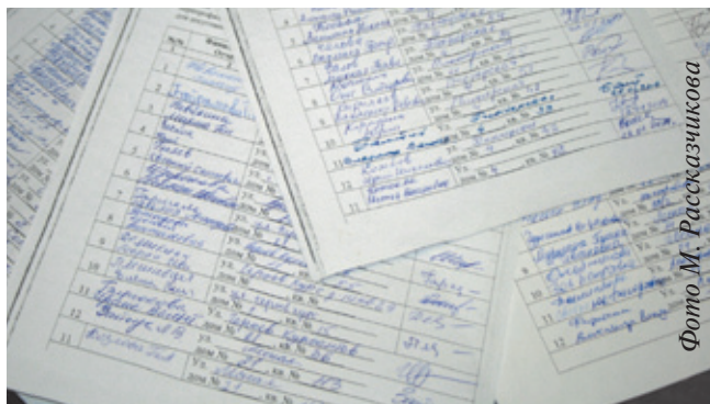
211 подписей собрано в поддержку создания пешеходной зоны вдоль ул. Тихонравова

На сегодняшний день предлагается два варианта создания таких зон в Юбилейном: на участке по улице Пушкинской и вдоль части улицы Тихонравова. В поддержку последнего предложения было собрано 211 подписей горожан, направленное ходатайство в Совет депутатов и Главе города.