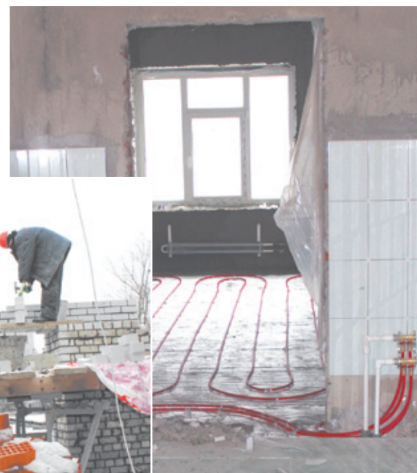
Начаты внутренние отделочные работы

По сегодняшним оценкам, строители подготовят объект