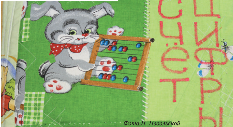
Обложки книжек, созданных в детском саду № 5 «Теремок» в рамках конкурса «Читающий Юбилейный»