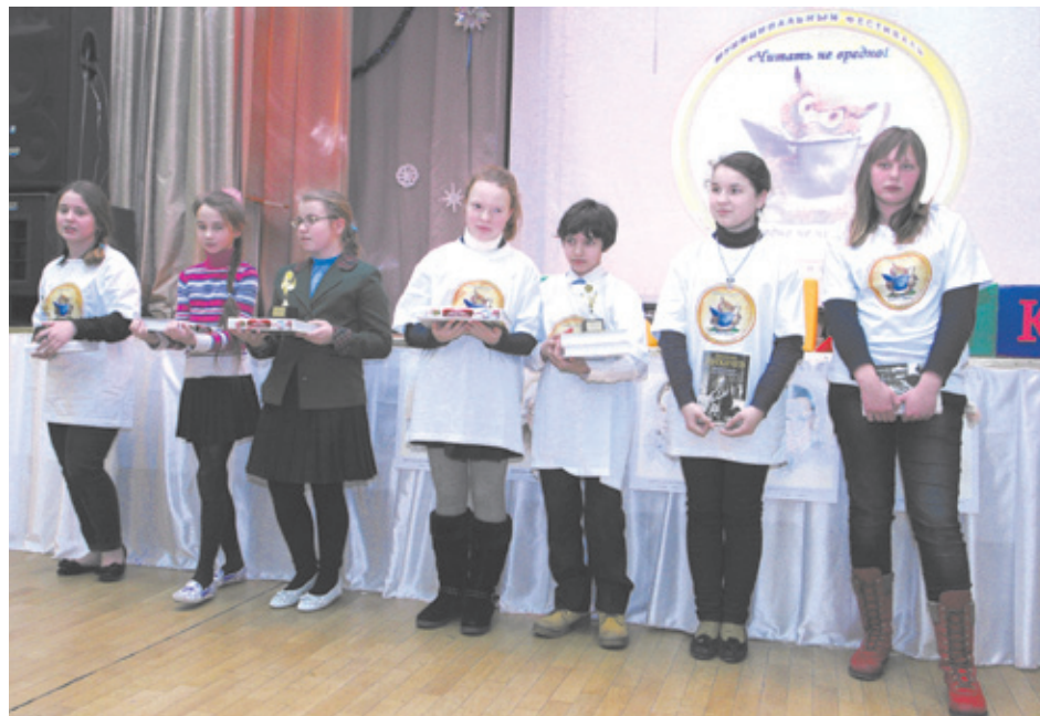
Призёры и победители литературного конкурса

Насыщенными были школьные мероприятия фестиваля. Школа искусств провела интереснейшие мастер-классы по темам: «Объём. Особенности языка скульптуры», «Образ матери и младенца в мировом искусстве», «Дизайн. Бумажная пластика», круглый стол «Книга в искусстве», интеллектуальный марафон музыкально-теоретических дисциплин. Детская музыкальная школа — литературно-музыкальный концерт «Звени, гитара», музыкальную гостиную «Поэзия и музыка — союз двух искусств», конкурс юных музыкантов «Любимая Музыка», а в гостях у детского сада № 41 — лекцию-концерт «Поэтический мир музыки».