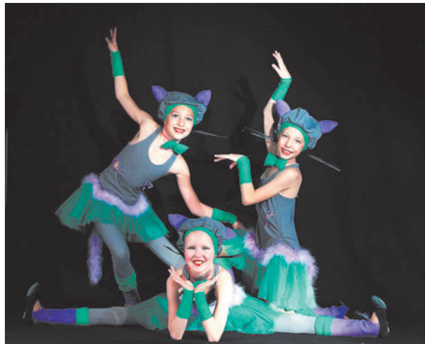
Солистки ансамбля «Контраст»

Поездка в Суздаль запомнится не только победами на конкурсе, но и интересными экскурсиями по старому городу, яркими мероприятиями и весёлыми гуляниями. «Контраст» привёз в город три кубка, дипломы и сертификат на поездку в Севастополь на конкурс летом.