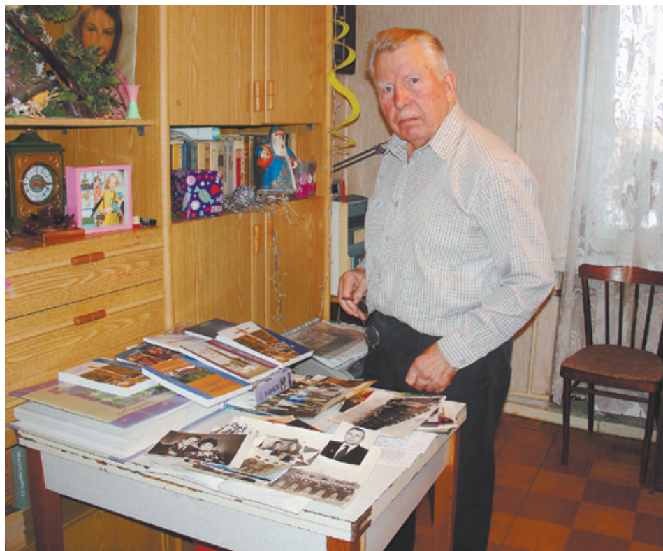
Лирик. Четыре книги, три стихотворных сборника и 717 стихов, пока не опубликованных

Оксана ПРУДКОВСКАЯ, фото автора и из архива Терновых