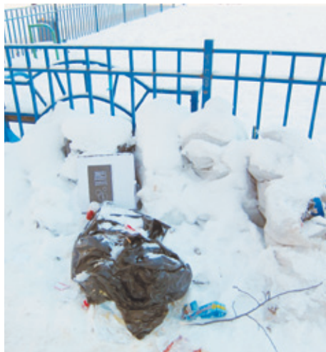
Мешки под снегом

Тему можно продолжать и продолжать, тем более, что растаявший снег обострил проблему донельзя, но так не хочется повторяться! Впрочем, есть и чем удивить, скорее, о чём предупредить! Обратите внимание, на фонаре,