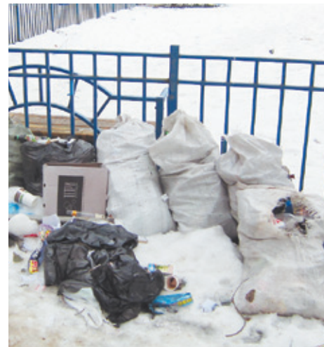
...и уже без него