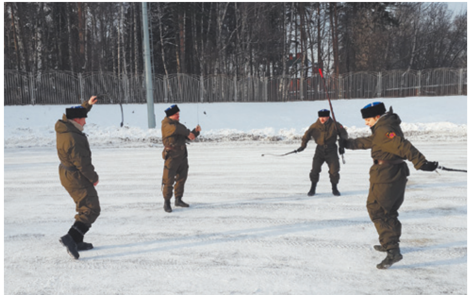
Казаки на тренировке

А.Б.: Цель у нас одна — это духовно-нравственное и физическое воспитание молодого поколения в лучших традициях и обычаях казаков. Если коротко сформулировать, это воспитание уважительного отношения к старшим, к женщине, к родителям, семейным ценностям и родовым традициям. Мы много внимания уделяем духовно-патриотическому воспитанию молодёжи, пытаемся сформировать взгляды на основные общественные ценности, которыми должна