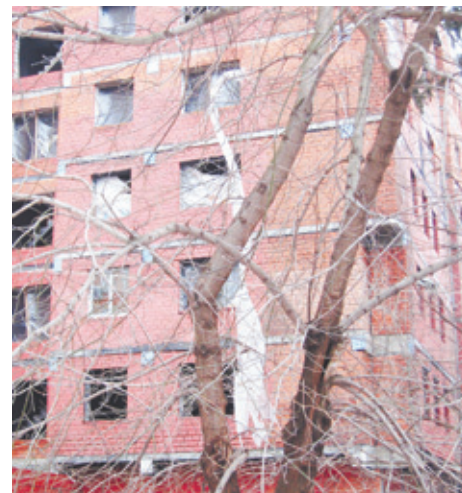
...а это осталось...