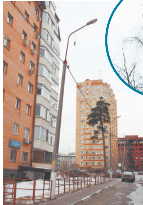
Фонарь и бутылка, которая на нём висит

Мы писали о том, как праздновали Татьянин день на тротуаре у ТЦ на ул. Лесной, 14. Буквально через несколько дней там снова появились пищевые остатки, упаковки из-под закусок, и опять же – под ногами у пешеходов. Да и над головами тех, кто здесь проходит, тоже не всё благополучно. Судите сами. Если на ветках высоких деревьев висят мешки из-под строительных материалов, то от приземления таких упаковок на голову, увы, не застрахован никто из проходящих мимо.