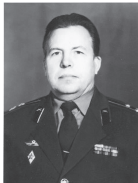
Космодром Плесецк. 1979 год

И над всей планетой кружит В небе полная луна. Сказка ночью с нею дружит, Волшебством отражена, — скороговоркой, будто стесняясь, продолжал