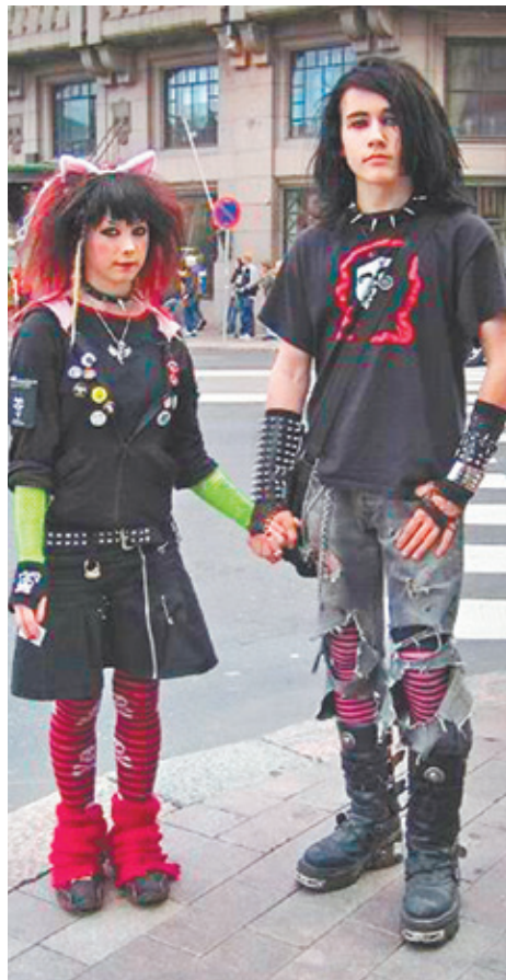
Внешний эпатаж мешает быть собой

Никогда не поздно быть собой. Отбросьте сомнения, перестаньте волноваться о том, что подумают другие, не бойтесь показаться глупым или смешным. Так зачем же записываться в собственных комплексах? У вас «море» возможностей, целая «гора» времени. И вы не можете потратить их впустую. Живите, а не существойте, не запирайте себя настоящего, делайте то, что вам приятно, то, что у вас получается. Будьте собой, будьте особенными, помните о том, что никого похожего на вас нет, и