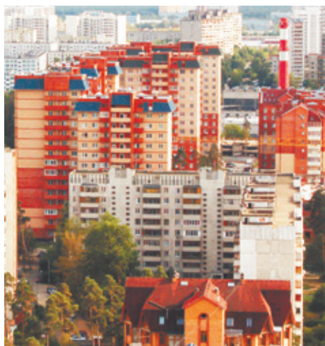
Начало XXI века

Здесь есть следы и дворянских усадеб, и стародачной застройки, и зданий советского конструктивизма, и сталинского ампира, и советской функциональной архитектуры.