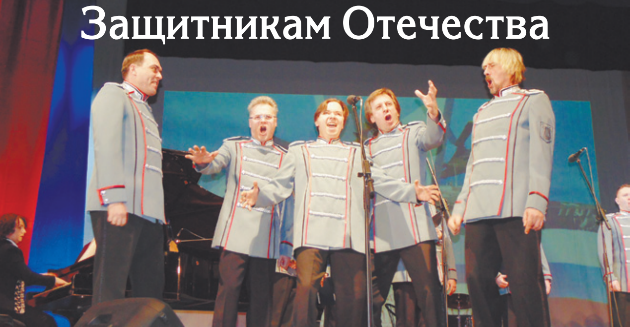
Выступает мужской камерный хор

21 февраля в городском Доме культуры прошёл торжественный вечер, посвящённый Дню защитника Отечества.