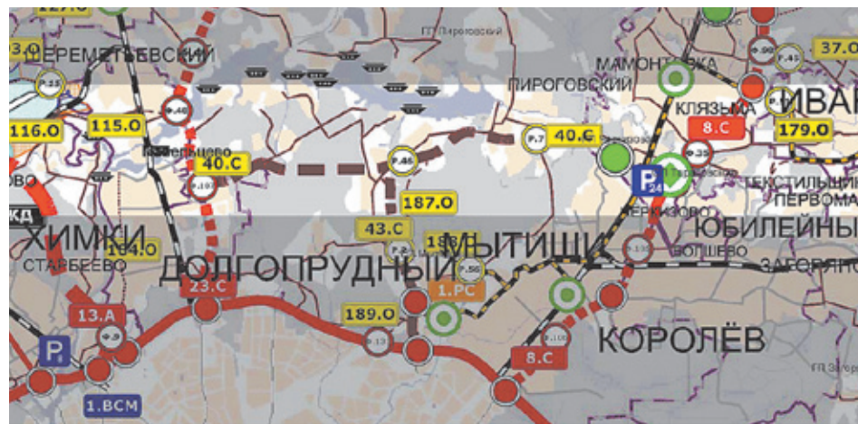
Подготовлен проект региональной автомобильной дороги «Виноградово — Болтино — Тарасовка (Осташковское шоссе)», которая соединит Дмитровское шоссе с Ярославским, аэропорт Шереметьево с Королёвыми по городской уличной сети с Юбилейным, Загорянским, Щёлково и Щёлковским шоссе

В едётся реконструкция федеральной автомобильной дороги «М-8 Холмогоры» (Ярославское шоссе). Организовано скоростное железнодорожное со-