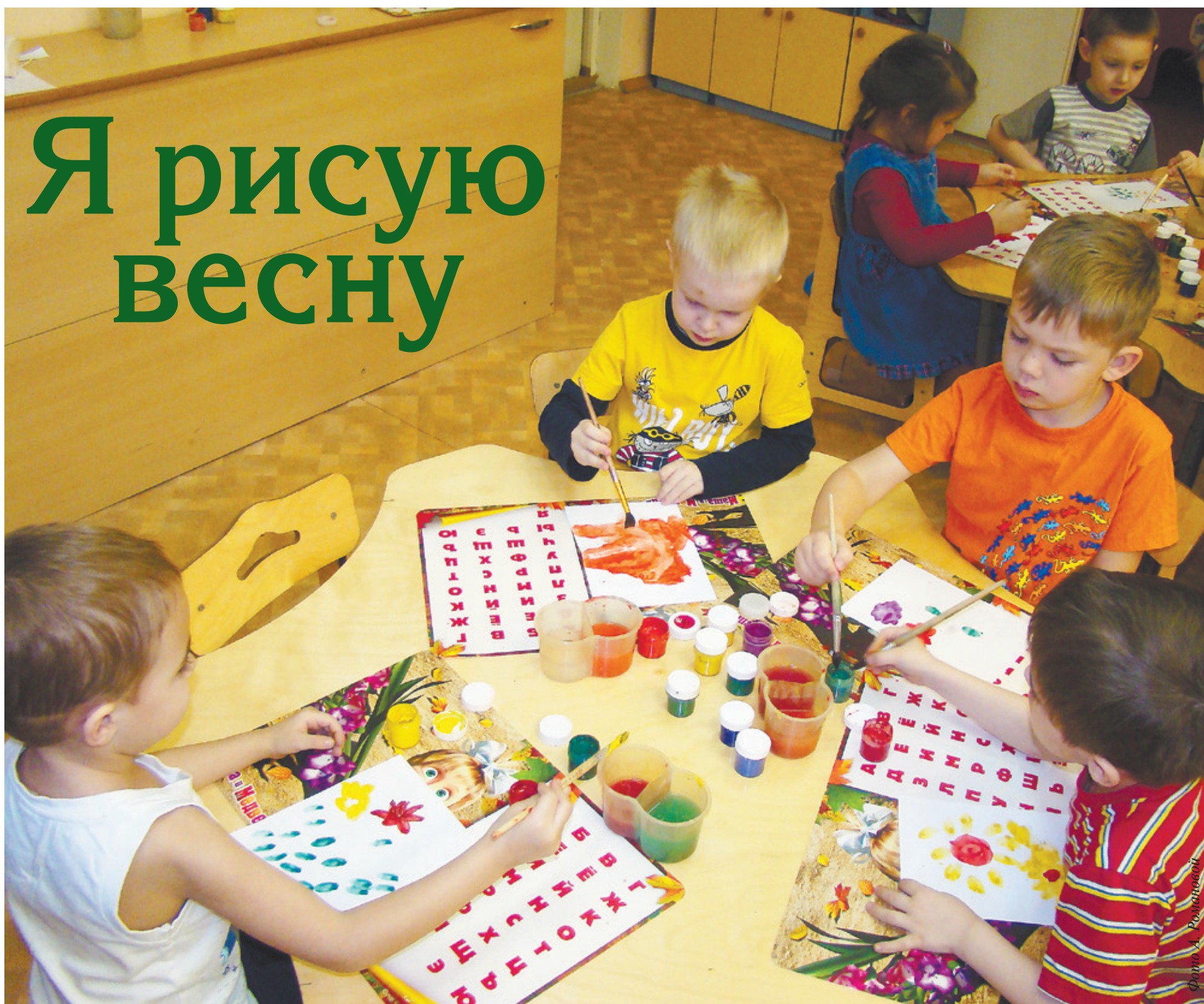
Воспитанники детского сада № 1 «Журавушка» готовят подарки для своих мам на 8 Марта