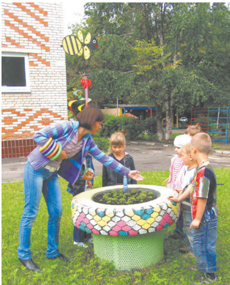
На увлекательных прогулках ребята получают экологические знания

Проект высоко оценён, но не закончен, как не может за-