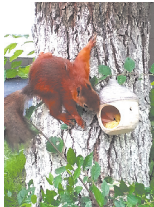
Белка — любимица детей — живёт на территории сада

«Через проект» прошли все малыши «Журавушки». Для каждой группы своя программа, своя «тропинка в удивительный мир природы». Всех встречает на ней мудрый Лесо-