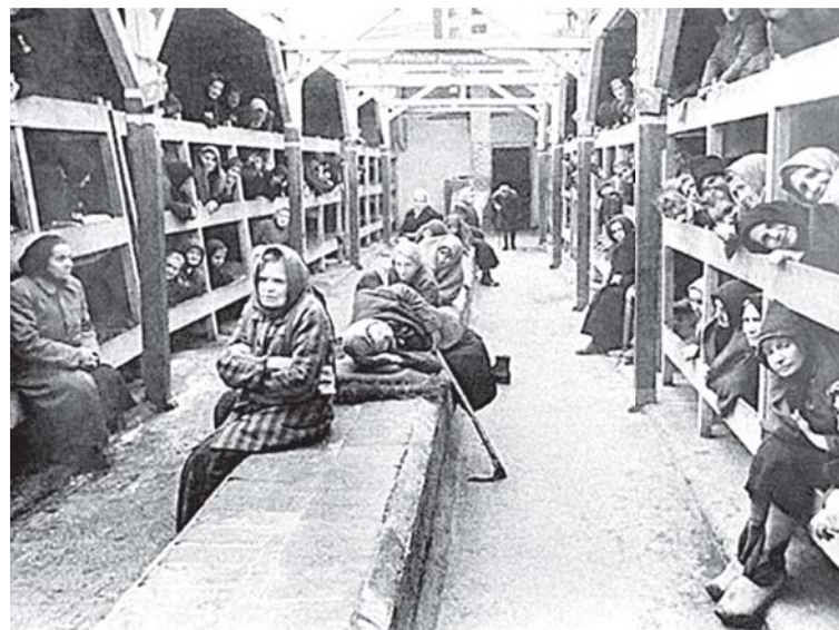
В концлагере Равенсбрюк

После паузы затишья она рассказала подробно о своём побеге.