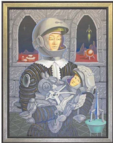
Мадонна в скафандре с младенцем