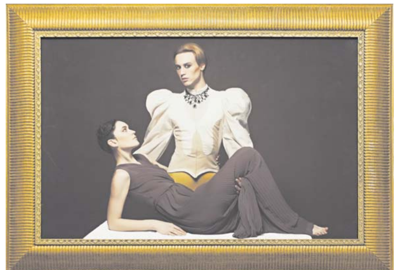
Сказка о спящей красавице