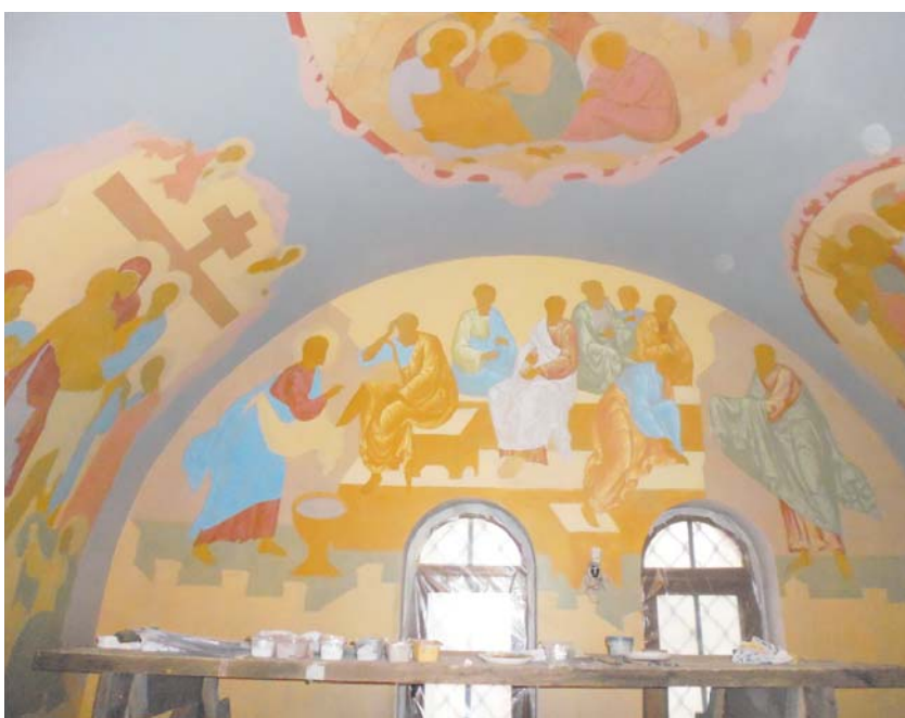
Храм украсят образы, изображающие последние дни земной жизни Христа

Стены храма Новомучеников состоят из кирпичной кладки, которая оштукатурена и загрунтована. Поэтому в качестве материала для живописи была выбрана акриловая краска: она наносится на подготовленную штукатурку. Первоначально художниками были созданы эскизы всех 13 сюжетов, затем в мастерской каждый рисунок был проработан на кальке и