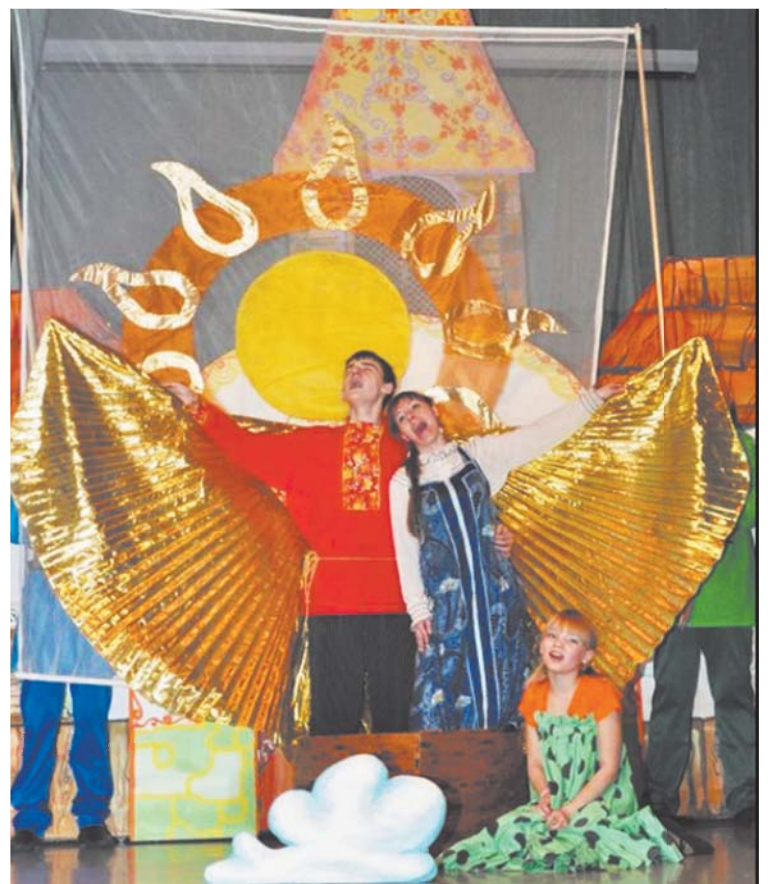
Фрагмент спектакля «Летучий корабль»