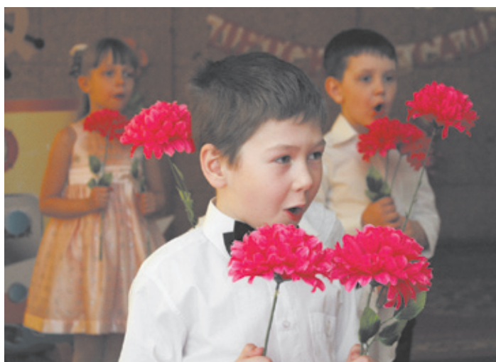
Юные артисты поздравляют любимый детский сад

В апрельский солнечный день 2014 года «Центр развития ребёнка — детский сад № 37 «Рябинка» отметил свой юбилей. И в честь этого события прошла историческая «киносъёмка», участниками которой стали ветераны дошкольного учреждения, гости, родители, дети и весь коллектив.