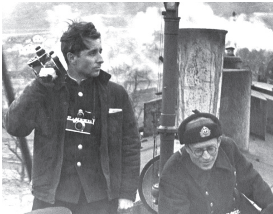
Они были на передовой, за кадром

Война изменила облик советской печати. Уже на второй и третий день после объявления войны корреспонденты были на фронте. Чтобы улучшить качество публикаций, в редакции газет были направлены сотни советских писателей, в их числе Александр Твардовский и Константин Симонов.