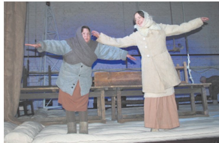
Сцена из спектакля «Прекрасное далёко»

Их всего пятеро. Сан Саныч, старожил, который уж и не помнит, как сюда попал. Тётя Таня погибла в блокаду от голода. Серёгу придавило плитой «коммунистической» стройки. Тоха погиб от пули снайпера на войне, на которую им так и не сказали, зачем их послали. Маруся погибла от руки убийцы. Они все разны и попали сюда в разное время, но все так и не успели понять, что такое любовь. И все с тоской вспоминают Свободу, ту жизнь, которая была до смерти. Герои спектакля проходят долгий путь прежде, чем понять, что самое ценное — это жизнь. И пока человек жив — он свободен, а значит счастлив.