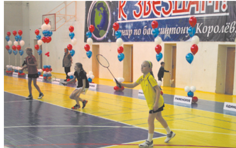
У каждого была возможность проявить себя на турнире

Соревнования проходили в различных категориях: в смешанной парной категории, в мужской и в женской. Разыгрывалось 96 медалей. Турнир длился почти весь день, и удивительно, что участники продолжали бороться до конца, словно не чувствуя усталости. «Наш турнир организован так, что в процессе соревнований ребята распределяются по группам в зависимости от уровня их подготовки, — рассказал Валерий Васильевич. — Дальше сильные играют с сильными, а слабые — со слабыми. В каждой группе свои медали. Таким образом, у каждого есть возможность проявить себя, играя со