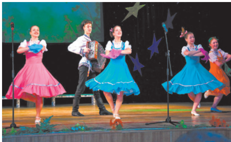
Наша «Звёздочка» осветила весь мир!