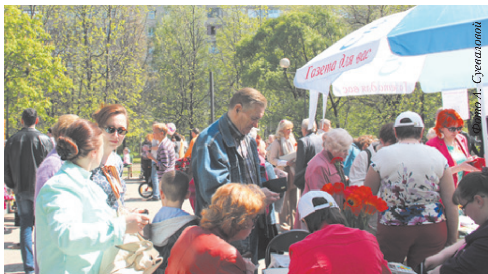
Подписка идёт активно