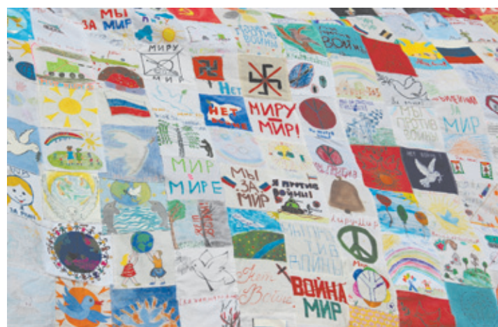
Фрагмент полотна «Дети Юбилейного против войны», сотканного из 700 кусочков. В акции, инициатором которой стал лицей № 4, приняли участие все сады и школы города. Длина полотна — 13,5 метров!

750 тысяч рублей было потрачено из городского бюджета Юбилейного на проведение празднования 69-й годовщины Великой Победы.