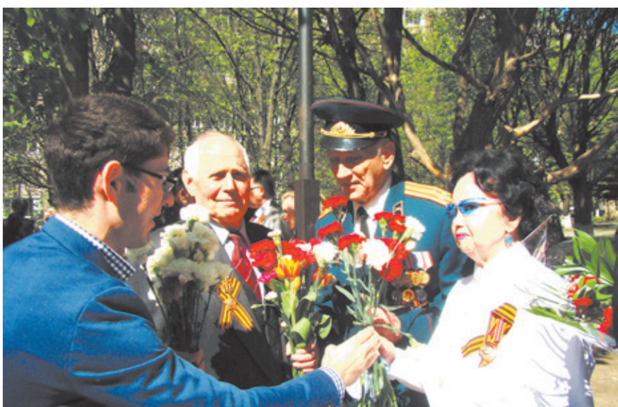
Молодёжь Юбилейного поздравляет ветеранов и благодарит за мирное небо над головой