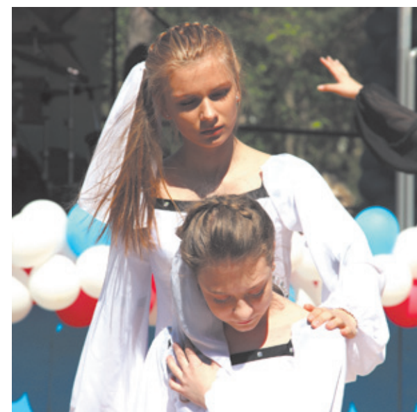
Ансамбль «Контраст» исполняет композицию «Журавли»

750 тысяч рублей было потрачено из городского бюджета Юбилейного на проведение празднования 69-й годовщины Великой Победы.