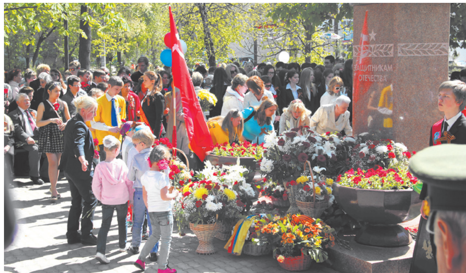
Благодарные потомки возлагают цветы к памятнику Защитникам Отечества

112 ветеранов Великой Отечественной войны проживают в Юбилейном, из них самому младшему сейчас 87 лет.