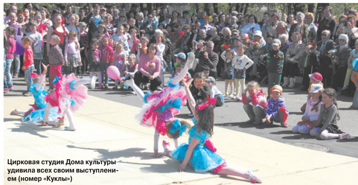
Цирковая студия Дома культуры удивила всех своим выступлением (номер «Куклы»)