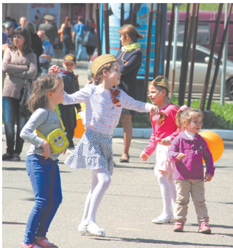
Весь концерт юные зрители зажигательно танцевали

Материалы подготовили: Елена ФИЛИПОВА, Оксана ПРУДКОВСКАЯ, Анастасия РОМАНОВА, Анна СУЕВАЛОВА