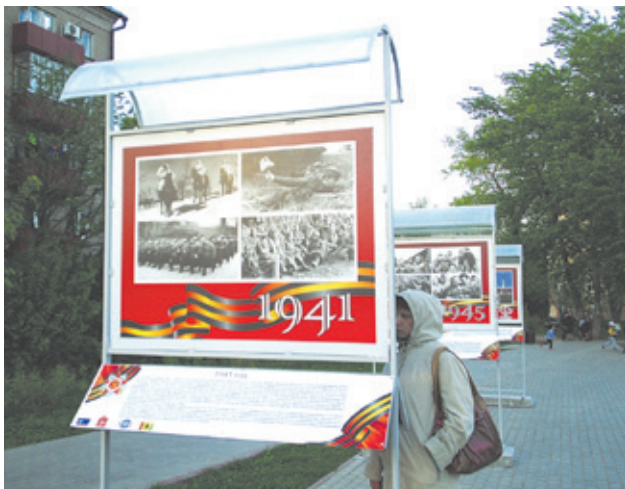
Стенды с фотографиями военных лет