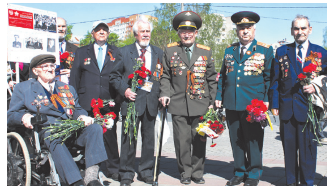
Спасибо вам, ветераны!

Главным государственным праздником нашей страны всегда был и остаётся День Победы