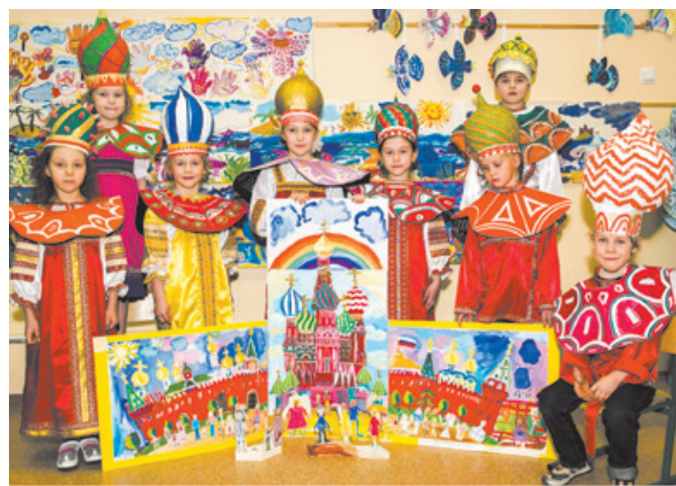
Воспитанники «Покрова» удивили всех своими костюмами