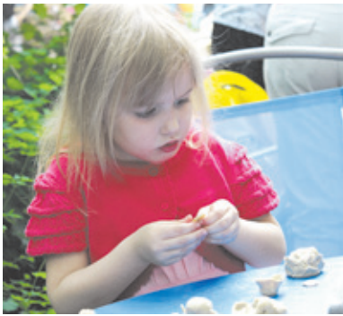
Мастер-класс по лепке. Это очень увлекательно!

Начало каникул, отличная погода, вкусное мороженое, сюрпризы и шутки ведущих – что ещё нужно, чтобы хорошее настроение выплёрскивалось за пределы площади? Маленьких зрителей праздничного концерта на площади Дома культуры не нужно было упрямивать: они охотно приписывали под задорные ритмы, составляя конкуренцию почти профессиональным