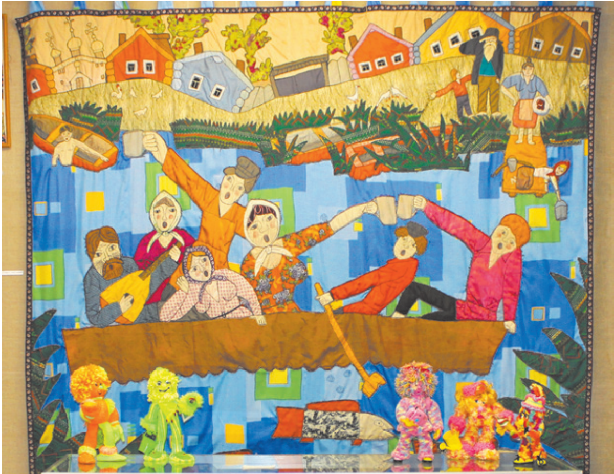
Лоскутное панно «Наши гуляют»

она именует «наивным реализмом», который оказался близок не только соотечественникам, посещающим вернисажи ЦДХ, но и зрителям Испании, Германии, где проводились международные выставки, участником которых была