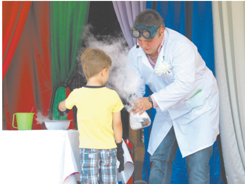
Все дети заворожённо смотрели на волшебные химические опыты. А некоторым счастливым удалось даже поучаствовать.