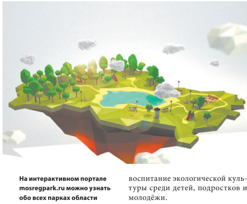
На интерактивном портале mosregpark.ru можно узнать обо всех парках области

Конкурс проводится по двум номинациям: «Лучшее преобразование парка» и «Лучший проект по созданию нового парка». Кроме того, учреждены специальные денежные премии: «За лучший ландшафтный дизайн парковой зоны», «За креативный подход к созданию зон отдыха населения» и «За лучшее оформление детской площадки парка». Победители получают премию в размере 15 млн рублей в номинации «Лучшее преобразование парка» и 10 млн рублей за «Лучший проект по созданию нового парка». Размер специальных денежных премий составляет 1 млн рублей в каждой номинации. Конкурс пройдёт в несколько этапов. На I этапе, который пройдёт с 1 по 25 июня, отбираются претенденты на участие на основе представленных заявок. Затем в течение 10 дней проводится предварительный осмотр парков и территорий, отведённых для создания нового парка. На III этапе, который пройдёт с 7 июля по 7 августа, будут проводиться работы по преобразованию парков и благоустройству территорий, отведённых для создания нового парка. После чего экспертная комиссия осматривает парки и территории, отведённые для создания нового парка, и подводит итоги конкурса. Заявки на участие в конкурсе