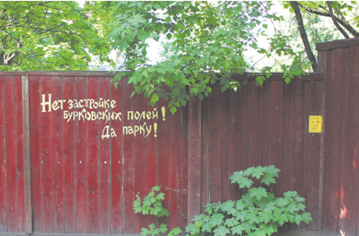
Жители Буркова протестуют, как могут...

При этом важно то, что Бурковские поля расположены чуть выше деревни. Не нужно быть ясновидящим, чтобы понять: при строительстве в питьевую воду попадут далеко не питьевые грунтовые воды, которые затем естественным