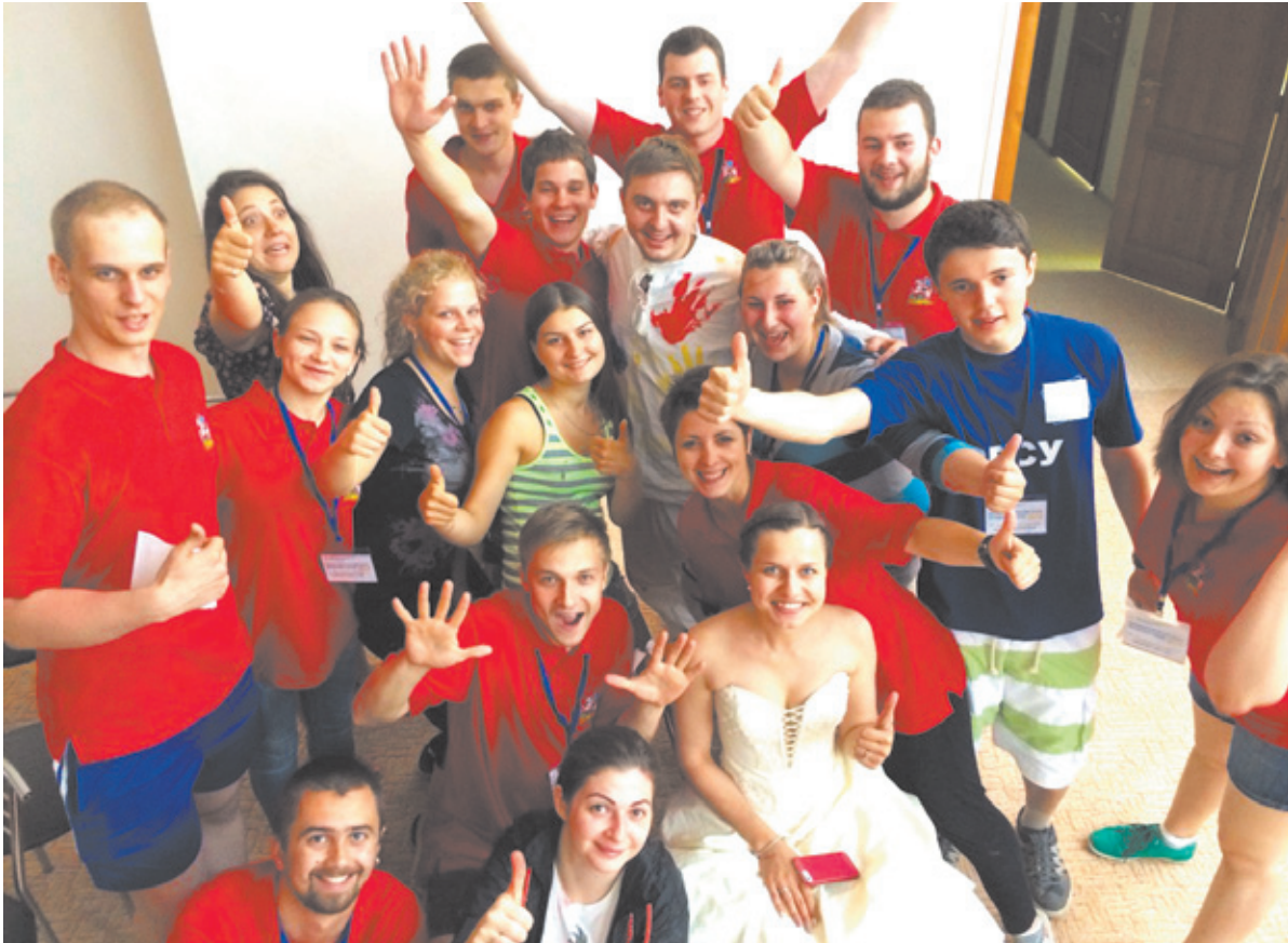
Первая смена молодёжного актива «Молодой парламентарий» была полезной и весёлой