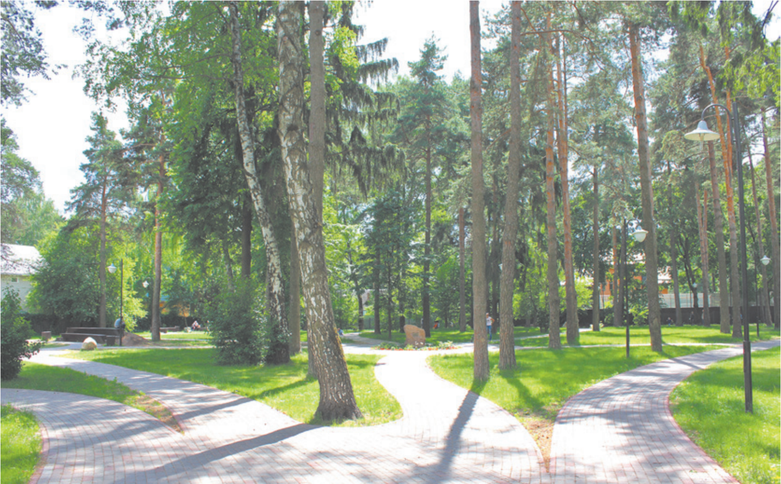
Дорожки сквера, как извилистые пути поэта...

И потому практически весь Королёв поднялся на защиту любимого сквера во времена не столь отдалённые, когда исторически значимое место легко могло погибнуть от неразумной застройки. Предприимчивые застройщи-