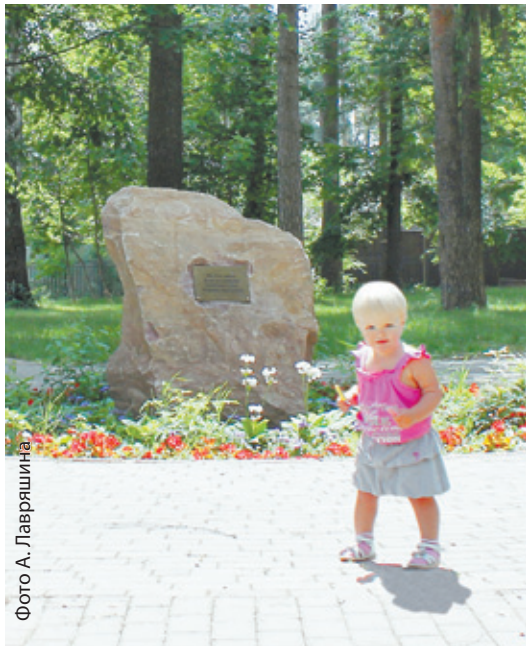
Дети любят Цветаевский сквер

РОВНО ГОД НАЗАД, 19 ИЮНЯ, ПОСЛЕ ЗАТЯНУВШЕЙСЯ РЕСТАВРАЦИИ БЫЛ ОТКРЫТ МЕМОРИАЛЬНЫЙ ДОМ-МУЗЕЙ МАРИНЫ ЦВЕТАЕВОЙ В БОЛШЕВО. ДЕСЯТЫЙ ЦВЕТАЕВСКИЙ КОСТЁР БЫЛ РАЗВЕДЁН ГУБЕРНАТОРОМ ПОДМОСКОВЬЯ В СТАРОМ СКВЕРЕ, ПРЕОБРАЗИВШЕМСЯ ДО НЕУЗНАВАЕМОСТИ.