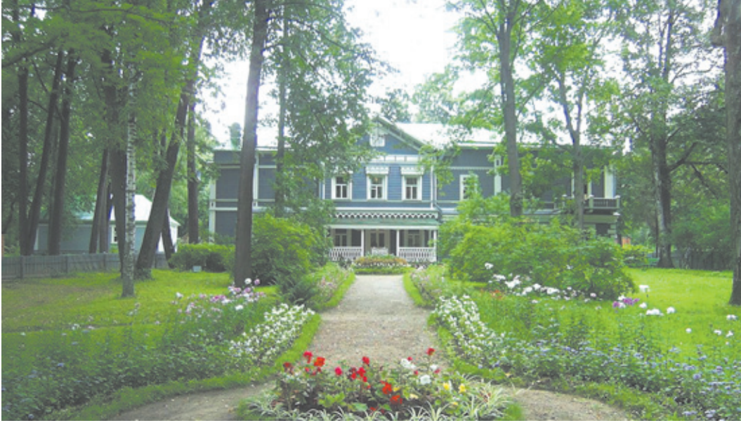
Музей-усадьба П.И. Чайковского

С 17 по 18 июня в подмосковном Клину состоялся международный фестиваль искусств «Подмосковные вечера с Чайковским». Он проходил в рамках губернаторской программы Андрея Воробьёва «Наше Подмосковье».