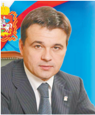
Губернатор Московской области Андрей Воробьёв