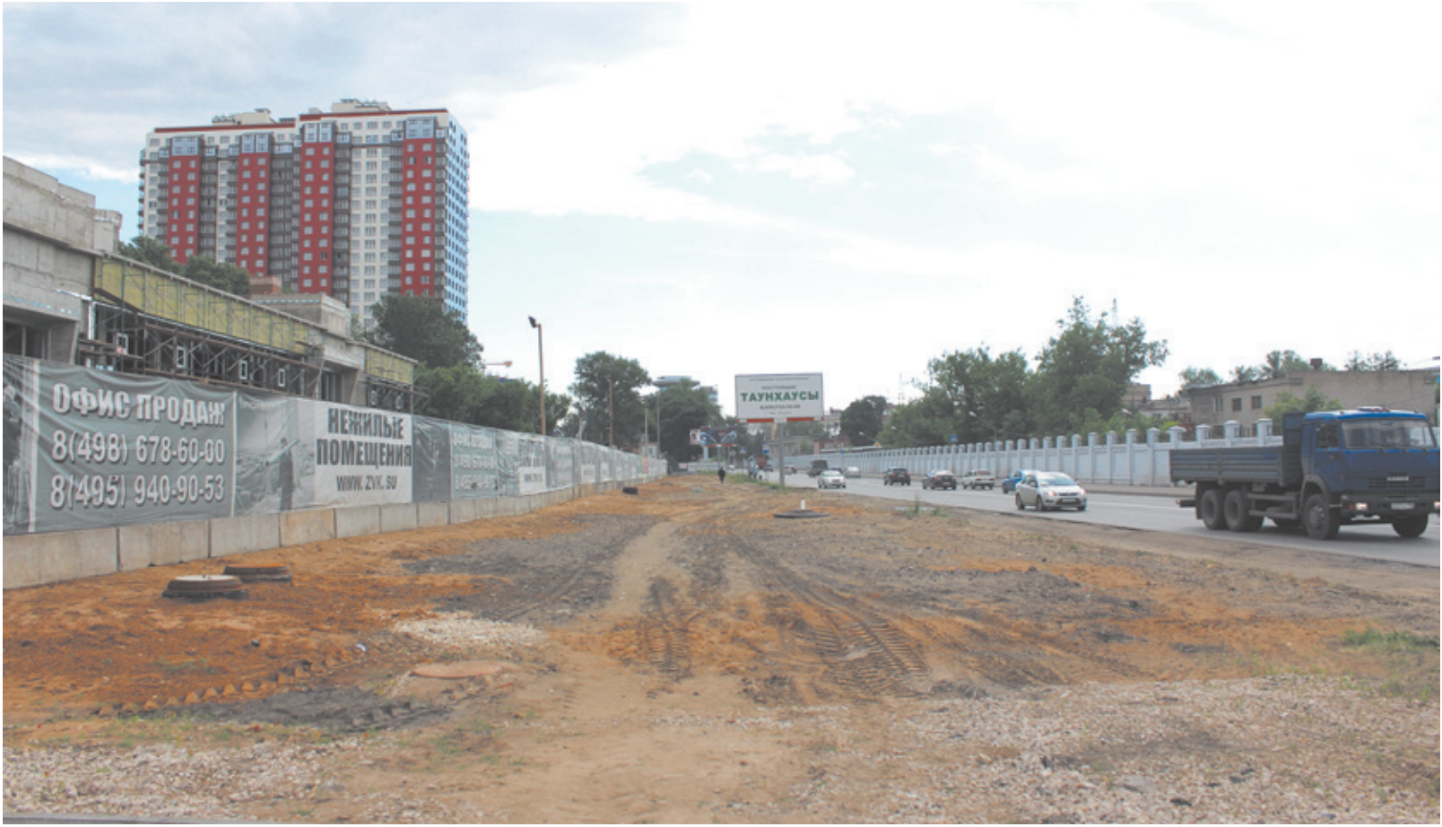
Потенциальная полоса движения

Реконструкция Пионерки планируется грандиозная и затратная. Только по предварительным подсчётам, на расширение дорожного полотна потребуются 60 млн рублей. Работы будут вестись поэтапно, ведь фронт их достаточно велик. Предстоит снос ветхого двухэтажного жилого фонда, затем перенос опор освещения и вырубка части деревьев по ул. Пионерской, чтобы подготовить полотно для расширения проезжей