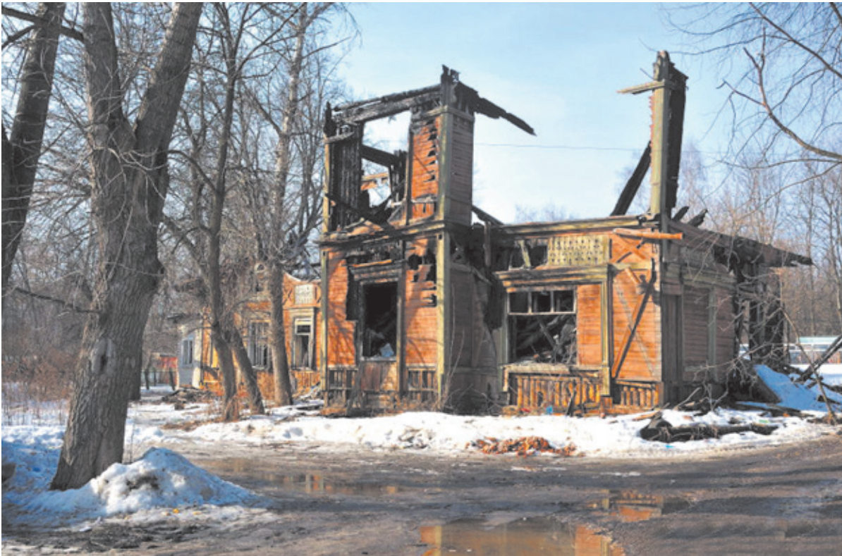
Дом Ценкера, управляющего фабрикой, сгорел по вине бомжей

Главное: не забывать, что те шестнадцать тысяч человек, что проживают в этом забытом микрорайоне города, тоже достойны улучшения условий жизни.