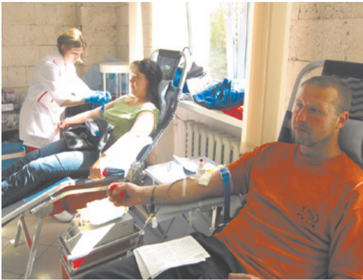
Во время забора крови