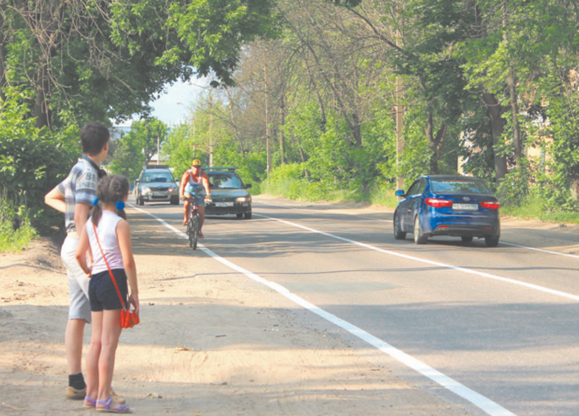
Когда же на этом месте будет «зебра» к ЦДКиД ?