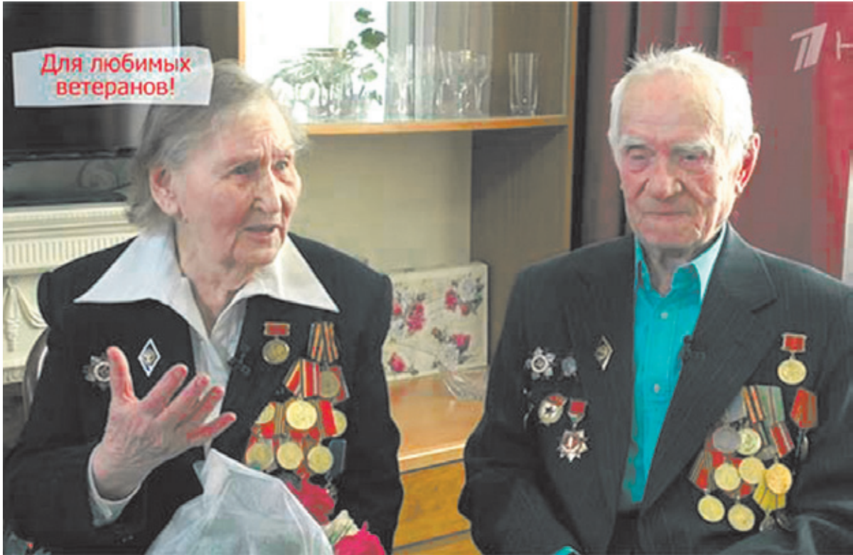
Фрагмент передачи «Идеальный ремонт»

Всё обновили: и люстры, и мебель, и телевизор, разные штюрки... А самое главное: окна поменяли! Теперь нет сквозняков. И двери новые – не скрипят и не заедают. Из нашего только часть мебели осталась – мы очень любим свою мебельную стенку, но и её отреставрировали. А сколько всего надарили! Вот этот камин подарила Лариса Рубальская. Он красивый, декоративный, но может воздух увлажнять. А стол