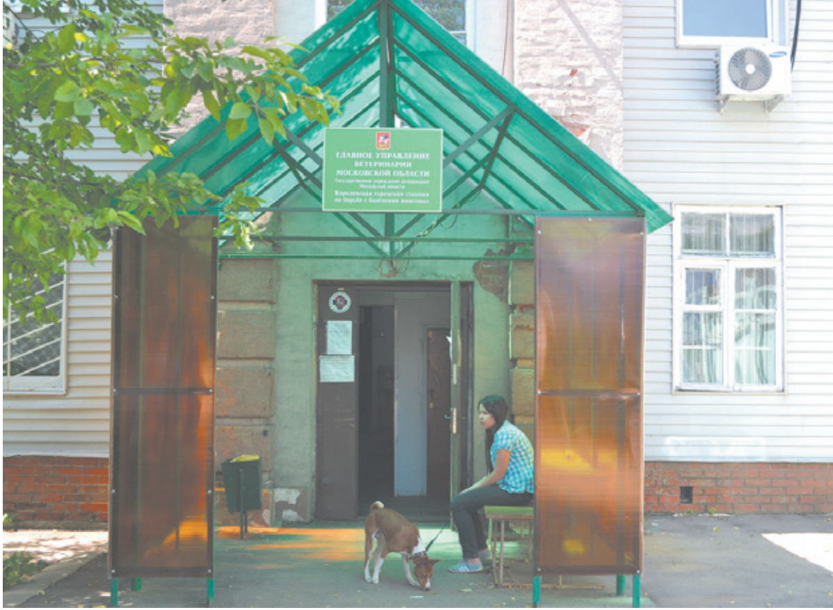
Ветсправку можно получить только в этом учреждении

По указанному адресу (ул. Гагарина, 5) нас ожидала очередь из страждущих животных и их хозяев. Ветврачи были заняты на операции, приём на это время приостановили. Мы терпеливо ждали около полутора часов. А когда подошла наша очередь, выяснилось – справки нам не выдать как своих ушей! Оказывается, со времени прививки нашего питомца от бешенства прошло более 12 месяцев.