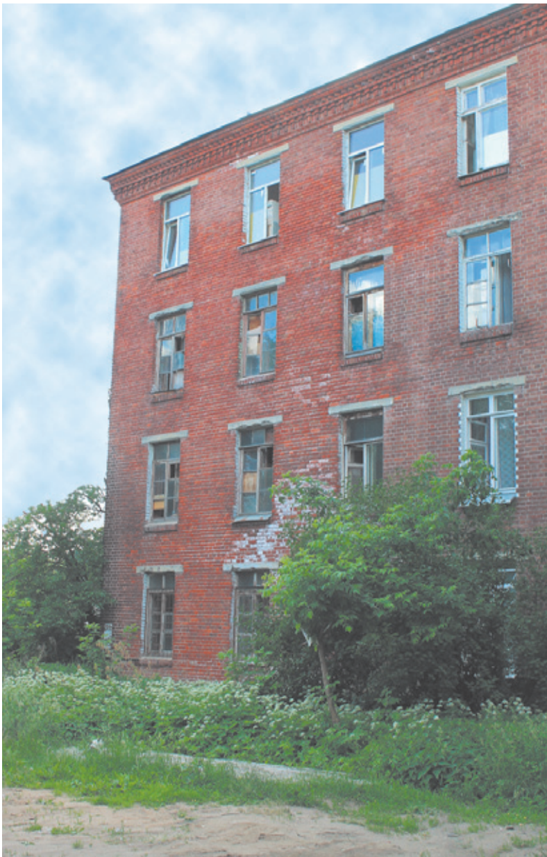
Казарма времён съёмок фильма «Светлый путь» (1940 г.); здесь по-прежнему живут люди

Мало найдётся в нашей стране людей, ни разу после рождения не обращавшихся за помощью к людям в белых халатах. Медцентры в городе рождаются на каждом углу, как грибы после тёплого осеннего дождя. К сожалению, муниципальная поликлиника в микрорайоне