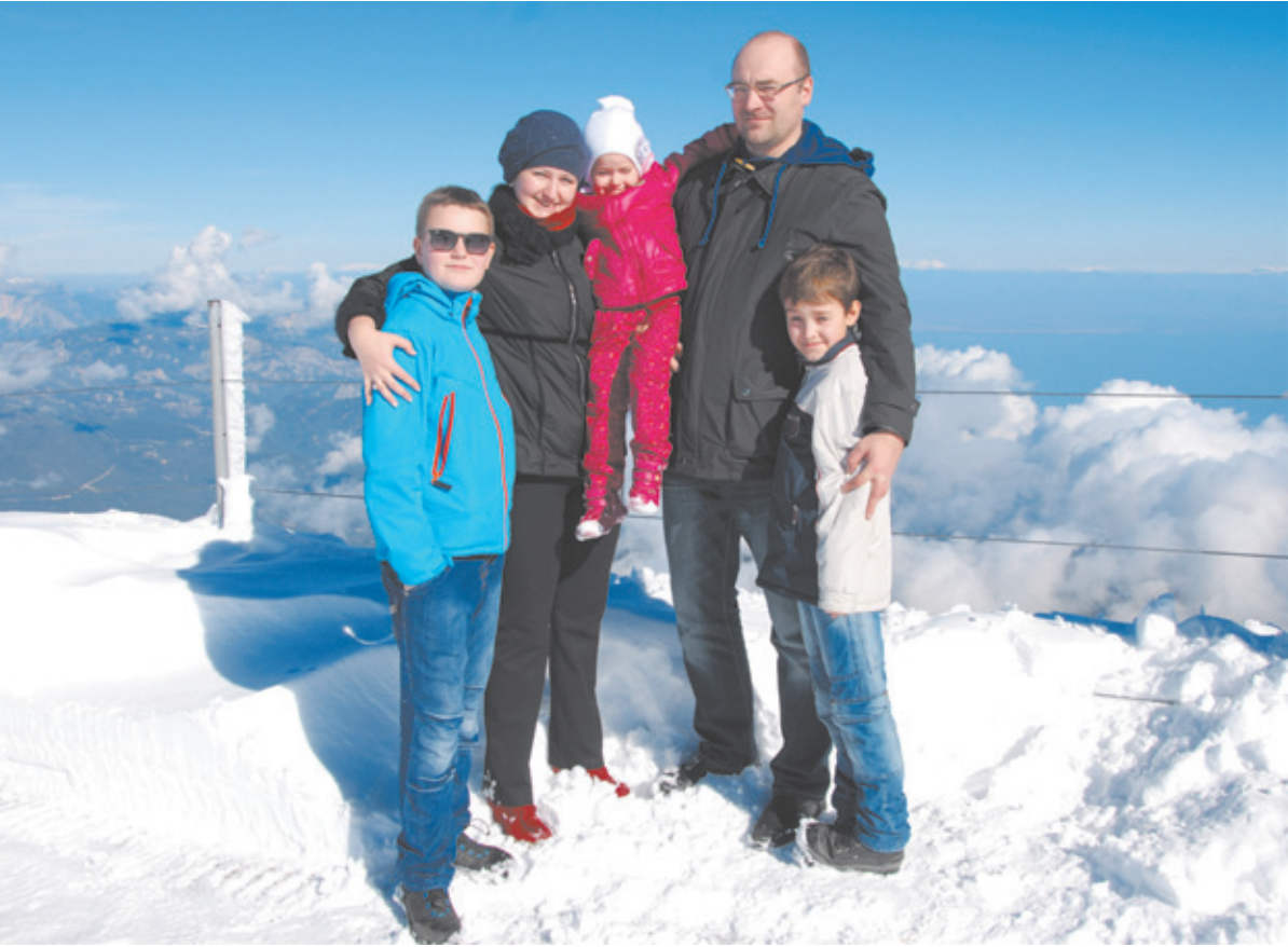
Общение всей семьёй – смысл жизни

На лето бабушки и дедушки забирали детей к себе, но всё остальное время родители и дети были вместе. Четыре года пролетели, и наступило лихое время. Как-то в одночасье стали не нужны военные медики, военные журналисты... Хорошо, что к этому времени Александру