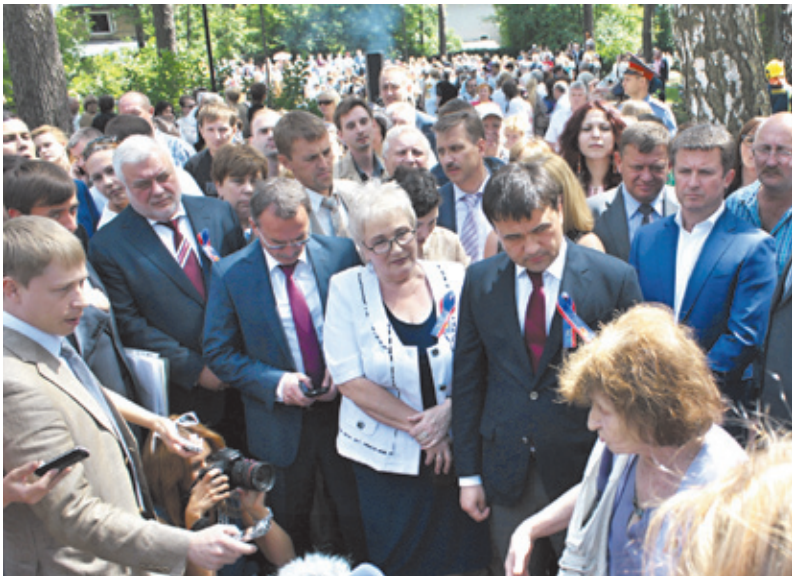
В сквере ровно год назад

В МСЧ № 170 11 июня состоялся День донора. Согласно поданным заявкам, его участниками стали около 200 жителей г. Королёва. Бригада из десяти медиков, прибывших из центра крови (г. Москва, ул. Щукинская, 6) работала около трёх часов. Каждый из доноров сдал по 450 мг крови, в итоге было собрано около 100 литров.