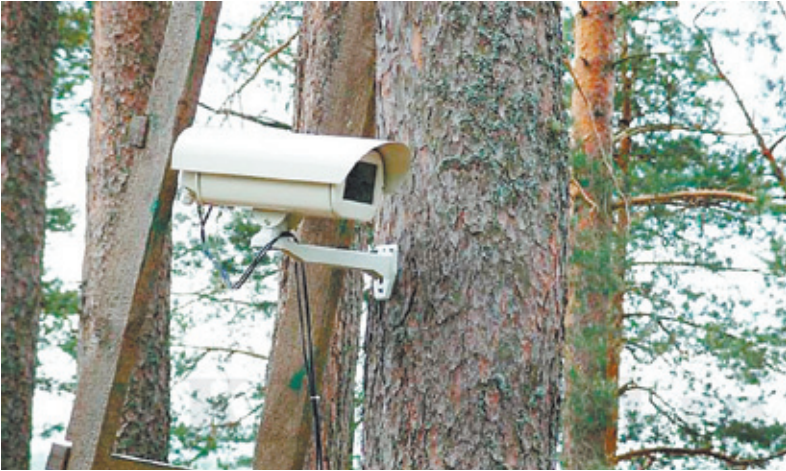
В лесах региона будут установлены видеокamеры

«К сожалению, пока камерами снабжены не все лесничества, однако в перспективе это поможет своевременно увидеть нарушения и сами возгорания. В этом году планируется ввести 33 видеокamеры, которые охватят 60% площади, к 2015 году будет снабжено 100% лесного массива», – отметил председатель комитета Мособлдумы по вопросам