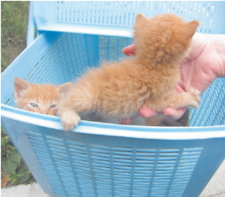
Рыжие братик и сестричка будут жить вместе!