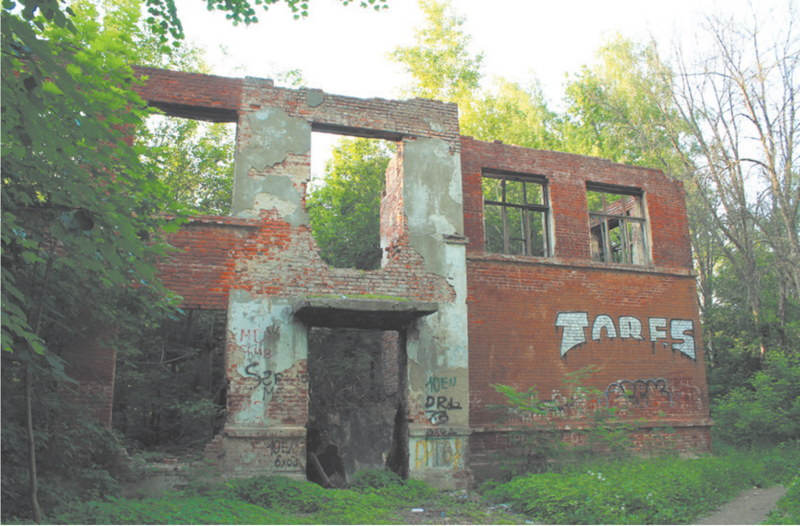
В школе сейчас не лес рук, а просто лес...

Чистый свежий воздух, пенье птиц и аромат от цветущих деревьев – далёкое прошлое Первомайки. Сейчас на главной артерии микрорайона – улице Советской – почти круглосуточно гаснут водители, издёрганные вечной пробкой. Самые нетерпеливые срезают маршрут, с визгом проносясь по внутренним дворам и раскидывая старух и мамочек с колясками по обочинам. Тротуаров в бывшем фабричном посёлке мало, люди пытаются ужиться с автомобилями на полотне автодороги. Напротив ЦКиД «Болшево» регулярно сбивают пешеходов, не успевших отскочить в сугроб или придорожную грязь. На письменные обращения граждан с просьбой об элементарной «зебре» городская администрация отвечает долгосрочными проектами, но ведь детей и взрослых сбивают сейчас! Нервничают и пешеходы, и автоводители, но улица Советская от этого шире не становится, тротуары сами собой не рождаются! «ПРОФИ-ИНВЕСТ» на публичных слушаниях в январе 2014-ого года озвучивал планы по проекту МОСАВТОДО-РА реконструировать несчастную улицу в современную 4-х полосную дорогу, но воз и ныне там. Когда увеличится численность жителей микрорайона за счёт новых