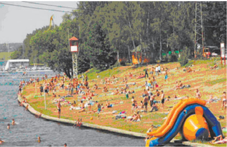
Летом в жару жители Подмосковья отдыхают на водохранилище

«Главное – чтобы на воде не гибли люди. Дело в том, что в прошлом году, например, все смертельные случаи на воде были зафиксированы на необорудованных пляжах. Местные власти, на наш взгляд, должны прилагать больше усилий, чтобы максимальное количество «диких» пляжей сертифицировать, ограждать их и приводить в соответствие с мерами