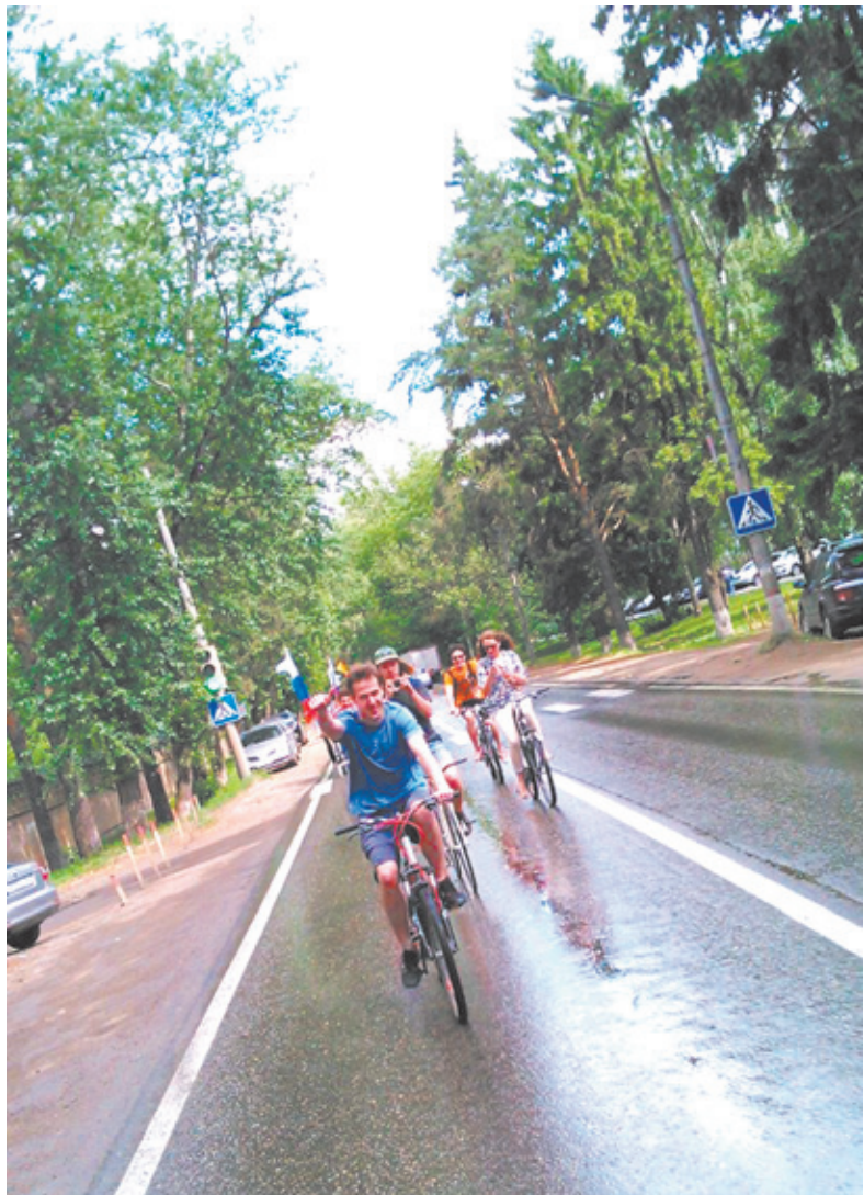
Участники велопробега на трассе

– На самом деле я очень доволен парадом, очень рад, что эти 20 человек всё-таки собрались. Потому что не было какого-то массового