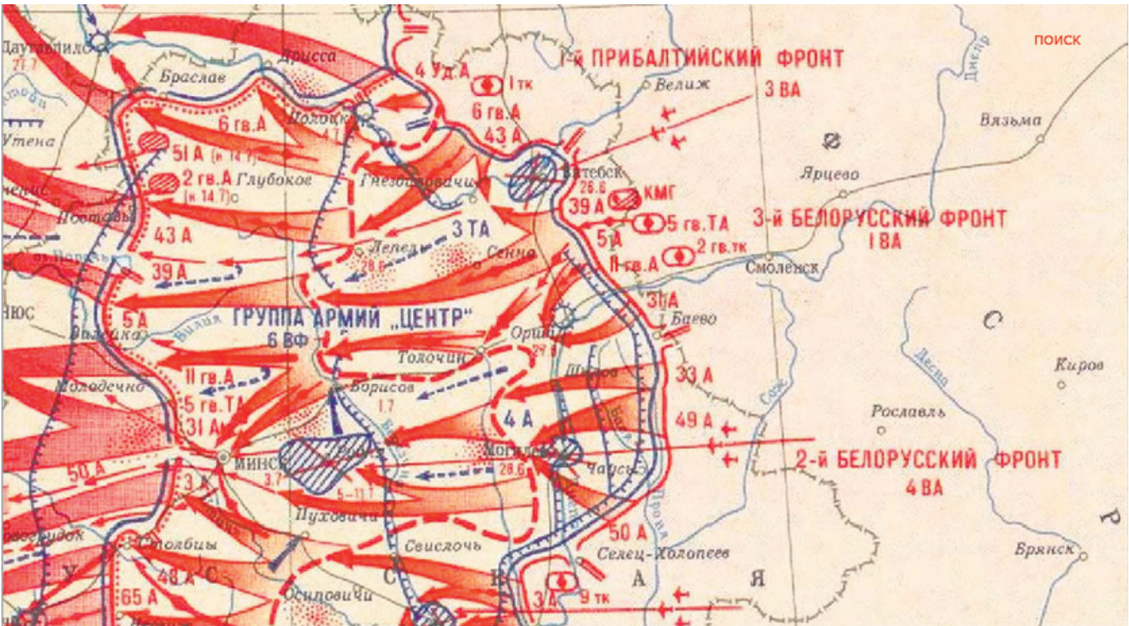
Операция «Багратион» на карте военных действий