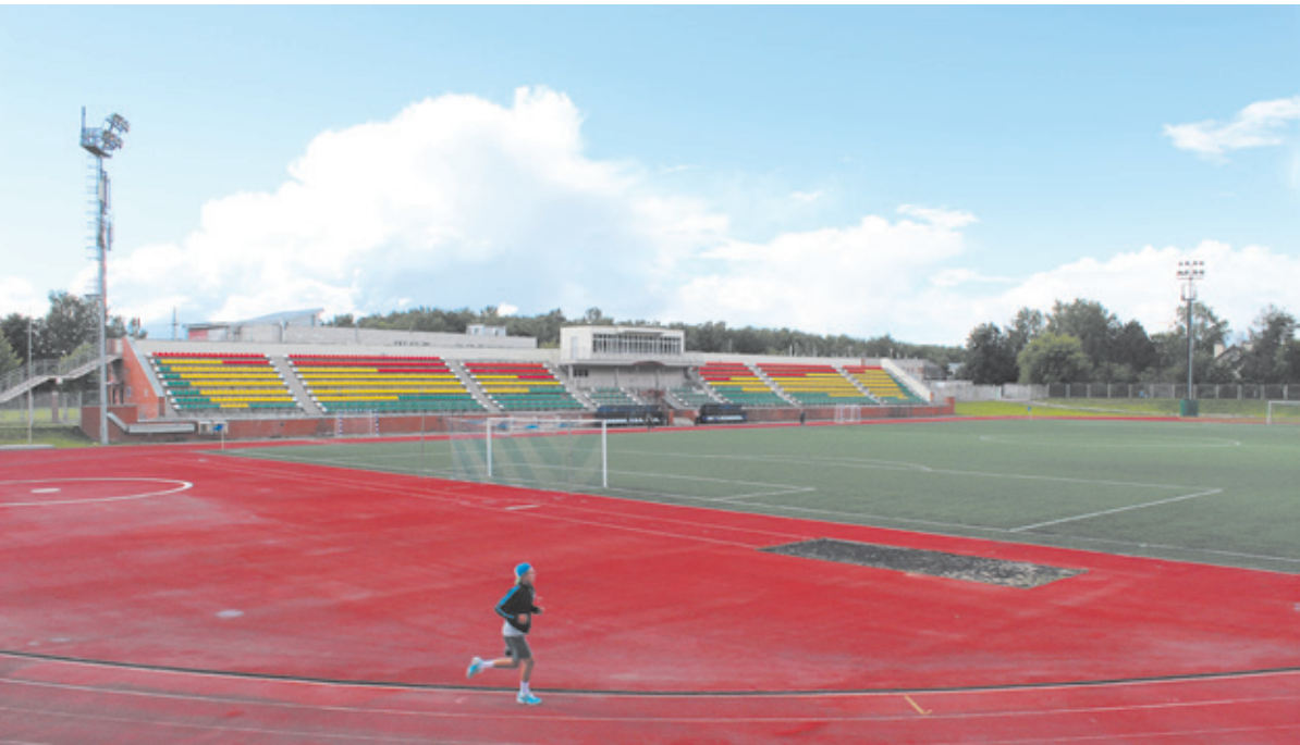
Стадион «Чайка» – лучший в области

В Юбилейном 14 городских команд. В их числе две команды ветеранов после 35 и после 45 лет, основная, женская и 8 детских команд. Два наших футбольных коллектива выступают на федеральном уровне. Это ветераны старше 45 лет, и основная команда, которая выиграла третий дивизион России, а до этого, в сезоне 2011/2012 годов, стала чемпионом Московской области. Мало городов Подмоскovie может похвастаться таким представительством на Российском уровне. Напомню, в Московской области выступают около