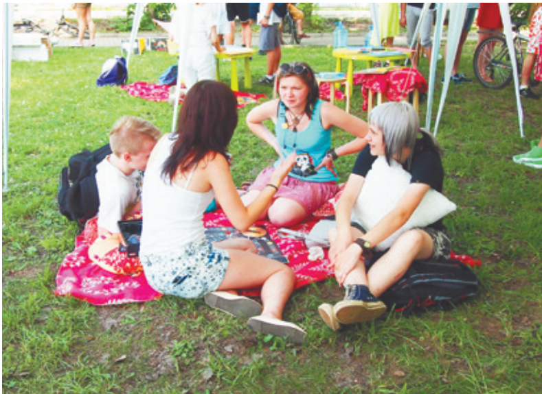
В прошлом году праздник прошёл весело, ждём того же и в этом

29 ИЮНЯ С 15 ЧАСОВ В ЮБИЛЕЙНОМ РАЗВЕРНЁТСЯ ПРАЗДНИЧНОЕ ДЕЙСТВО В ЧЕСТЬ ДНЯ МОЛОДЁЖИ. ЭТО ПРАЗДНИК ТВОРЧЕСТВА И ВОДОХВОНЕНИЯ, ЭНЕРГИИ И ЗАДОРА, ПОЗНАНИЯ И САМОУТВЕРЖДЕНИЯ, ЛЮБИИ И РОМАНТИКИ. ВМЕСТЕ С ТЕМИ, КТО ПРИНИМАЕТ ПОЗДРАВЛЕНИЯ, САМ ПРАЗДНИК ТОЖЕ МОЛОД, В 2014-м ЕМУ ИСПОЛНЯЕТСЯ 21 ГОД.