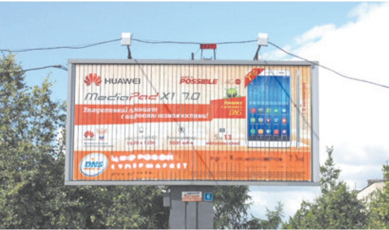
Реклама – источник доходов для города

– Практика показала, что реклама может стать серьёзным источником доходов для бюджетов муниципальных образований. Не устаю приводить в пример Одинцовский район, где упорядочивание рынка наружной рекламы уже сегодня принесло в местный бюджет почти миллиард рублей. Серьёзные деньги, которые можно потратить на благоустройство, социальную инфраструктуру, дороги. И такой источник дохода должен быть в каждом муниципальном образовании. Перед нами стоит задача – навести порядок на тер-