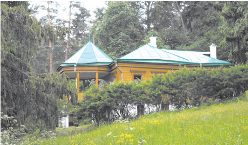
Дом-музей М.М. Пришвина

От калитки узенькая тропочка поднимается вверх, к дому. По периметру усадьбы расположены липовая и еловая аллеи, а слева от дома – яблоневый сад. Окружающая природа завораживает: особенная тишина и пение птиц, лёгкий ветерок, шелест тяжёлых еловых ветвей в аллее... Время будто остановилось. Здесь хочется радоваться этому чудесному миру, не думая о заботах. Но вот нас уже приглашают на экскурсию по дому.