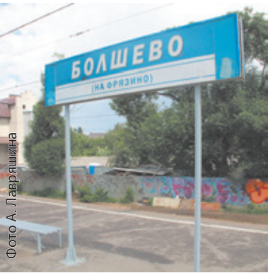
Станет ли станция «Юбилейной»?