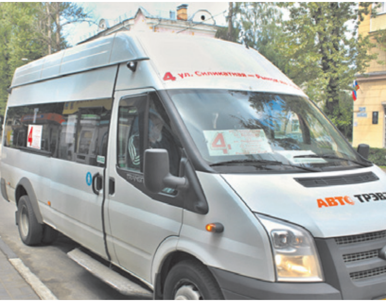
Поездка в маршрутке часто превращается в экстрим