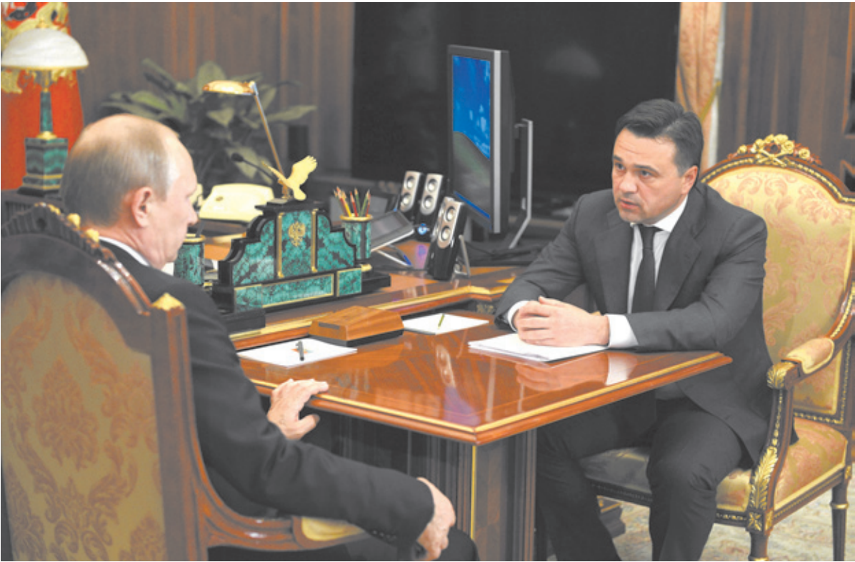
Владимир Путин и Андрей Воробьёв обсудили перспективы строительства метро в Подмосkовье

Воробьёв заверил, «сегодня не идёт речь о миллиардах рублей, ни в коем случае». Речь идёт о пар-