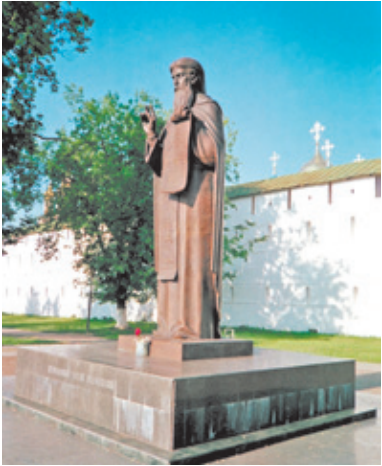
Памятник С. Радонежскому в Сергиевом Посаде

Основные торжества пройдут в Сергиевом Посаде 17–18 июля 2014 года. Ожидается, что их посетят бо-