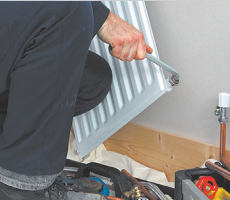
Делая ремонт, помните: знание – сила, экономящая деньги и нервы

– Напарника нигде не могу найти. Вызывайте аварийку.