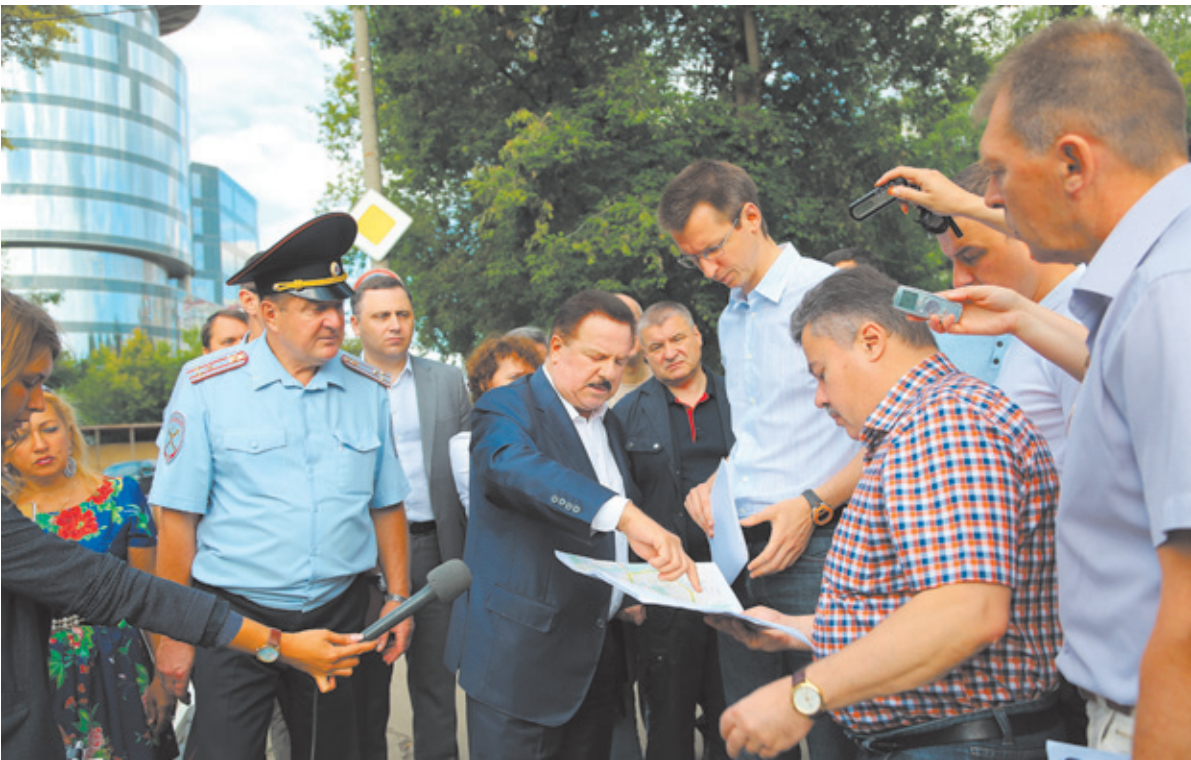
Участники выездного совещания на месте событий

Ещё один действенный способ ликвидации уличных заторов – обустройство парковок, в том числе перехватывающих. Именно поэтому областная комиссия начала выездное совещание под эстакадой, расположенной на границе Королёва. Здесь построят парковку не менее чем на 150 мест. Планируется, что на этой площадке смогут оставлять машины сотрудники ЦНИИМАШ. Пока они либо паркуются вдоль тротуаров, либо держат поток, въезжая на территорию предприятия через КПП. А вот у станций Подлипки-Дачные и Болшево уже есть перехватывающие парковки, причём по обе стороны железной дороги. Однако почти все они используются не по назначению. Так владельцем одной из площадок, оборудованной под стоянку на муниципальной земле, оказался магазин. Во всяком случае, так гласило объявление, закреплённое на будке сторожа. Здесь же участники выездного совещания нашли и прейскурант, утверждённый частником. Согласно ему, час постоя обойдётся в 50 рублей. Мало кто согласится каждый день платить пять сотен за то, чтобы пересечь