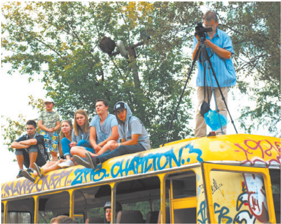
Зрители удобно устроились на крыше автобуса, чтобы ничего не пропустить

году на праздник, в Королёв приехали ребята из Украины, из Сибири, Москвы и других уголков, самыми эффектными стали выступления маленьких участников состязания. Bravo родителям, что направили необузданную мальчишескую энергию в мирное русло! Ещё свежо в памяти то, что в прошлом году Королёв выступил создателем всероссийского фестиваля уличных танцев и