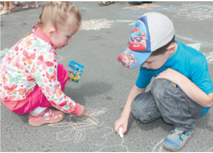
У кого получится лучше?

Асфальт перед Центром украсили фантастические ромашки: как известно, именно этот истинно русский цветок стал символом этого доброго праздника. Для детей огородили часть площади, чтобы паркующиеся машины никак не помешали