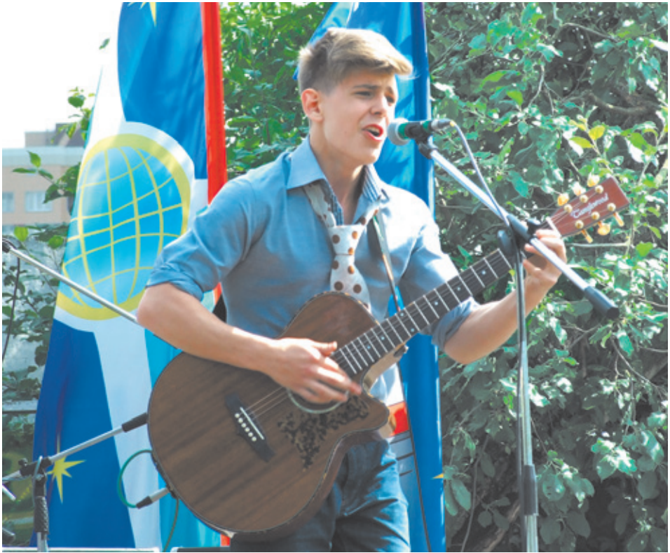
На сцене «зажигали» музыканты, создавая праздничное настроение

ник, не оставаться пассивными, не вести скучное существование, ведь каждый мо-