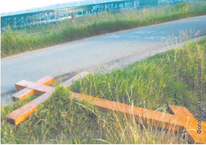
Поверженный Поклонный крест

Доведённые до отчаяния жители Королёва обращаются к господину Хамитову с просьбой «вмешаться в эту катастрофическую ситуацию и не допустить застройки Бурковского поля, ведущего свое начало от древних поселений славян-вятичей XI века, на котором стояли войска Дмитрия