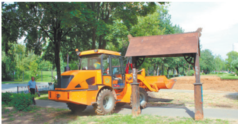
Железный конь уже в работе!