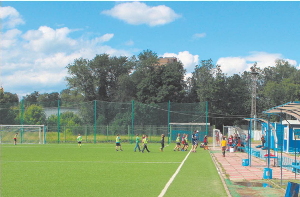
Скоро воспитанники ДЮСШ «Металлист» будут обживать новенький ФОК

– Совсем скоро воспитанники ДЮСШ «Металлист» будут обживать новенький физкультурно-оздоровительный комплекс (ФОК)?