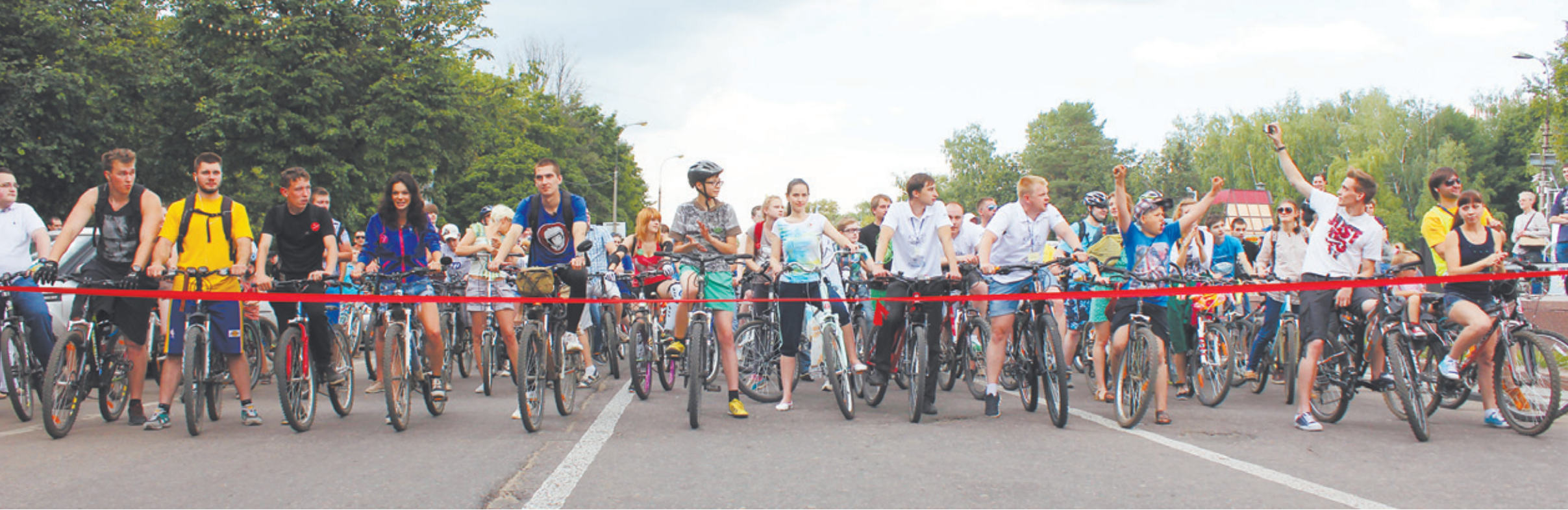
Более пятисот человек ожидают старта. Такого масштабного велопробега в Королёве ещё не было