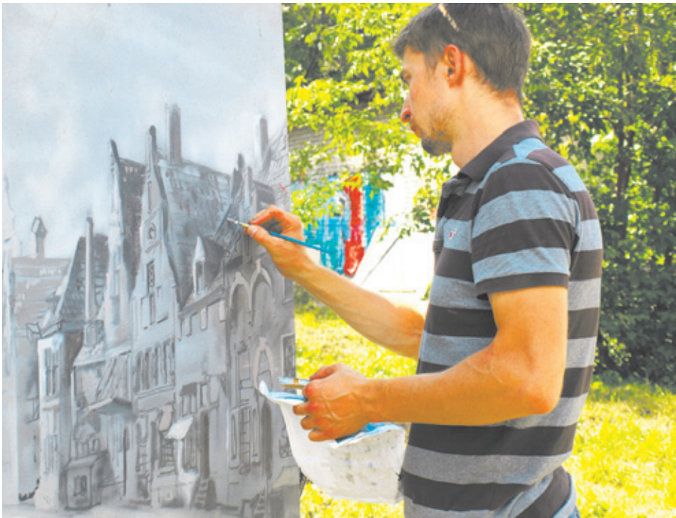
Чёрно-белый город Сергея Батькова