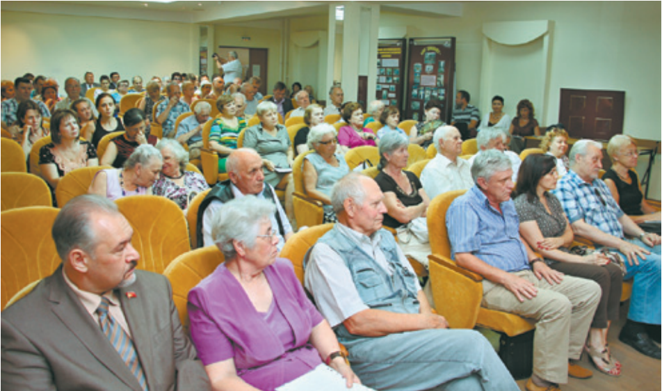
На встрече поднимались самые острые вопросы, волнующие юбилейчан

– В новой администрации «Большого Королёва» будут работать территориальные управления на местах: в Болшеве, Первомайке, Текстильщиках и Юбилейном. Иначе вести политику и создать экономику невозможно. При объединении, – образно выразился советник, – мы получим ладонь с пятью пальцами: один болит, всем плохо. Соединив бюджеты, мы сможем учитывать интересы каждого района. При поддержке губернатора Подмоскoвья Андрея Воробьёва и министра обороны России Сергея Шойгу часть территории 4 ЦНИИ будет отдана для развития технoбазы наукоёмкого производства. Есть компании, которые желают инвестировать этот проект. – Будем решать, что и как делать с Комитетским лесом, с «Лесной короной», с Папанинской дачей, с прудом, — сказал Ходырев. – Я обещаю, что ни в коем случае не будут нарушены местные традиции, и вместе с юбилейчанами мы будем создавать удобные условия жизни.