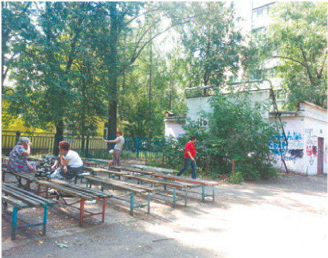
Площадка у дома № 146 по пр. Королёва до и после благоустройства