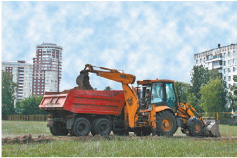
Строительство ФОКа началось