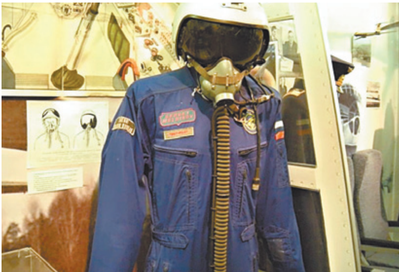
Он ждёт вас в музее!

Зал истории покорения неба рас-крывает историю авиации, начиная с доисторического периода. Здесь со-брана уникальная коллекция обмун-