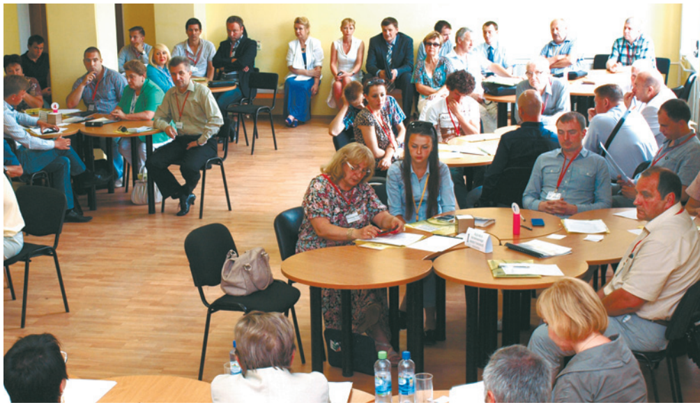
Идёт деловая игра

ПРЕДСТАВИТЕЛИ ОБЩЕСТВЕННОЙ ПАЛАТЫ г. КОРОЛЁВА 24 ИЮЛЯ ПРОВЕЛИ БИЗНЕС-ИГРУ, В ХОДЕ КОТОРОЙ ОПРЕДЕЛИЛИ НАИБОЛЕЕ ПРОБЛЕМНЫЕ УЧАСТКИ ГОРОДСКОГО ХОЗЯЙСТВА И НАМЕТИЛИ ОСНОВНЫЕ НАПРАВЛЕНИЯ СВОЕЙ БЛИЖАЙШЕЙ РАБОТЫ. ПОСЛЕ ЭТОГО СОСТОЯЛАСЬ ВСТРЕЧА ЧЛЕНОВ ОБЩЕСТВЕННОЙ ПАЛАТЫ С ПОМОЩНИКАМИ СОВЕТНИКА ГУБЕРНАТОРА МОСКОВСКОЙ ОБЛАСТИ В КОРОЛЁВЕ. В СОСТОЯВШЕМСЯ ОТКРЫТОМ ДИАЛОГЕ РЕЧЬ ШЛА О НАИБОЛЕЕ ОСТРЫХ ГОРОДСКИХ ВОПРОСАХ.