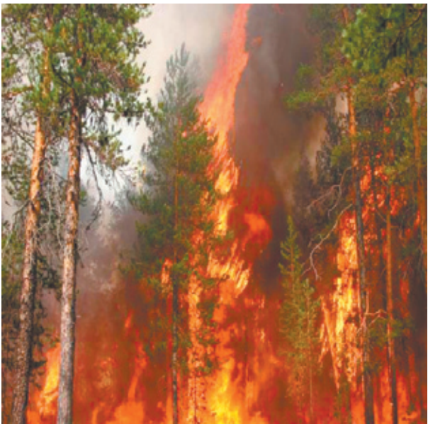
Берегите лес, не допускайте нарушения правил!

Пока пожарной охране удаётся оперативно их ликвидировать, однако опасность велика. Информуем, что при ограни-