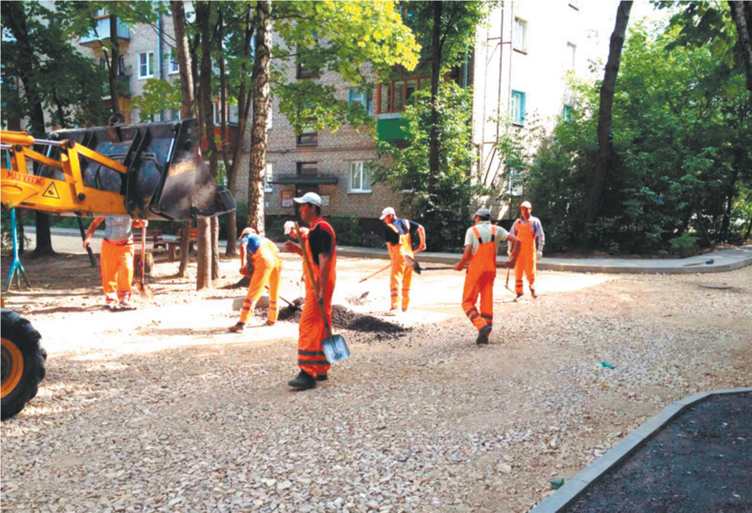
В Королёве начались работы по благоустройству придворовых территорий

Что касается дворовых площадок для занятий спортом, то, по словам членов Общественной палаты, в нынешнем состоянии они просто опасны для здоровья детей. Как выяснилось, группа специалистов по по-