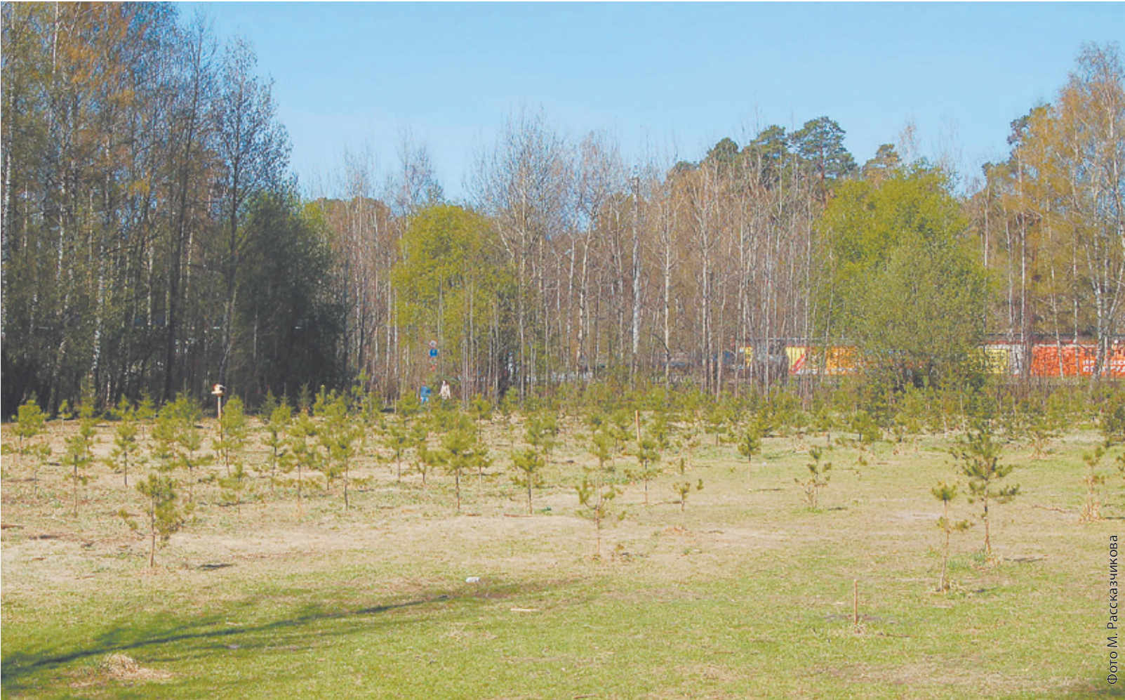
Выживут ли эти молодые деревца?

Июль 2006. Повторно рассмотреть положение об особо охраняемой территории. Результат: вопрос