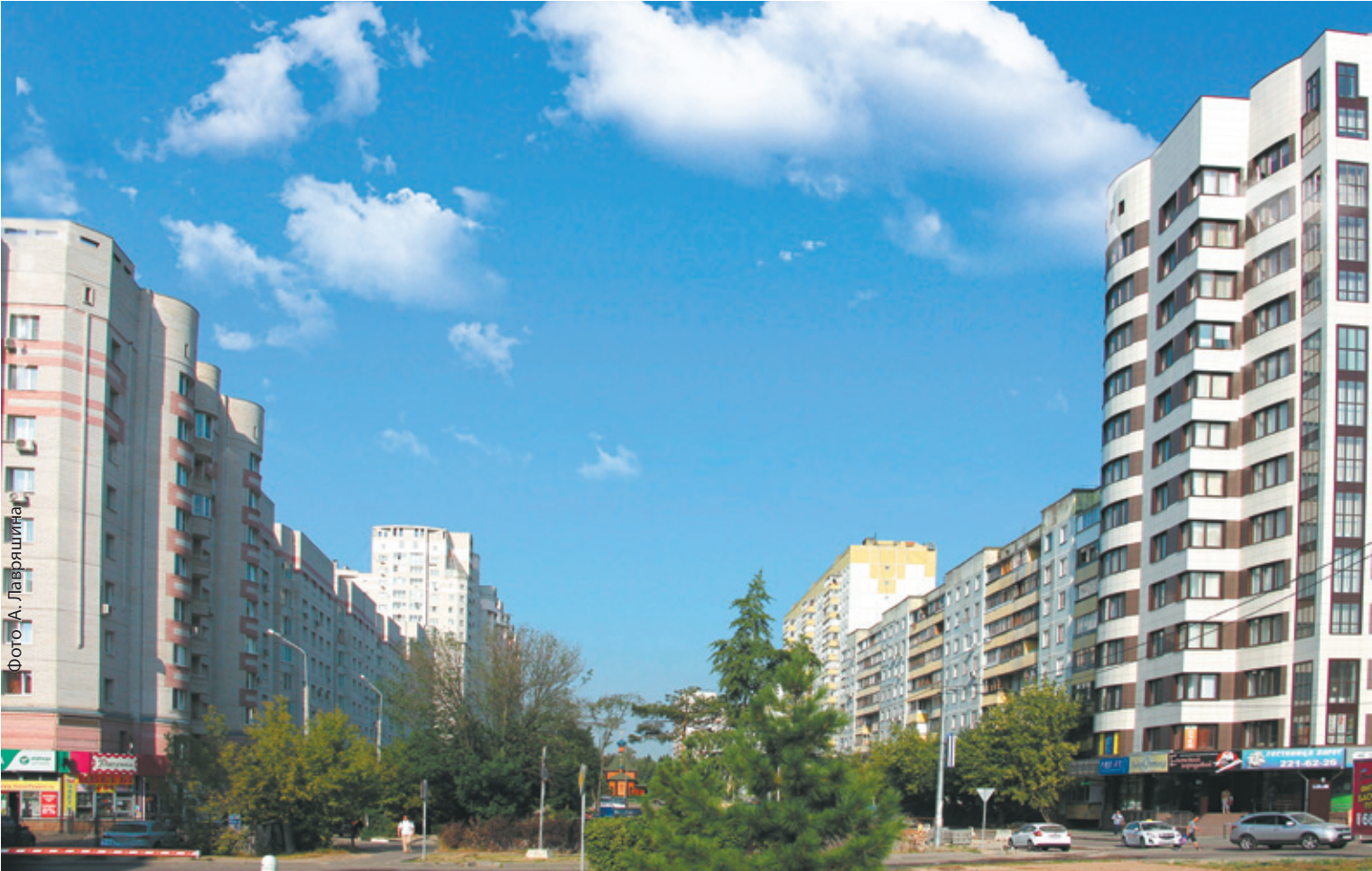
Интересна судьба улицы Пушкинской: до объединения разные её части принадлежали двум городам — Королёву и Юбилейному. Теперь она войдёт в состав объединённого наукограда.

ОБЪЕДИНЕНИЕ КОРОЛЁВА И ЮБИЛЕЙНОГО – БЕЗУСЛОВНО, ЗНАКОВОЕ СОБЫТИЕ ДЛЯ ЖИТЕЛЕЙ ОБОИХ ГОРОДОВ. И ДЛЯ МНОГИХ ЗНАК ЭТОТ – ВОПРОСИТЕЛЬНЫЙ. В ТОМ СМЫСЛЕ, ЧТО У ЛЮДЕЙ ВОЗНИКАЕТ МНОЖЕСТВО ВОПРОСОВ: НАЧИНАЯ ОТ ТОГО, ЗАЧЕМ ЭТО НУЖНО И ЗАКАНЧИВАЯ ТЕМ, ПРИДЁТСЯ ЛИ МЕНЯТЬ АДРЕС ПРОПИСКИ В ПАСПОРТЕ. ТАК УЖЕ ПОВЕЛОСЬ, ЧТО ЛЮДИ В НАШЕЙ СТРАНЕ НЕ ЛЮБЯТ ПЕРЕМЕН, И В ЦЕЛОМ НАС СЛОЖНО ЗА ЭТО ОСУЖДАТЬ.