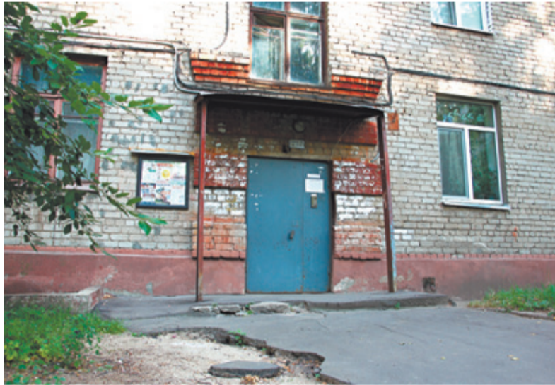
Дому № 9 по ул. Трофимова уже 57 лет, а капитального ремонта не было ни разу

В едином платёжном документе («платёжке») для нанимателей, проживающих в муниципальном жилищном фонде, не может быть платы за капитальный ремонт, которую оплачивают собственники жилых и нежилых помещений, а только плата за наём. В соответствии с рекомендательным письмом Совета муниципальных образований Московской области от 25.03.2014 г. № 29 (размещено