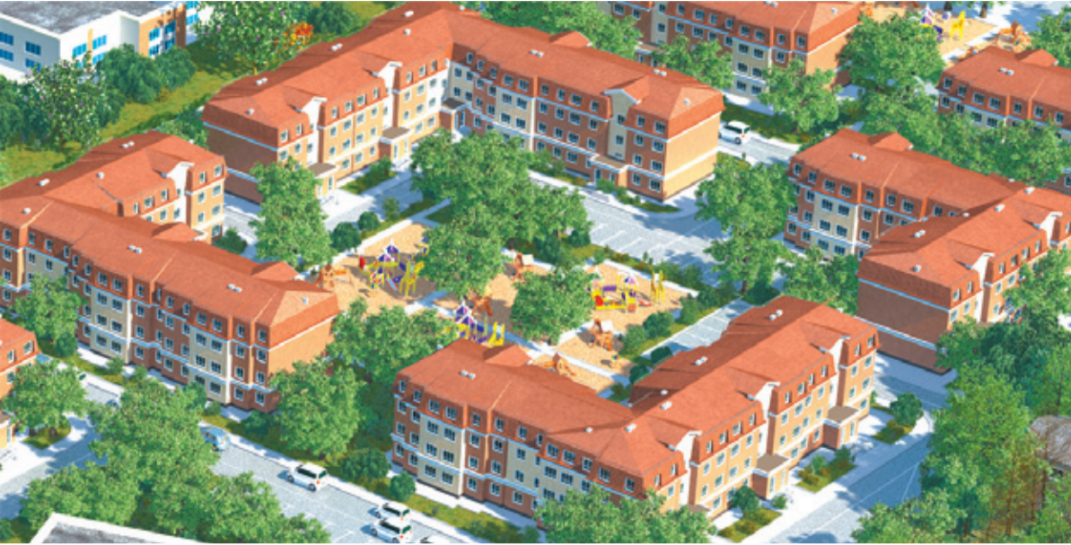
Так будет выглядеть новый район

инициативной группы жителей Буркова, выступая на круглом столе в администрации, отметил, что основная проблема этого района – транзит транспорта через дачную зону в Ивантеевку и Щёлково. По словам руководителя строительства Сергея Левченко, совместные с инициативной группой подсчёты показали, что за сутки там проходит порядка 3–5 тысяч автомобилей. Существующие дороги не в состоянии справиться с такой нагрузкой. Компания «Гранель» готова взять на себя решение этого вопроса, расширив Полевую, Дачную и Речную улицы и установив шлагбаум на въезде на улицу Спартаковскую, а также отремонтировать дорожное полотно на проезде Слепнева.