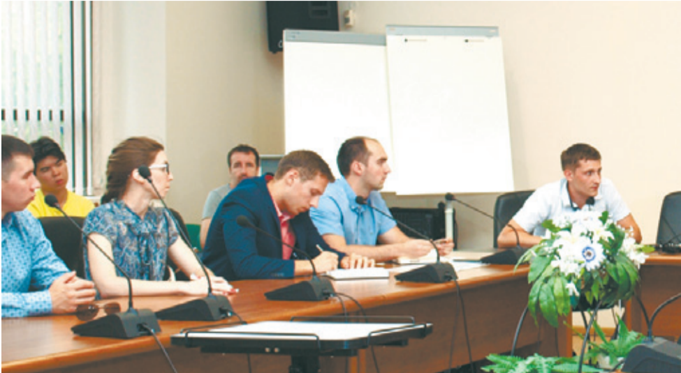
Совет молодых учёных поддерживает строительство технопарка

Идея провести утреннюю гимнастику для всех маленьких горожан родилась у юных королёвских волонтеров. Доброе начинание поддержал Отдел по делам