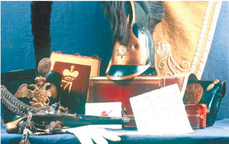
Память о героях Бородина

Пока позволяет погода, советуем побывать в музее-заповеднике «Бородинское поле». То самое, воспоет Лермонтовым, что всем известно ещё со школьной скамьи. Пора самим увидеть историческое место, составившее славу России. Знаменательной вехой в истории Бородинского поля стал 1839 г., когда в присутствии императора Николая I и двухсот участников Бородинского сражения на Курганной высоте (Батарее Раевского) был освящён монумент в память доблестных защитников Отечества. У его основания был захоронен прах генерала П.И. Багратиона и построена сторожка для воинов-ветеранов, которые ухаживали за памятником и могилой, вели Книгу записей, показывали приезжающим план сражения, находки с поля битвы. Так родился музей. Но ещё до этого в 1820 г. вдова генерала Тучкова построила на месте гибели любимого супруга церковь Спаса Нерукотворного. Этот храм стал центром монашеской пустыни, которая позднее была преобразована в Спасо-Бородинский женский