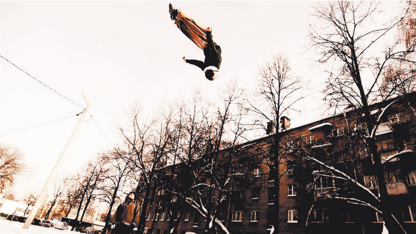
Паркур – одно из средств самовыражения и преодоления своих страхов

Главной идеей паркура является выраженный его основателем Давидом Беллем принцип: «Нет границ, есть лишь препятствия». Основные ограничения накладываются тремя аксиомами: безопасность, эффективность, простота. В Королёве функционирует своя инициативная группа молодёжи, увлечённая этой смесью акробатики, лёгкой атлетики, боевых искусств и альпинизма.