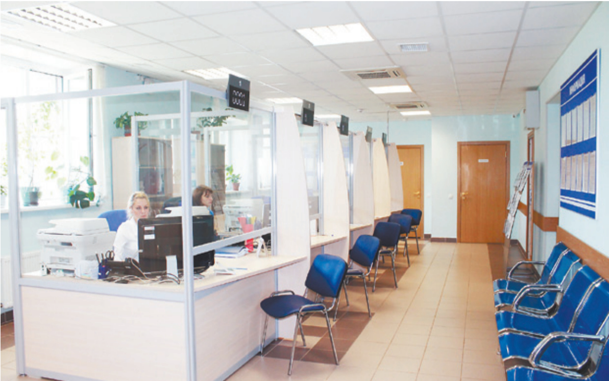
Пока в МФЦ немного посетителей, но их очень ждут