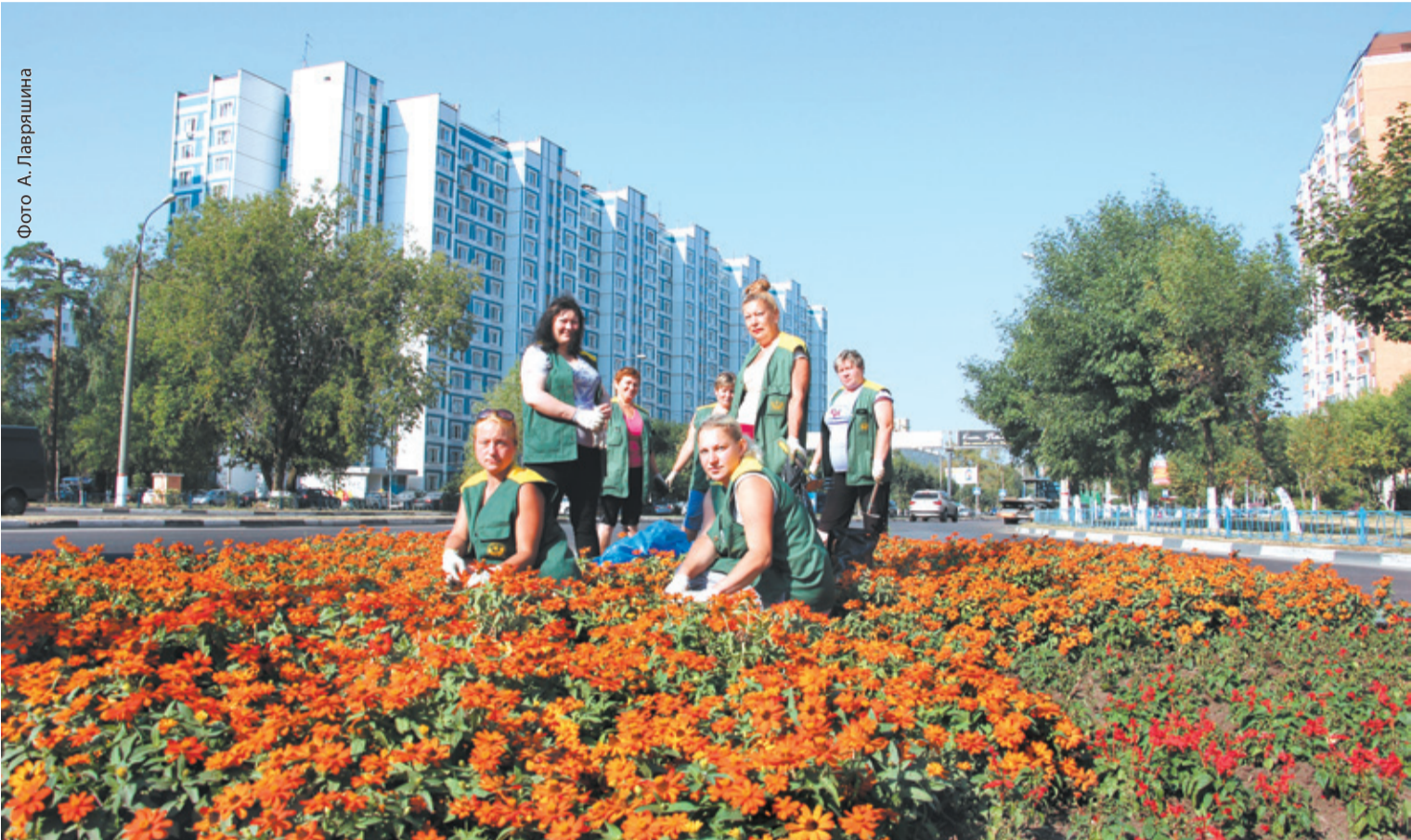
Город преобразается. Теперь на жалобы жителей по благоустройству власти будут реагировать более оперативно

«ОТ НАШЕГО ПОДЪЕЗДА ДОМА № 10 НА УЛИЦЕ ГЛИНКИНА В СТОРОНУ СКВЕРА ИДЁТ ДОРОЖКА МЕТРОВ 10, ПО КОТОРОЙ ХОДИТЬ ПРОСТО ОПАСНО, ОСОБЕННО ПОЖИЛЫМ И БОЛЬНЫМ, КОТОРЫЕ ДАЖЕ ПАДАЮТ НА ЗАБОРЧИК, КОТОРЫЙ МЫ В СВОЁ ВРЕМЯ (12 ЛЕТ НАЗАД) ПОСТАВИЛИ. ЗАБОРЧИК СОВСЕМ РАЗВАЛИЛСЯ. В ПЛАНЕ ЖКХ НА 2012 ГОД БЫЛ ВНЕСЁН ПУНКТ «УСТАНОВКА НОВОГО ЗАБОРЧИКА», НО ДО СИХ ПОР ЭТО НЕ ВЫПОЛНЕНО».