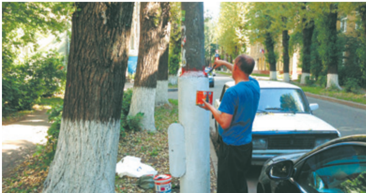
Идёт покраска деревьев и столбов