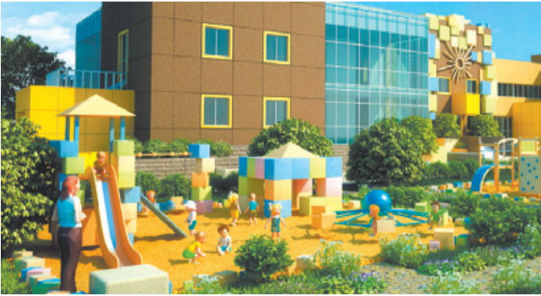
Будущий детский сад

Расчётное количество жителей в связи с уменьшением квадратных метров жилья, соответственно, тоже стало меньше – предполагается, что в новый микрорайон заедет чуть более 4 тысяч жителей. При