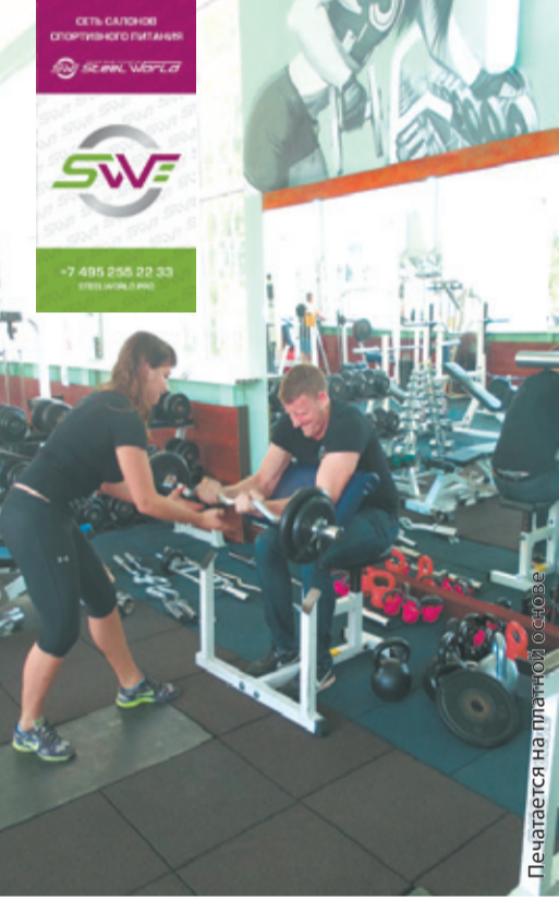
Следуйте нашим несложным советам!

Разобравшись с теорией, перейдём к практике. Мышцы рук состоят из мышц плеча (верхняя часть руки), предплечья и кисти. Сегодня мы рассмотрим основные группы мышц: бицепс, трицепс, предплечье.