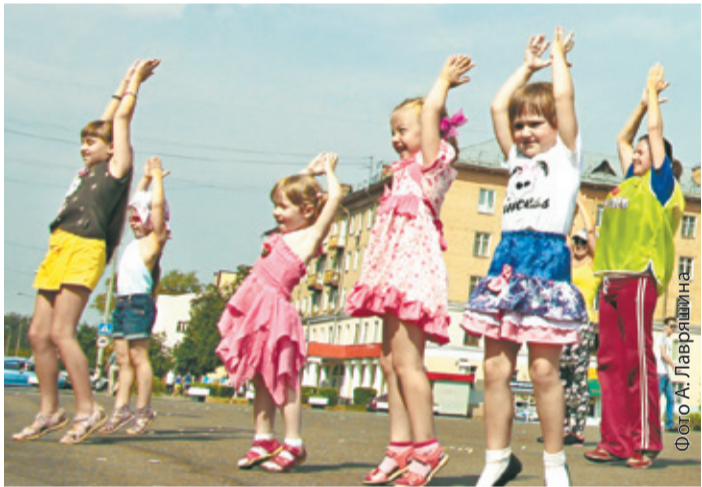
Мы ловим энергию солнца!