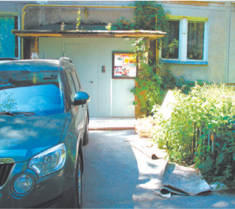
Жители остались недовольны проведённым ремонтом. Строительный мусор так и остался около подъезда