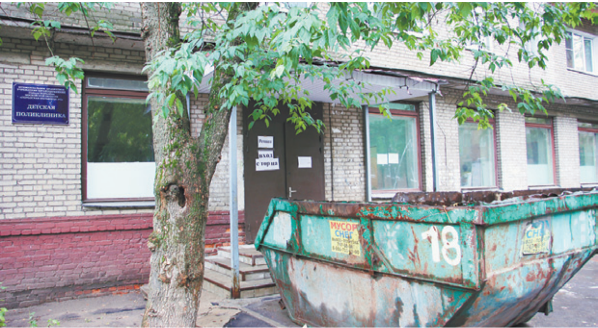
Учреждения здравоохранения города нуждаются в ремонте

Были сделаны попытки разработать городскую программу по дополнительной соцподдержке