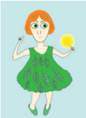
Рисунок Евгения Лавряшина

ПРОДОЛЖАЕМ ПУБЛИКАЦИЮ РАБОТ УЧАСТНИКОВ ТРЕТЬЕГО ГОРОДСКОГО ЛИТЕРАТУРНОГО КОНКУРСА «ПЁРЫШКИ ПЕГАСА». ПРЕТЕНДОВАТЬ НА ПОБЕДУ МОЖЕТ ЛЮБОЙ ШКОЛЬНИК И ДАЖЕ ДОШКОЛЬНИК, ПИШУЩИЙ СТИХИ ИЛИ КОРОТКИЕ РАССКАЗЫ. ПРИСЫЛАЙТЕ РУКОПИСИ! ПО ИТОГАМ ЧИТАТЕЛЬСКОГО ГОЛОСОВАНИЯ ОДИН ИЗ АВТОРОВ ПОЛУЧИТ СПЕЦИАЛЬНЫЙ ПРИЗ!