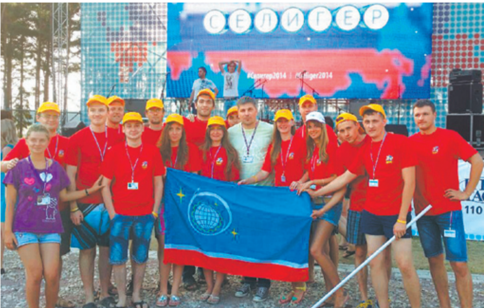
Королёвская делегация на форуме

– Если корпорация будет готова какие-то свои разработки привнести в повседневную жизнь, то, зная запросы экспертной комиссии, зная требования, как готовить проект,