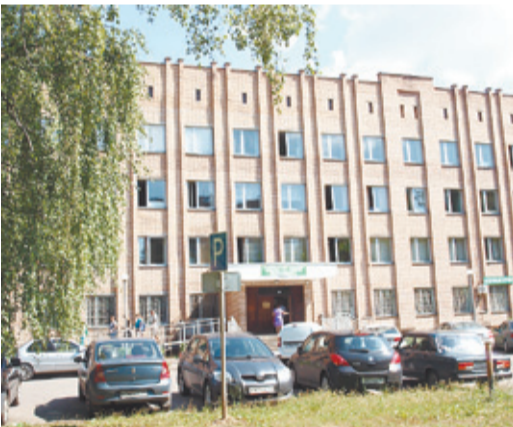
Поликлиника № 2

И так, на часах 8.30. Чтобы сдать анализ крови, стоять в очереди не пришлось. Для проходящих диспансеризацию предусмотрен отдельный кабинет – 301-й. ЭКГ и флюорографию я также сделала быстро – очередей не было. Стрелки показывают 10.00, я могу идти на работу. Правда, вечером придётся прерваться на пару часов