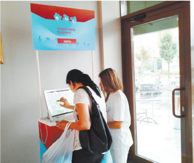
Каждый житель может поучаствовать в создании города будущего

P.S. Наша газета будет следить за дальнейшим развитием событий вокруг возможной застройки Бурковского поля.