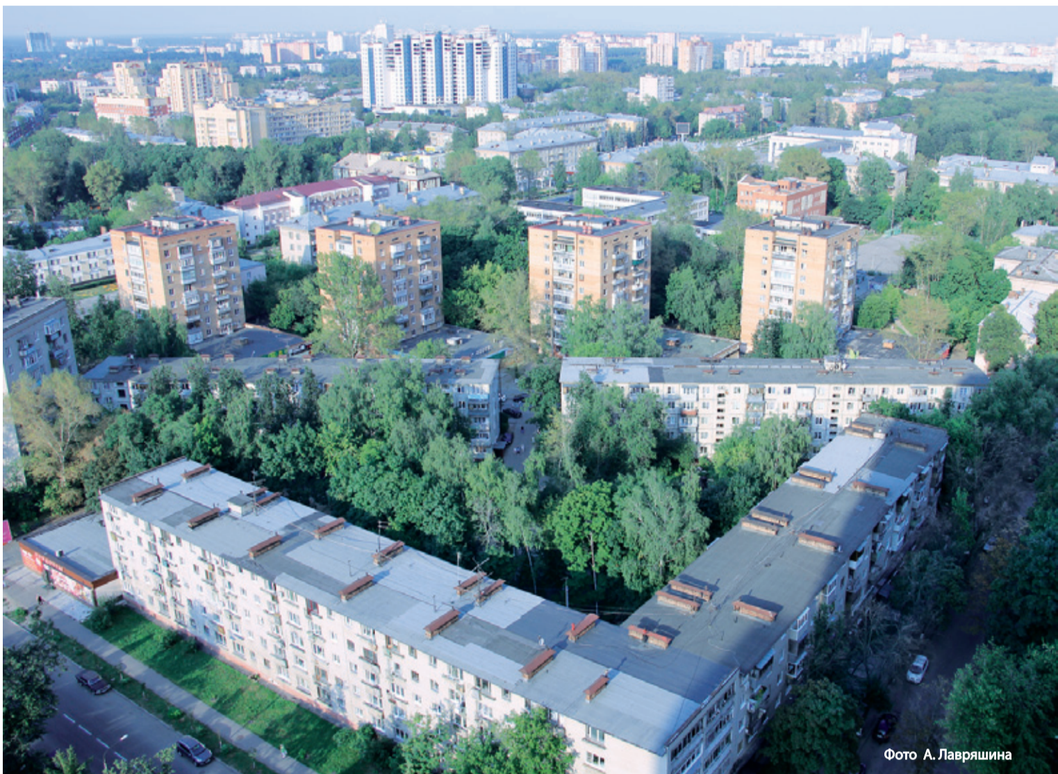
76% жителей поддержали создание общего Генплана «Большого Королёва»

9 И 10 АВГУСТА КАЖДЫЙ ЖИТЕЛЬ «БОЛЬШОГО КОРОЛЁВА» СМОГ НЕ ПРОСТО ВЫСКАЗАТЬ СВОЁ МНЕНИЕ ПО КЛЮЧЕВЫМ ВОПРОСАМ РАЗВИТИЯ ОБЪЕДИНЁННОГО ГОРОДА И БЫТЬ УСЛЫШАНЫМ, НО И ПРЕДЛОЖИТЬ СОБСТВЕННЫЕ ИДЕИ РАЗВИТИЯ.