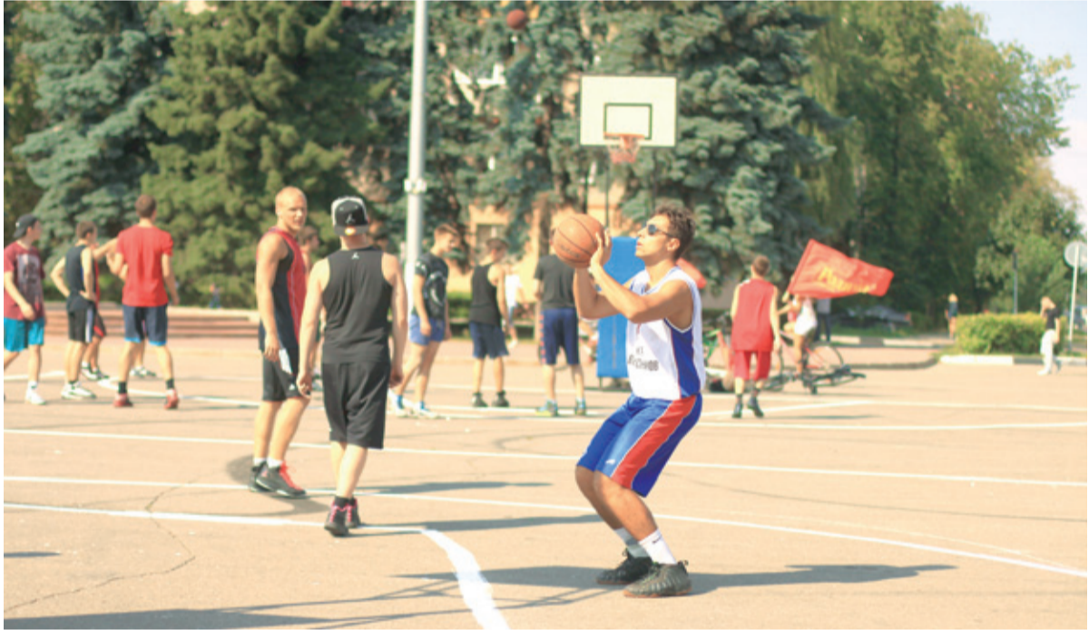
Перед началом игры надо размяться по-настоящему

9 августа, в субботу, наша страна отметила День физкультурника – один из самых красивых и зрелищных праздников. Чтобы нация была здоровой, людей, в первую очередь, молодёжь, необходимо массово привлекать к занятиям спортом. Во времена СССР этой цели служила сдача норм ГТО («Готов к труду и обороне»). В прошлом году президент России Владимир Путин объявил о готовности вернуть советскую систему в современном формате, а 24 марта нынешнего года подписал Указ о возрождении Всероссийского физкультурно-спортивного комплекса «Готов к труду и обороне» (ГТО) – программной и нормативной основы физического воспитания населения. Но ещё в октябре 2012 года эту же тему затрагивал зампреда правительства российского правительства, курирующий оборонно-промышленный комплекс страны, лидер партии «РОДИНА» Дмитрий Рогозин. «Говоря о нормах ГТО и о других вопросах, связанных с воен-