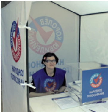
Такие палатки были установлены в 40 точках города