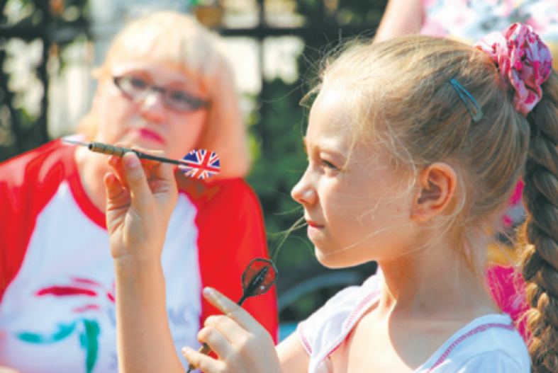
В дартсе нужны внимание и меткость

Чего точно не было на этом празднике, так это скуки, потому что каждый мог выбрать занятие себе по силам. Тем, кто предпочитает в спорте роль болельщика, тоже было чем себя занять, поскольку с самого утра на «Вымпеле» началась серия футбольных матчей, участие в которых приняли в том числе и команды предпри-