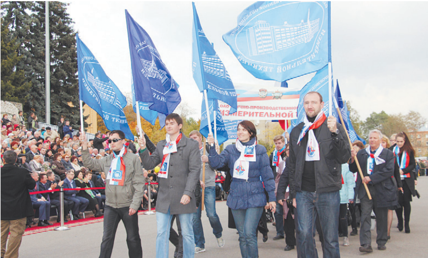
Шествие предприятий города

– это не только умницы и умники, которым без труда даются самые непростые науки и учебные дисциплины, но и созвездие настоящего творческих личностей, что быть студентом – это не только просиживать за учебниками, но и уметь веселиться и заряжать своей энергией окружающих!