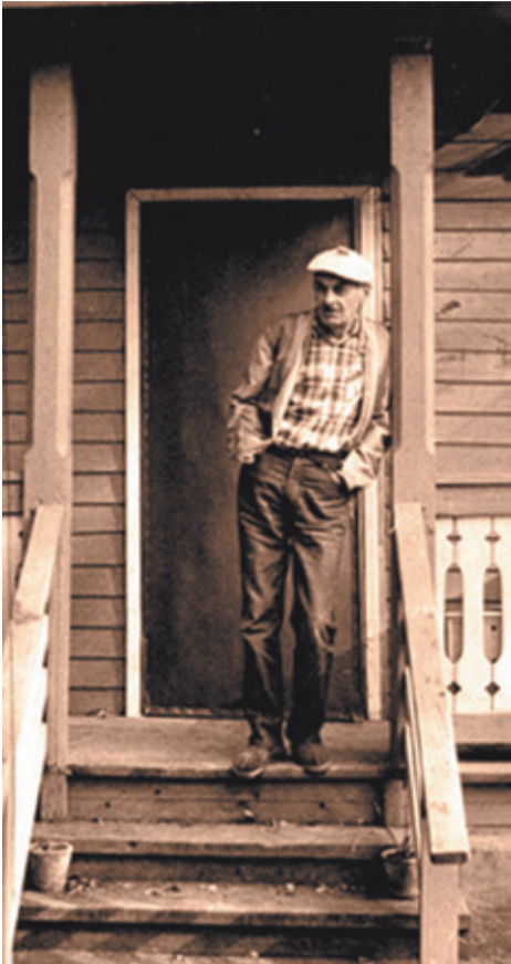
Он ждёт вас в музее!

боты». В прошлом году в музее начали читать публичные лекции «Неожиданные встречи» по искусству, науке, общественной жизни. Для детей здесь проводятся весёлые праздники, спектакли, ярмарочные представления и рождественские ёлки. А также занятия, названные «Булатовы воскресенья». Под руководством профессионалов дети лепят, рисуют и даже делают музыкальные инструменты, а потом играют на них, пока родители пьют чай из настоящего самовара. С баранками! Адрес: поселение Внуковское, посёлок ДСК «Мичуринец», ул. Довженко, дом 11.Тел.: 8 (495) 593-52-08; 8 (495) 731-77-27 Проезд: электричкой от Киевского вокзала до платформы «Мичуринец» и 10 мин. пешком. На машине: по Минскому шоссе (поворот в посёлке Баковка по указателю «Зона отдыха «Переделкино»). Илья Романов, фото Ю. Феклистова