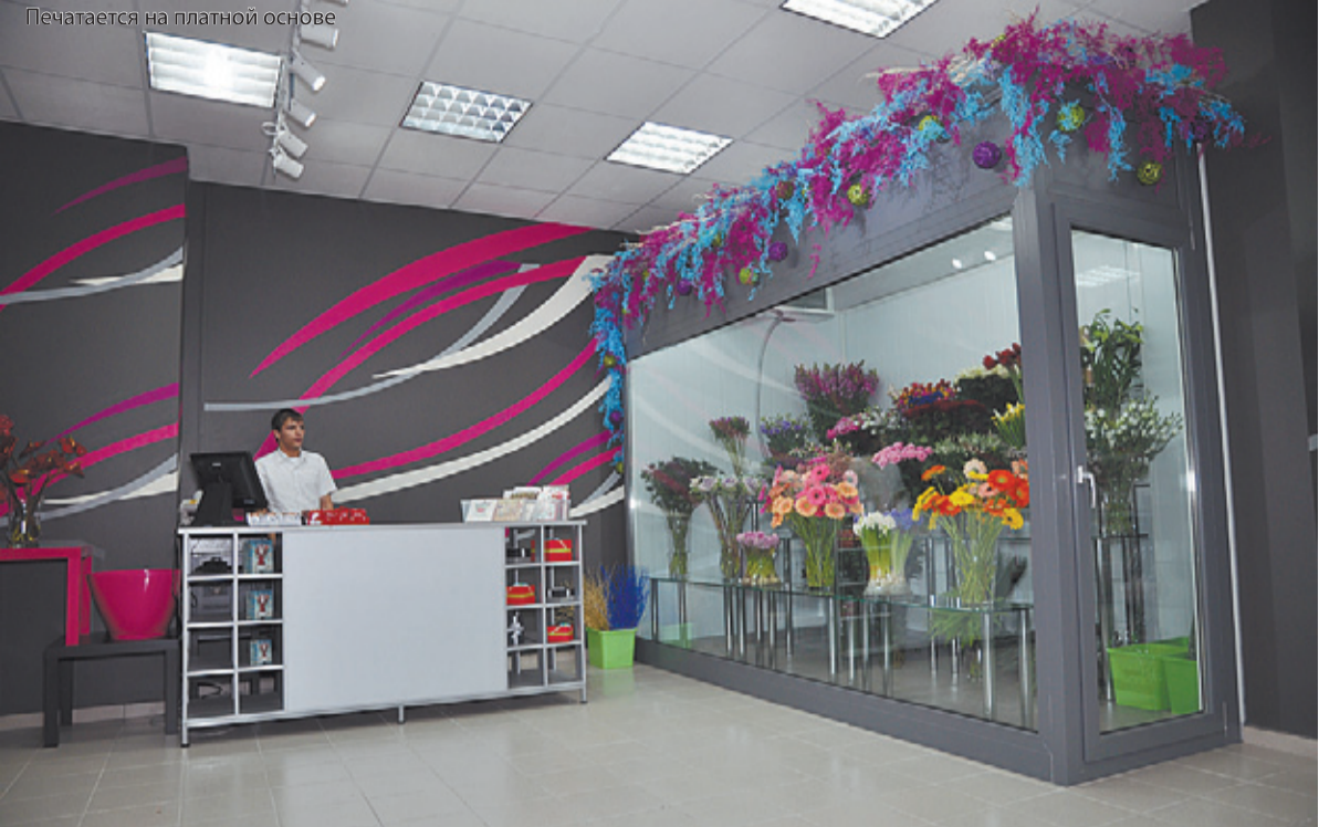
Место, где царит волшебство