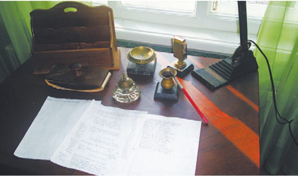
Экспонаты из Франции были представлены в музее

В 1922 году Марина Цветаева была вынуждена эмигрировать за границу. Долгие годы она скиталась по разным городам Европы в поисках места, которое могло бы заменить ей дом. Последним её прибежищем стал Париж. Марина Цветаева провела во Франции 12 лет. Это было тяжёлое время: её стихи почти не печатали, семья жила впроголодь. Последней каплей стало обвинение в адрес её мужа, которого подозревали в сотрудничестве с НКВД. В 1937 году муж Цветаевой Сергей Эфрон добился разрешения вернуться на Родину, а в 1939 в Россию, наконец, смогла вернуться и Марина Цветаева. И первым местом, где она поселилась, стала дача в подмосковном Болшеве. Сейчас это здание превращено в Мемориальный Дом-музей имени Марины Цветаевой, который после длительной реставрации уже год гостеприимно открыт для посетителей. Годы пребывания Цветаевой в Париже оставили свой след как в культуре Франции, так и в судьбе Марины Ивановны. Несмотря на бытовые трудности пребывания в эмиграции, в это время ею было написано множество произведений. Очевидно, в Париже она чувствовала себя в безопасности и потому способна была творить. Однако она всегда оставалась русской, всё равно стремилась на Родину. «Я не хочу жить в Париже, здесь все заняты собой», – это её слова. Сейчас литературоведы России и Франции стараются поддерживать между собой связь,