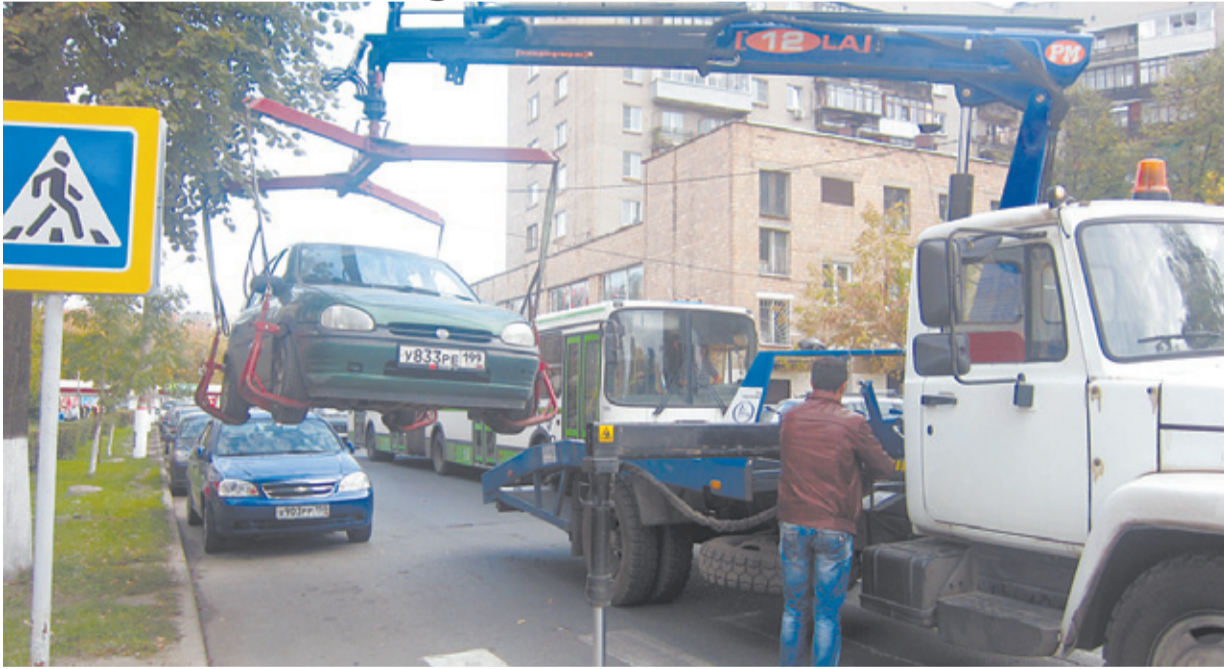
Идёт эвакуация автотранспорта