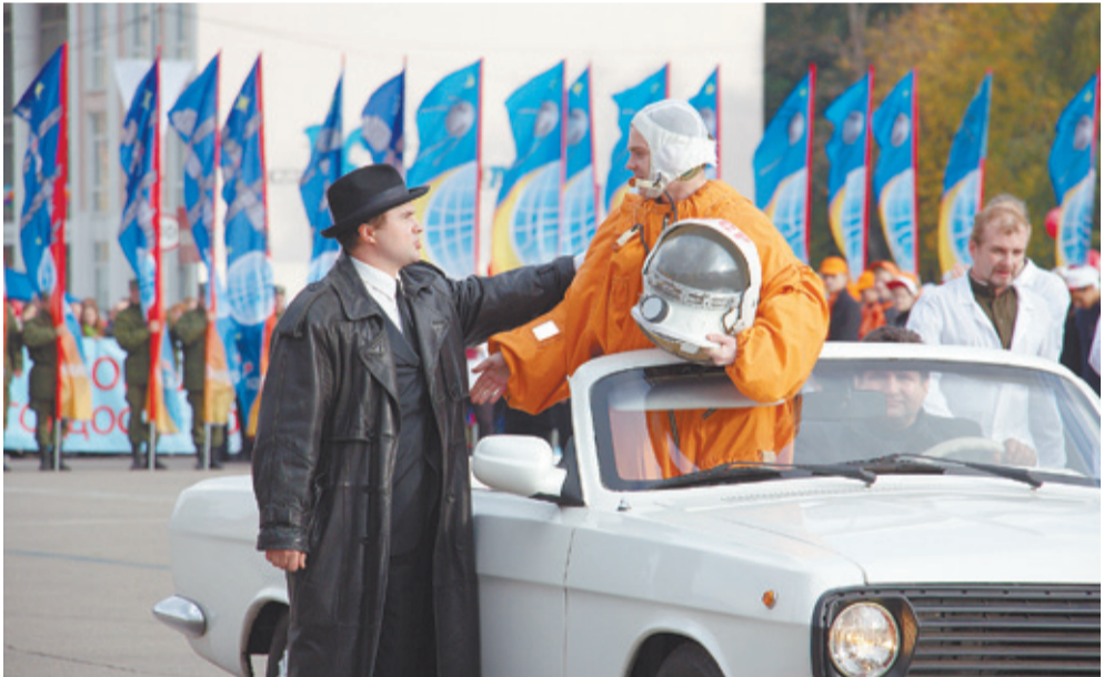
Фрагмент исторической реконструкции: Королёв и Гагарин

И одно из них в этот день было наглядно продемонстрировано: такого красочного и массового флешмоба Королёв ещё не видел. Его смысловой доминантой стало выступление артистов Королёвского ТЮЗа, инсценировавших страницы славной истории города, начиная с 1938 года, когда Указом президиума Верховного Совета СССР был образован город Калининград. В довоенные годы на расположенном на его территории заводе № 8 было выпущено 56 тысяч различных орудий, что значительно превысило объём продукции всех заводов страны вместе взятых. Достижения калининградцев были отмечены орденом Ленина.