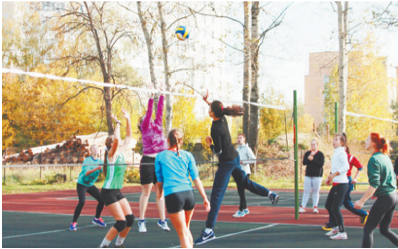
Соревнования на стадионе «Вымпел»

Частью большого праздника для жителей нашего города стал турнир по дворовому футболу на стадионе «Чайка» с участием непрофессиональных команд Королёва и Юбилейного, в котором отличился «Салют», чья победа пополнила копилку награда нового Большого Королёва.