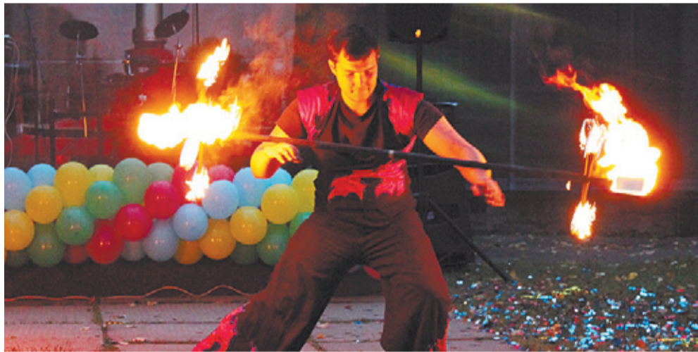
Огненное шоу в первомайке

Праздник города – это веселье, музыка, шоу, танцы... В микрорайоне Первомайском по традиции людей собрал Молодёжный Культурный Центр на стадионе. Люди полны надежд на обновление в результате объединения Королёва и Юбилейного. Каждый строит планы на новую жизнь бывшего фабричного посёлка. Глаза детей горят, взрослые обмениваются последними новостями, но постепенно ноги сами начинают пританцовывать от желания праздника!