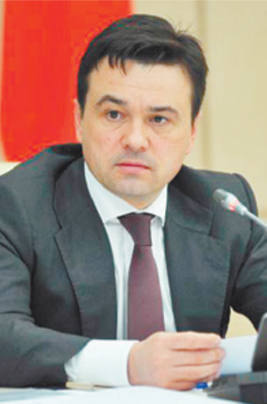
Губернатор Андрей воробьёв

По мнению руководителя Подмосковья, единая идеология по-