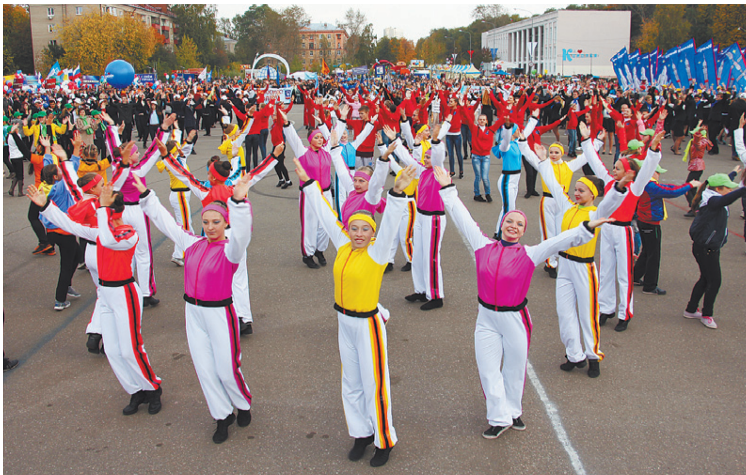
День города был ярким, массовым, зрелищным

«НАС СТАЛО БОЛЬШЕ» ПРАЗДНИК ПОД ЭТИМ ДЕВИЗОМ 27 СЕНТЯБРЯ ПРОШЛО ПЕРВОЕ ПРАЗДНОВАНИЕ ДНЯ ГОРОДА В ОБЪЕДИНЁННОМ КОРОЛЁВЕ. ЗНАКОВУЮ ВЕХУ В ИСТОРИИ НАУКОГРАДА, СТАВШЕГО САМЫМ БОЛЬШИМ В РОССИИ, ОРГАНИЗАТОРЫ ОТМЕТИЛИ ТОРЖЕСТВОМ НЕБЫВАЛОГО РАЗМАХА.