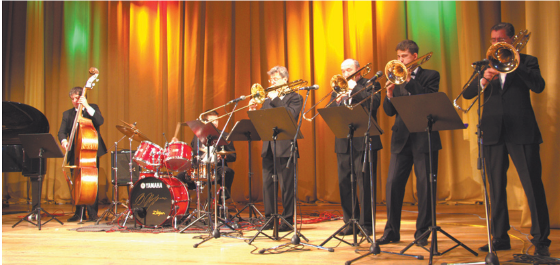
На сцене оркестр Олега Лундстрема