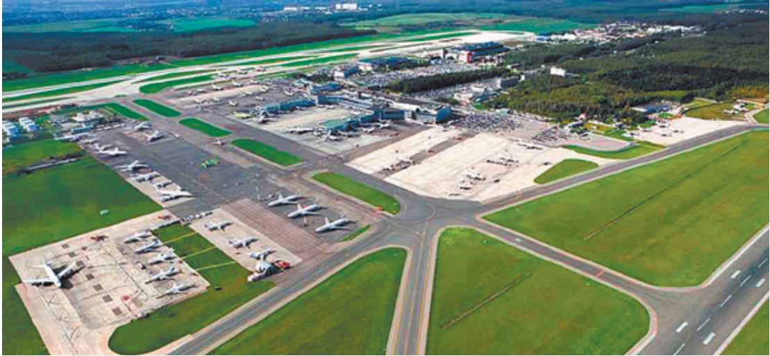
Губернатор проверил строительство взлётно-посадочной полосы аэропорта

Кроме того, губернатор Подмосковья провёл совещание «Перспективное развитие Московского аэропорта Домодедово как катализатор экономического роста южного Подмосковья». Основными темами докладов стали модернизация транспортной инфраструктуры района, развитие системы профессионального образования, реализация программы «Приток». Ранее Министерство образования Московской области и руководство аэропорта «Домодедово» подписали соглашение о сотрудничестве по данной программе, направленной на подготовку высококвалифицированных специалистов.