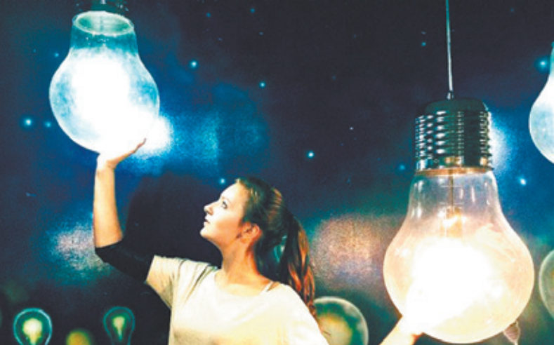
В музее оптических иллюзий

Итак, о музее. Хотя, попав туда, вы скорее назовёте это какой-то Арт-выставкой или творческим проектом. Весь смысл музея заключается в стенах, покрытых 3d рисунками, на фоне