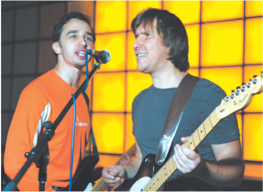
Выступление участников рок-клуба МКЦ

– Да. К примеру, у нас единственные в Королёве рыболовный клуб и Театр мод «Бу-