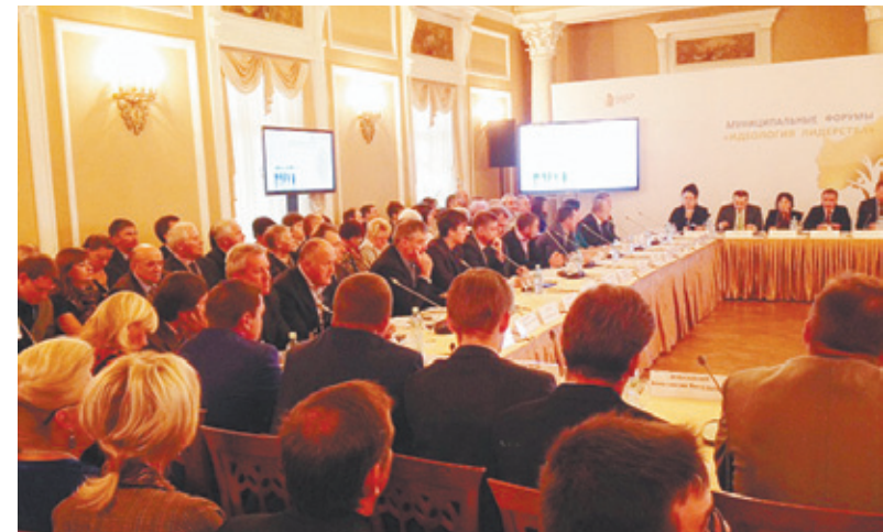
На заседании форума «Идеология лидерства»