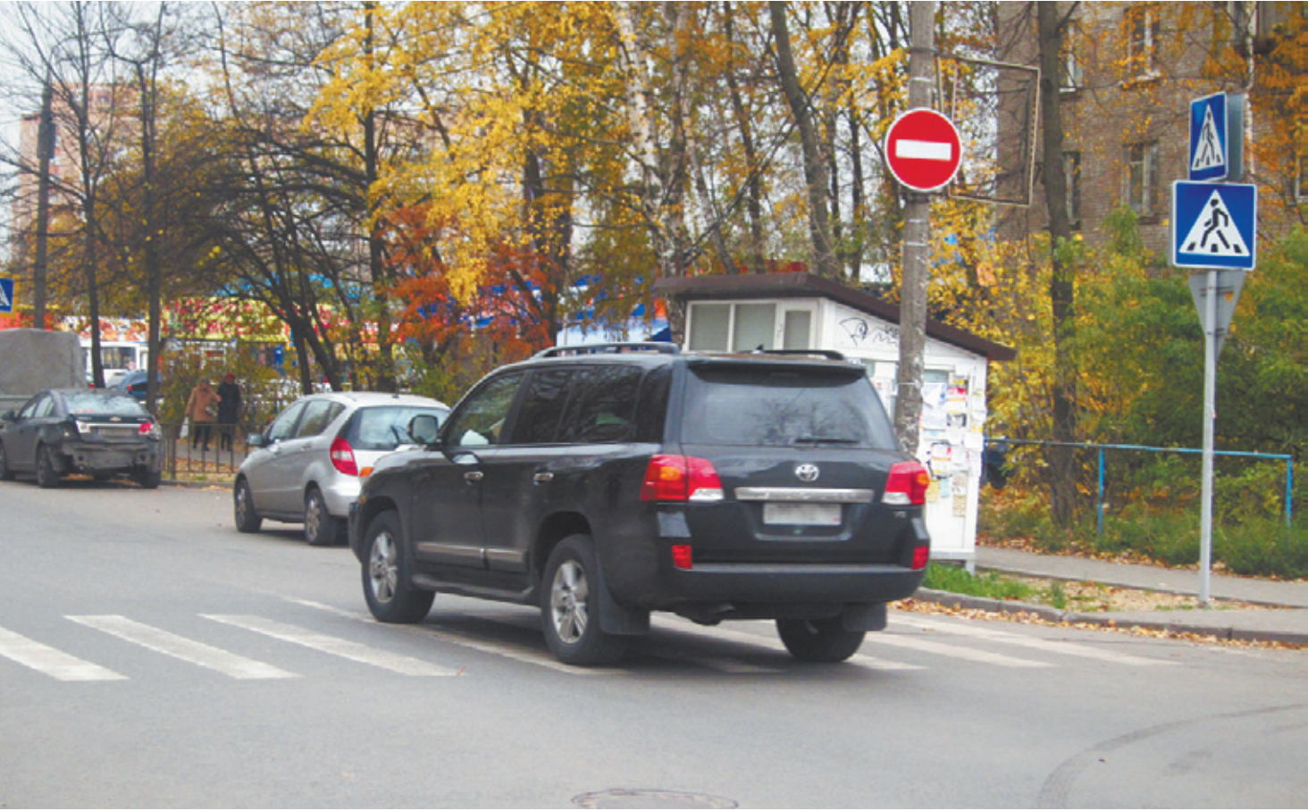
Автомобилисты продолжают нарушать правила, проезжая под «кирпичём», но уже меньше, чем 3 месяца назад