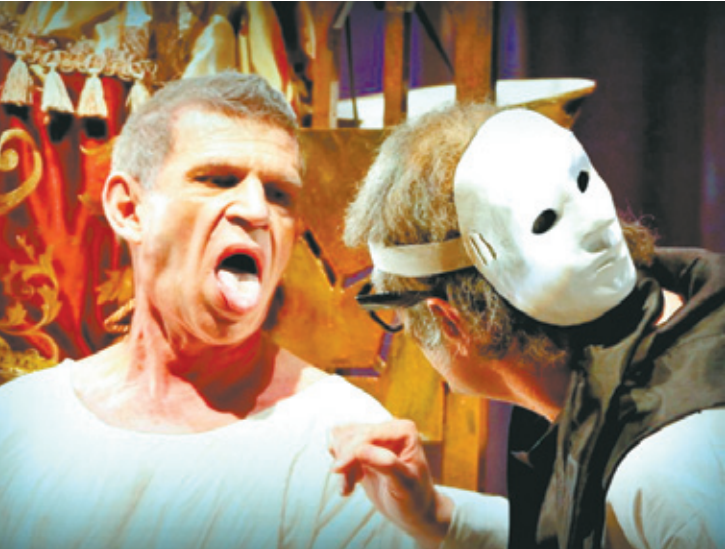
Сцена из спектакля «Минуты короля»