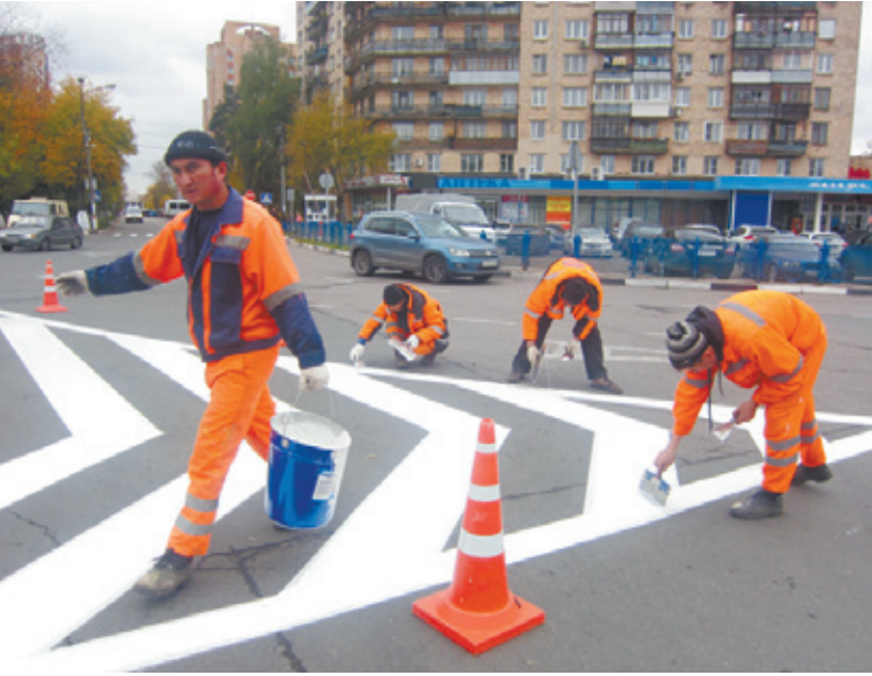
Рабочие наносят новую разметку

7 ОКТЯБРЯ РАБОТНИКИ МУП «АВТОБЫТДОР» ОБНОВИЛИ ДОРОЖНУЮ РАЗМЕТКУ НА ПРИВОКЗАЛЬНОЙ ПЛОЩАДИ ПЕРЕД УНИВЕРМАГОМ «ЗАРЯ». ПОВЕРХ СТЁРТОЙ РАЗМЕТКИ, ЧТО БЫЛА НАНЕСЕНА ЭТОЙ ВЕСНОЙ КРАСКОЙ, ОНИ ПОЛОЖИЛИ ХОЛОДНЫЙ ПЛАСТИК, РАССЫПАВ ПО НЕМУ СТЕКЛЯННЫЕ МИКРОШАРИКИ.