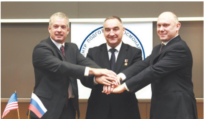
Стивен Свонсон, Александр Скворцов и Олег Артемьев