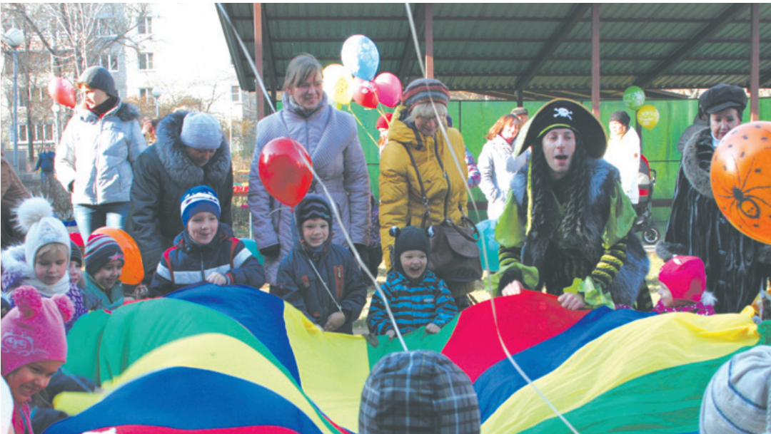
Настоящий праздник для детей

Дела городские: заседание Коллегии администрации