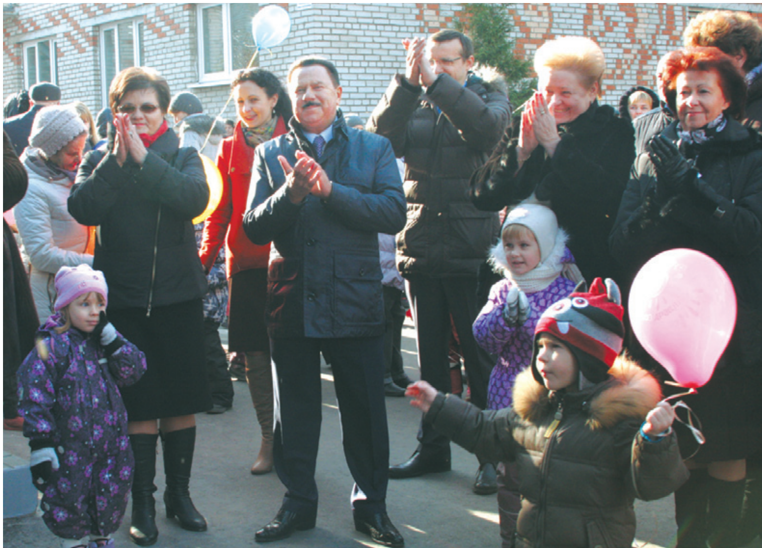
На церемонии открытия детского сада присутствовал глава города Александр Ходырев

ДОЛГОЖДАННОЕ СОБЫТИЕ ПРОИЗОШЛО 27 ОКТЯБРЯ В ЮБИЛЕЙНОМ – ЕЩЁ ВЧЕРА ГОРОДЕ, А СЕГОДНЯ МИКРОРАЙОНЕ БОЛЬШОГО КОРОЛЁВА – ТОРЖЕСТВЕННАЯ СДАЧА В СТРОЙ ДЕТСКОГО САДА.