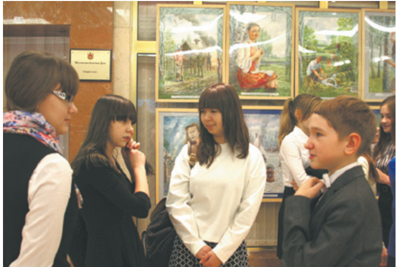
Волнение перед открытием выставки

Особенно долго все задержались в зале рабочих заседаний. Здесь в креслах не только депутатов, но и руководителей Думы каждый смог хоть чуть-чуть почувствовать долю ответственности, которая лежит на законодателях. Гости узнали о мно-