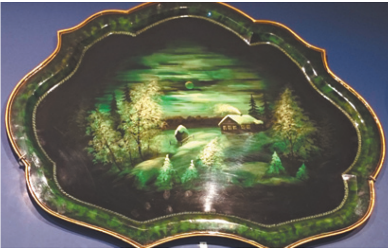
Один из экспонатов музея

торые завораживали, другие уводили в размышления. Сюжет одного подноса меня особенно увлёк (на фото). Такой таинственный, зелёный, в холодных тонах... Ещё нам рассказывали разные смешные истории про жостовских мастеров. Вот одна такая история: мастер пытался нарисовать розу (символ Жостово), но у него это не получалось, и все говорили, что его розы похожи на капусту. И художнику пришла мысль: «А что, если нарисовать капусту вместо розы?» И он нарисовал зайца с капустой и корзиной овощей. И потом все говорили, что его капуста нарисована, как роза. У каждого мастера, конечно, есть учитель. Один из них был ужасным критиком. Когда мастера заканчивали работы, он смотрел: стоит или нет вывешивать и продавать такой поднос. Если ему не понравилось, то перечёркивал и размазывал узоры на подносе. В общем, трудно приходилось мастерам... А чтобы каждый из нас смог почувствовать себя художником, для нас провели мастер-класс. Мы рисовали на подносах красивые цветы.