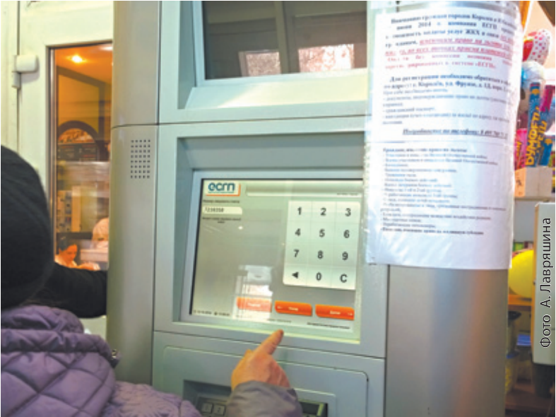
Терминал, работающий в системе ЕСГП

Нужно взять с собой паспорт, пенсионное удостоверение, квитанции об уже оплаченных в предыдущем месяце коммунальных услугах, электроэнергии, газа; выписанный на листок номер домашнего и мобильного телефонов, а также лицевой Интернет-счёт, если таковой имеется, прийти в офис Единой системы городских платежей (ЕСГП). Не забудьте (!) и документ, подтверждающий вашу принадлежность к льготной категории граждан (например, удостоверение инвалида, а для неработающих пенсионеров и инвалидов 3-й группы – оригинал трудовой книжки). Офис находится в полукруглом здании напротив рынка по адресу: улица Фрунзе, дом 1д, корп. 1. Работает с понедельника по пятницу с 10.00 до 18.00, а в субботу с 10.00 до 16.00.