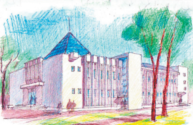
Карандашный набросок Е. Кувинова обновлённого МКЦ

реконструкцией здания. Известный королёвский архитектор и художник Евгений Кувинов совершенно бескорыстно сделал эскизы проекта, которые были представлены на 25-летию МКЦ руководству комитета по культуре города в 2013 году, проект был признан интересным. На предвыборном форуме в этом году мы внесли тезис о реконструкции центра в программу развития города Королёва. В ближайшее время будут готовы дополнения в эскизы проекта реконструкции и пакет документов для представления новому руководству нашего города. Чтобы реализовать этот проект, нам необходимо всё здание целиком, т.е. нужно вернуть часть МКЦ, когда-то отданную в пользование спортсооружениям. Надеюсь, перспективы реконструк