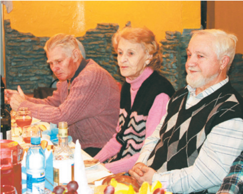
По традиции, дети и внуки репрессированных вспоминают своих близких