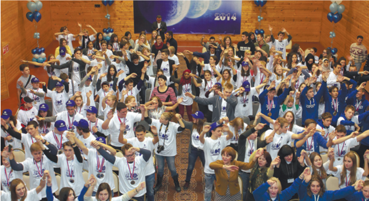
До встречи на XXIII Международной космической олимпиаде!

– Я очень рад, для меня это большой успех! Не ожидал, что смогу