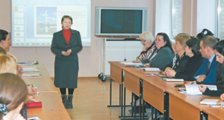
Директор профессионального техникума рассказывает о профилактике правонарушений среди учащихся

В нём приняли участие не только члены комиссии – представители администрации города, правоохранительных органов, Центра занятости населения, медицинских учреждений, педагоги – те люди, первоочередная задача которых – защита прав несовершеннолетних, но и учащиеся техникума.