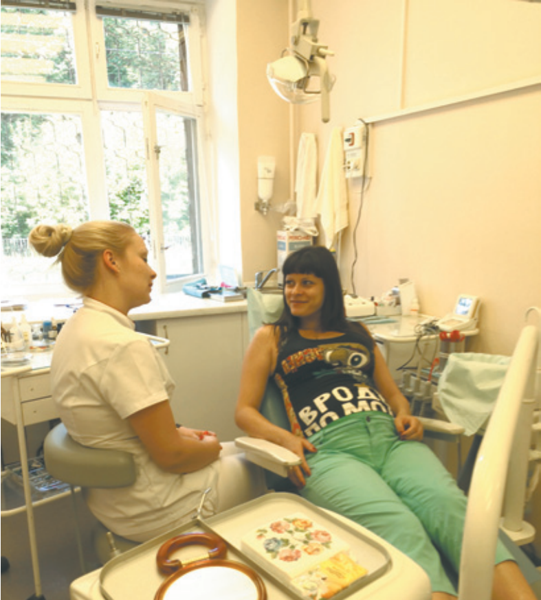
Приём будущей мамы

мутаций) и стоматологу соответственно. Согласно приказу Минздрава, осмотр беременных врачом-стоматологом проводится не менее двух раз за всю беременность. Помощь оказывается в рамках системы обязательного медицинского страхования. В Королёвской стоматологической поликлинике совместно с кафедрой обезболивания в стоматологии МГМСУ им. А.И. Евдокимова разработана специальная схема оказания стоматологической помощи беременным, с учётом сроков и сопутствующей акушерской патологии. Для каждого триместра подбирается индивидуальный план работы с беременной женщиной, учитывается каждый конкретный случай. При работе с беременными наша основная задача – комплексная санация полости рта будущей мамы. Это важно для профилактики развития послеродовых осложнений и возникновения пороков развития челюстно-лицевой области и твёрдых тканей зубов у детей. Это достигается путём слаженной работы наших врачей-стоматологов всех специализаций: терапевтов, хирургов и при необходимости ортопедов, ортодонтов, а также детских врачей-стоматологов.