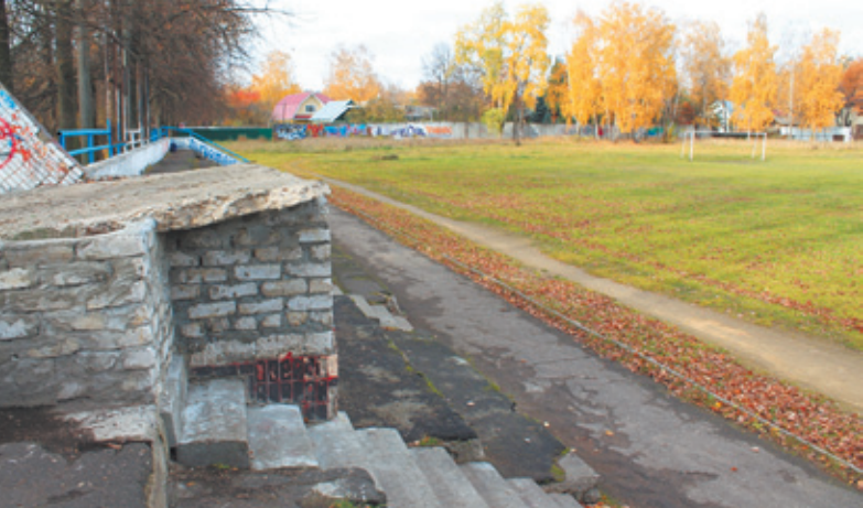
Трудно разглядеть в этом пустыре спортивный объект

Первый. Застройщик этого микрорайона «ПРОФИ-Инвест» сейчас начнёт осуществлять планы по ликвидации ветхого жилья и расселению людей, и он согласен реконструировать стадион в тех рамках,