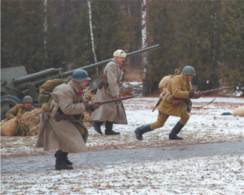
Реконструкция событий 1941-го года