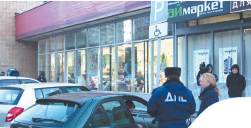
Отсутствие парковочных мест – не повод нарушать правила

Именно для бесед с нерадивыми водителями были привлечены члены Общественного совета полиции, ведь поговорить по душам проще с таким же