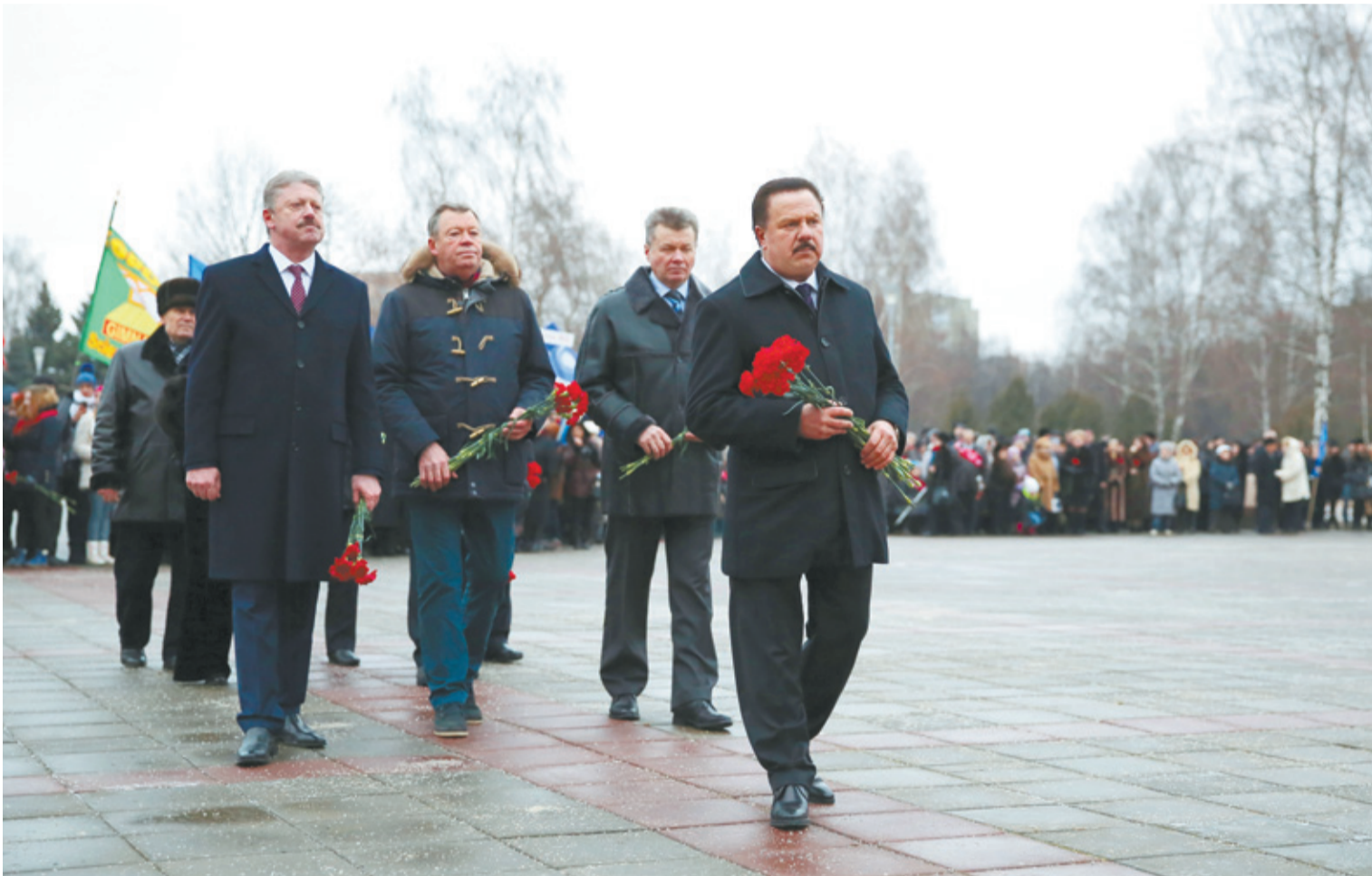
Торжественное возложение цветов к Мемориалу Славы

5 ДЕКАБРЯ В ЦЕНТРЕ КОРОЛЁВА ОТРЫВИСТО ЗВУЧАЛИ ВЫСТРЕЛЫ И ОТЗВУКИ КАНОНАДЫ... НО НИЧЕГО СТРАШНОГО НЕ ПРОИСХОДИЛО! ГОРОД ОТМЕТИЛ ГОДОВЩИНУ НАЧАЛА КОНТРНАСТУПЛЕНИЯ СОВЕТСКИХ ВОЙСК ПОД МОСКВОЙ В ГОДЫ ВЕЛИКОЙ ОТЕЧЕСТВЕННОЙ ВОЙНЫ.