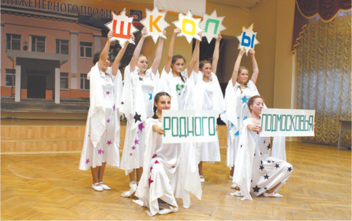
Лицей научно-инженерного профиля г. Королёва принимает гостей

Более 1500 лучших учителей Подмосквья, среди которых победители профессиональных конкурсов, победители ПНПО, лидеры образования Подмосквья, а также молодые педагоги приняли участие в мероприятиях Педагогической ассамблеи. Всего было проведено около 300 открытых уроков, мастер-классов, круглых столов, творческих