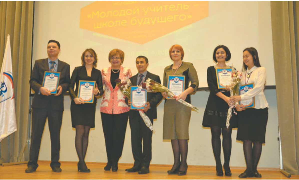
На Съезде «Молодой учитель – школе будущего»

5 декабря молодые специалисты приняли участие в Пленарном заседании II Всероссийского съезда молодых учителей «Молодой учитель – школе будущего», организаторами которого выступили Министрство образования и науки