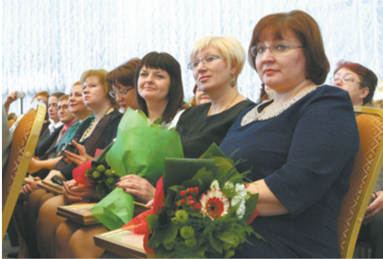
Именные премии получили 226 учителей

В числе лучших были отмечены 4 учителя из Королёва.