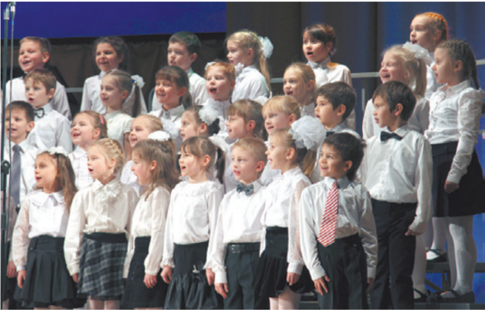
Юные участники хора «Росинка»