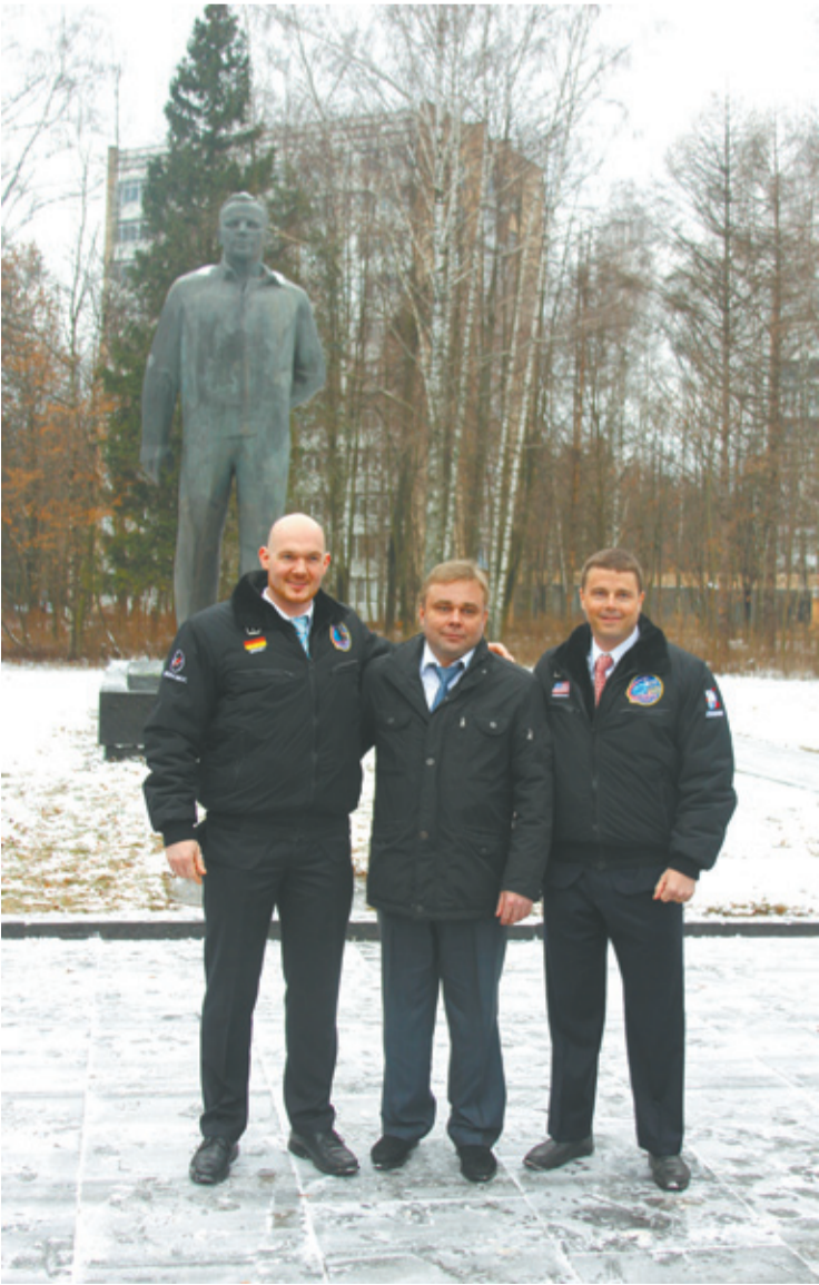
Александр Герст, Максим Сураев и Рид Вайзман