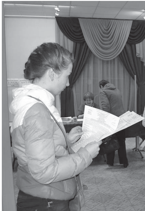
Молодёжь активно участвовала в голосовании