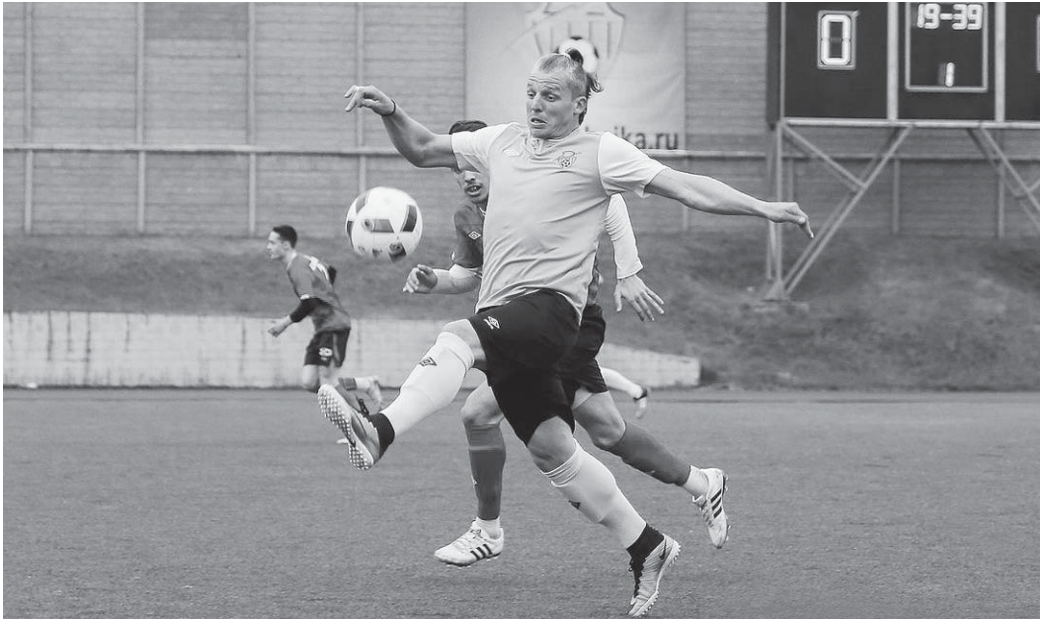
«Чайка» – «Витязь» – 5:1