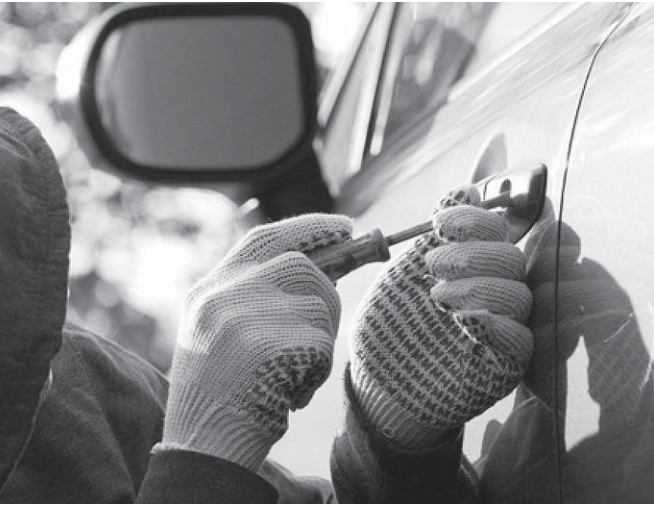
О подозрительных лицах стоит сообщить в полицию

Для профилактики кражи автомобиля специалисты рекомендуют использовать надёжную систему сигнализации, которая должна срабатывать не только в отношении центрального замка транспортного средства. Не мешает проявить бдительность и в случаях её ложного срабатывания. В центральных СМИ приводился такой пример коварных замыслов похитителей автомашин. В ночное время преступники провоцируют многократное срабатывание сигнализации транспортного