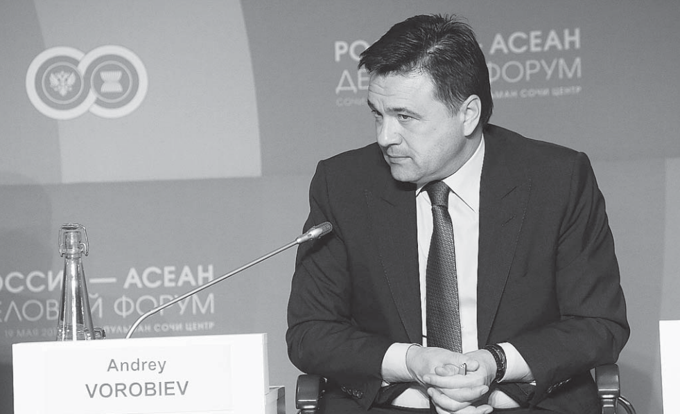
Губернатор Московской области поделился опытом привлечения инвестиций в регион

– Подмосковье привлекло инвестиции практически из всех стран АСЕАН. Поделитесь опытом, как вам это удалось, – сказал он, обращаясь к Андрею Воробьёву. – У нас работают три особые экономические зоны. Например, за первый квартал в Дубну пришли порядка 15 резидентов,