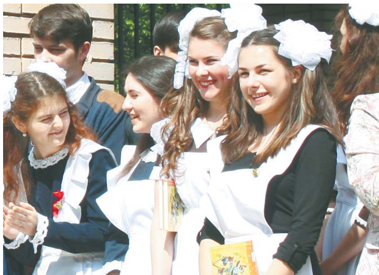
Юные, красивые, успешные!

26 мая в 19.00 на телеканале «360° Подмоскowie» пройдёт прямой эфир губернатора Московской области