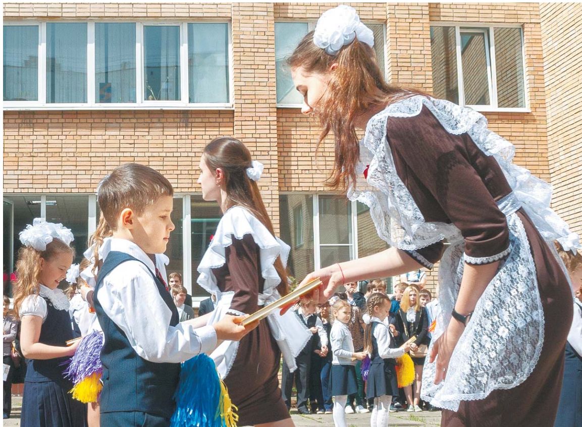
Одиннадцатиклассники школы № 5 подарили первоклашкам книжки

Последний звонок для выпускников школы № 5 прозвенел в школьном дворе. Одиннадцатиклассники и пели, и говорили тёплые слова в адрес своих учителей. С забавными стихами