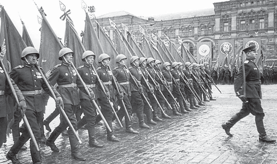
Парад Победы на Красной площади, 1945 г.

Сводные полки, прибывавшие в Москву для участия в параде Победы, размещались в военных городках Московского гарнизона. Пришлось потесниться и курсантам Московского военно-инженерного училища. Вместе с ними к предстоящему параду готовились сводные полки 1-го и 3-го Украинских фронтов. В пешем строю должны были пройти донские, кубанские и терские казаки, и сам Будённый приезжал в Болшево проверить их слаженность в строю.