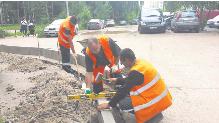
Дорожники меняют бордюрный камень

Согласно плану, через месяц, к 13 июля, здесь должны быть