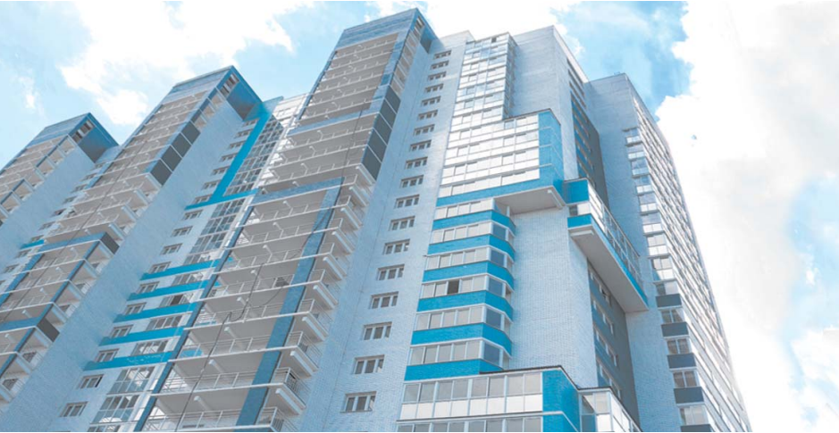
Около 900 дольщиков ждут квартир в новых домах