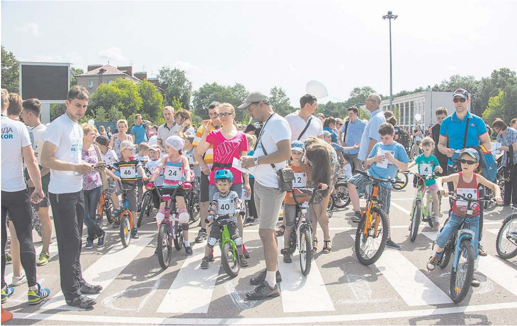
Юные велосипедисты к старту готовы