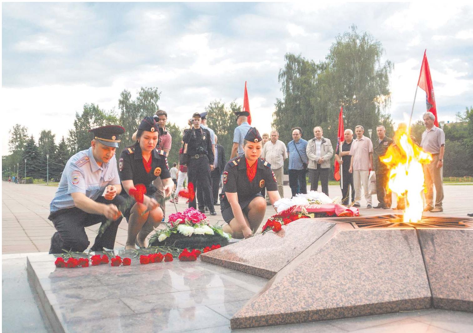
22 июня в 4 часа утра к мемориалу Славы были возложены первые цветы...