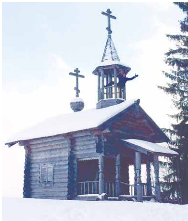
Мы забрались на часовню в деревне Мызе.

стоит на пригорке. Мы забрались на неё, какие же виды открываются оттуда! Конечно же, состоялась фотосессия.