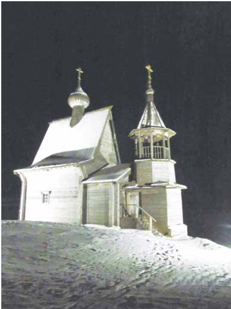
Подсвеченная на ночь часовня Святого Николая села Вершинино.

храмовый комплекс в Ошевенске. И вот мы в селе Вершинино, в гостевом доме.