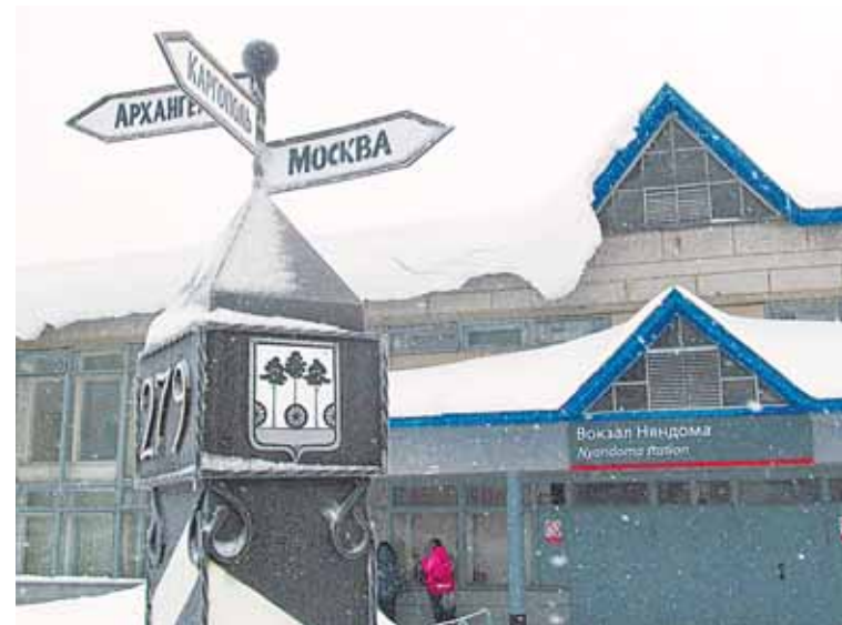
Из Няндомы можно отправиться в три великих русских города.

Поча. У местного дома культуры (на нём ещё красуются серп и молот советских времён) устроили перекус. Обратный путь проходил через деревню Мыза. В этой деревне часовня